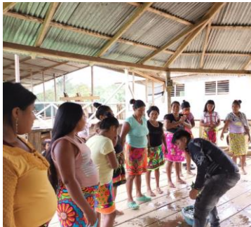
Ilustración 18 fuente primaria baño con planta medicinal santa maria por foto tomado de charibi bialarin 2020

Gemené significado de vida para el cuidado de la niña Embera Eyabida de la comunidad Chagejaro en el Municipio de Murindó, Antioquia