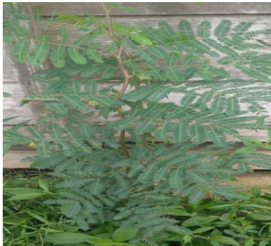
Ilustración 26 planta sagrada utiliza en el Gemené de la niña, foto tomado por Suruko Sinigui Pernia 2023

Esta planta ancestral medicinal no nos sirve para hombres, jóvenes, mujeres infieles, también se utiliza cuando la niña cumple su primer menstrual, las sabias cuenta que la planta beumia kidua también es bueno convertirlo de la infidelidad a fiel con su pareja, la abuela a la niña se aconseja ,pero las planta ancestral coge en el dia de la luna buena,no se coge en cualquier tiempo de la luna si no el dia de la luna de la siembra , se calienta las hojas en el fuego y luego la niña se desnuda para hacer la purificación con las plantas en el cuerpo de la niña ,es para cuando se coge su pareja sea una mujer fiel decente y prudente con su marido y con los demás personas en la vida cotidiana para la nueva generación sean ejemplo a los demas mujeres,por eso las sabias antes que sacarlo del encierro de niña de la pubertad tenía preparado las plantas tradicionales,las mujeres de antiguo mantenía curada con las plantas medicinales, las mujeres de ante vivía un hombre sin enamorar otro hombre,estas plantas también sirve para controlar la persona que tiene celos a las mujeres y