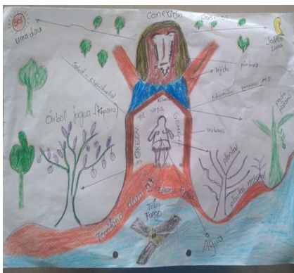
Ilustración 28 dibujo por Suruko Sinigui Pernia 2023