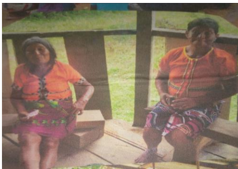
Ilustración 23 dos sabias sabedoras de la ley de origen y práctica de Nekua Gemené Gemené de la niña de pubertad 2022

Para los embera eyabida son importantes el Gemené, que es Nekua Gemené genene de purificación de las niñas, para que sean resistentes, también sean buenas personas y no se envejezcan rápido a la niña, la madre y las familiares se cuidan a la niña en el primer día y luego el padre se busca la jagua kipara para hacer la niña pintar en los cuerpos y en la cara es para la protección contra las alergias de la niña.