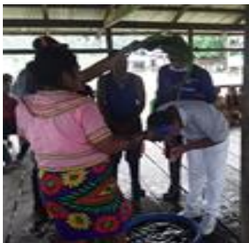
Ilustracion 4 purificacion en el encuentro comunitario con plantas medicinales foto tomado por mi hermanita filomena sinigui 2018

Los sitios sagrados están desde la creación del mundo, nuestro señor Dios Karagabí dejó ordenados cada sitio para que fueran acopio de nuestra memoria ancestral de cada pueblo, los jaibaná a través de estos sitios se relacionan con sus espíritus, y además son lugares sagrados que no se pueden tocar porque hay animal salvajes, esos lugares son peligrosos para la personas que no esté protegidos por el jaibaná, por eso este lugar es importante conocer los sitios para prevenir del peligro, por eso es importante sensibilizar nuestra futura generación, además la sociedad humana. porque está todos, todas conectada con Nekua GemenéGemené.