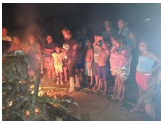
Ilustración 18 encuentro con los padres de familias observación primera práctica del Gemené 2021