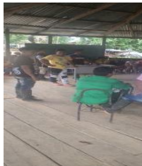
Ilustración 16 encuentro con los sabios, sabias foto tomada por Abilia Waseruca 2020

Mi rol como estudiante es revitalizar Nekua Gemené el ritual, a través de la teoría y práctica trabajo con los niños, niñas, jóvenes, grupos mujeres, hombres.