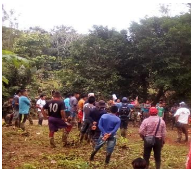
Ilustración 19. Recorrido en el territorio Chageradó con sabios, sabias enseñando diferentes especies de plantas sagrada, foto tomado por Yeison Domico Upua 2020

Nekua Gemenéy el ritual para los pueblos indígenas son iguales inalienables, inembargables , imprescriptibles por que no se puede olvidar la identidad cultural en la comunidad embera, para los pueblos embera Nekua Gemenéy el Gemené es una herramienta que el estado reconoce como la diversidad étnica