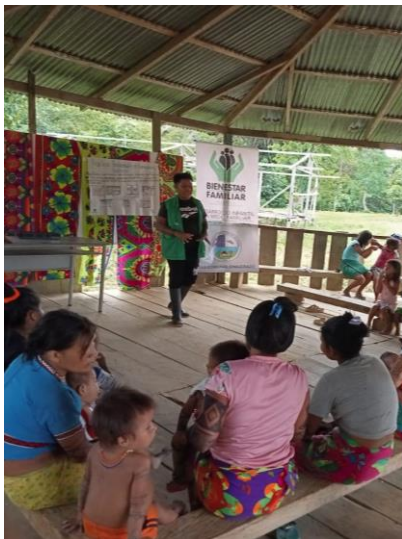
Ilustración 27 dialogo con las sabias sobre la practica de la niña de pubertad foto tomado por Jose Luis bailarín 2023

Esta identidad de la modalidad intercultural de los pueblos indígenas de la comunidad de Chagejaro en la parte de Nekua Gemenégenene podemos construir a trabajar con la nueva generación en generación en la mano, para fortalecer nuestra la calidad de los pueblos indígenas de Chageradó, este pensamiento que he dados los sabios, sabias, para construir el tejido de los ancestrales puede tejer con todos para estar la vida tranquila en la comunidad, esta estrategia es para la recuperación de los tejidos de los ancestrales de la comunidades indígenas de Chageradó de Nekua Gemenégenene¿por que es importante rescatar los conocimientos saberes en la comunidad?para la