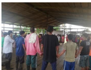
Ilustración 19 encuentro con la autoridad diálogo de tema de Nekua Gemené foto tomado por Harold Sinigui Upua 2021

Para lograr desarrollar este camino de metodología realice esto: