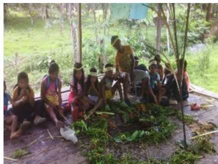
Ilustración 110 ritual con los niños, niñas foto tomado por Suruko Sinigui p 2020

Este trabajo en la comunidad fue súper de la siembra de la semilla de nekua, porque los líderes aportaron sus conocimientos para tejer la historia de los pueblos indígenas, la nueva generación a través de esta práctica mostró física que en cada corazón se siembre para siempre para fortalecer Nekua Gemené Gemené. En este diálogo en la comunidad fueron aportados todos para la construcción de Nekua Gemené el ritual. Este Nekua Gemené los estudiantes de la comunidad se practico para recuperar la identidad cultural.