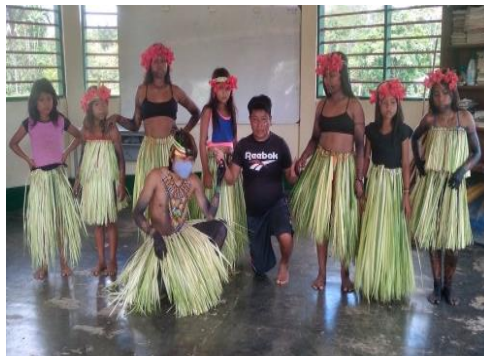
Figura 2. Presentación del Gemené con traje ancestral en la comunidad Chageradó, autor. Jhon Jair Bailarín 2018.

La palabra embera significa gente. Los Embera Eyabida viene de la montaña, es habitantes de la selva guardianes, el origen de embera eyabida proviene de la Madre Tierra, conexión con la mayora naturaleza, cuida y mantiene territorio libre de contaminación, el agua, aire, las plantas, sitio sagrado, animales, las familias eyabida, antiguamente eran nómada no vivía quieto en un solo lugar, todos embera eyabida las familias eran Jaibana (médico ancestral). Los embera Jaibana se reconocían y respetaba, el mayor Tone - Cacique Kirunbida, estos personajes eran poderosos en los espíritus malos y buenos.