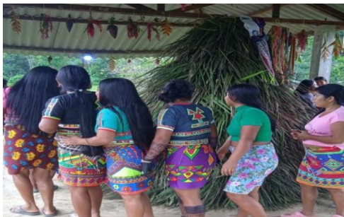
Ilustración 22 danza alderdor del encierro de la niña en la puberad, foto tomado por Suruko Sinigui Pernia 2022

Mi semilla de Nekua Gemené Gemené en la comunidad de Chagejaro Departamento de antioquia y Municipio Murindó con una danza ancestral, este texto anexo con soporte visual que es fundamental para los pueblos embera oibida y demás mostrar en práctica a la nueva generación en la comunidad Chagejaro