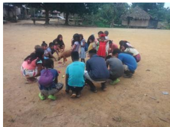
Ilustración 17 armonización con los niños, niñas de los cuatro puntos cardinales foto tomada por Filomena Sinigui, 2021