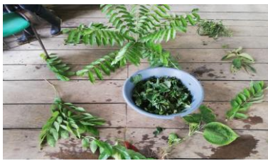
Ilustración 24 plantas sagrada curativa de las enfermedades foto tomado por Suruko Sinigui Pernia2022

Identificar las plantas medicinales utilizadas Nekua Gemenéen la comunidad embera de Chagejaro