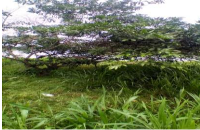
Ilustración 25 planta medicinal Árbol de Pichindé (2022).