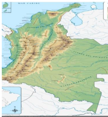
Ilustración 9 mapa colombia

la comunidad de Chageradó se encuentra en suramérica en el país de colombia en el departamento de antioquia en la zona atrato medio limitado con choco-quistadó el Municipio Murindó la comunidad Chageradó se encuentra en la cabecera y se dividen en dos resguardos, resguardo río murindó y resguardo río Chageradó, está formado por comunidades.