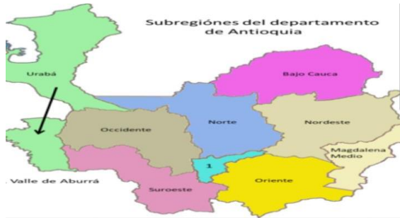
Ilustración 8 mapa del departamento antioquia

Gemené significado de vida para el cuidado de la niña Embera Eyabida de la comunidad Chagejaro en el Municipio de Murindó, Antioquia