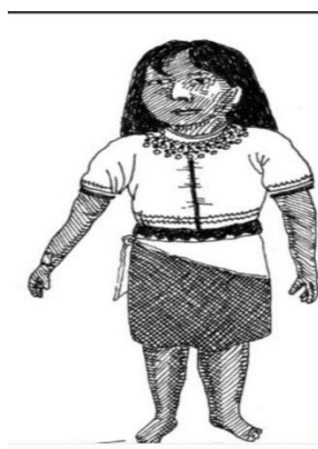
Figura 3. Dibujo de vestido del Gemené ancestral Suruko Sinigui. 2018

Los embera eyabida de la cultural tenía su propia vestido y pintura facial corporal música era la flauta el canto(truambi)de animales y de los pájaros en la vida embera eyabida maneja tres cultura fundamentales,cultura y el arte canto son los elementos fundamentales de la vida embera eyabida la representación estaba en artístico en la música,la cestería,la talla en madera y en los adornos corporales de shakira era las frutas de anta koroso de palma,pero la simbología y significado la marca se encontraba en los cuerpos de culebras (dama)el ejemplo,también había encontrado para tejer shakira en la mariposa(bagabaga),en las flores(nepono),los sabios embera de acuerdo a la observación que veía de los animales que se aprendió tajar de diferentes tejidos,ese tejido era la educación ancestral porque que he aprendido empíricamente los tejidos,también la escucha he aprendidos escuchandos de los mayores pájaros,la música se expresaba con la naturaleza,acompañada,los rituales de nacimiento,los sabios embera cacique estaba conectada con