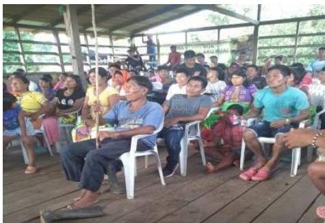
Ilustración 20 dialogo con los sabios, sabias del ritual y Gemené. Foto tomado por Suruko Sinigui Pernia 2020

En la materia de Nekua Gemenéy el ritual y la conservación de saberes ancestrales de la comunidad embera de Chagejaro, las personas que participaron en el taller fueron muy activo y activa en la reunión y también en la socialización fueron muy participativos y en el taller llegaba a la hora puntual y ellos son decentes, prudente-responsables y humildes con todas las personas, durante los ejercicios en la comunidad fueron un equipo excelente en el taller de Nekua Gemenégenene en la comunidad, Nekua Gemenéde los saberes ancestrales