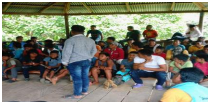
Ilustración 10 socializacion del encuentro de Gemené foto tomado por nelso sinigui 2019