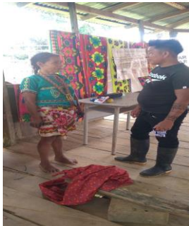
Ilustración 61 conversacion con sabia sobre la historia foto tomado por janachibi 2019