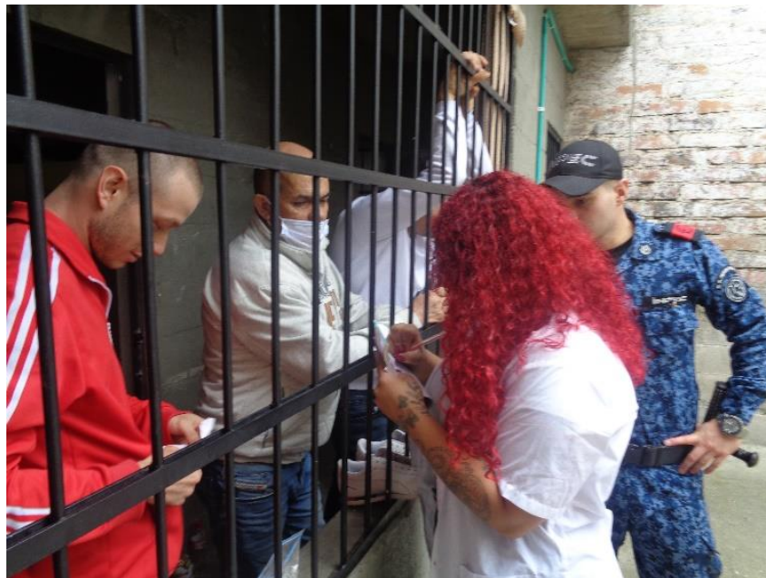
Figura 8 Entrevista a internos nuevos