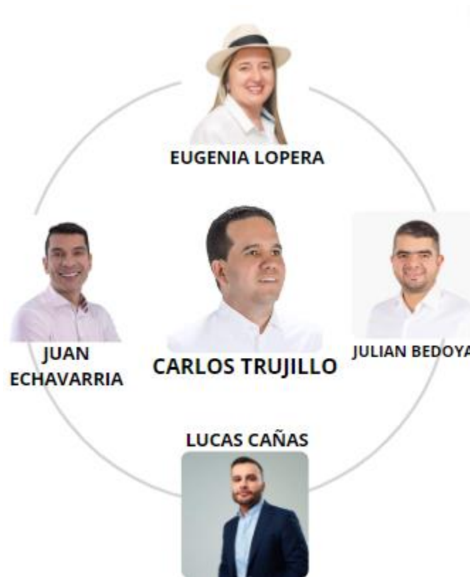
Figura 2 Clan Trujillo