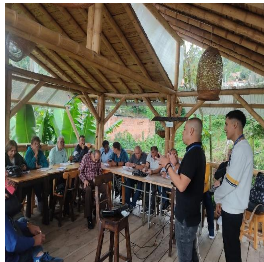
Capacitación Proyectos CIPT y comunidad general del Municipio