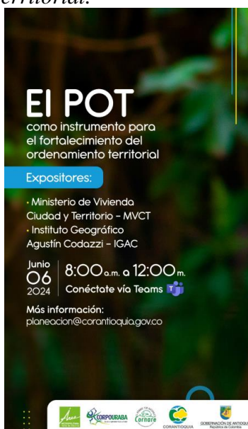
Ilustración 4. Invitación Encuentro virtual N°13 - El POT como instrumento para el fortalecimiento del ordenamiento territorial.

En las Tablas 9 y 10, vemos el registro entre los años 2022 y 2023, en el primero se acompañaron a 71 municipios, es decir, aproximadamente el 57% del total departamental, y en el segundo año mencionado, solo 35 entidades, sin embargo, se realizaron 22 capacitaciones al Concejo Municipal sobre POT y su labor en la aprobación y seguimiento. En este registro no se suman los municipios que asistieron a los encuentros en el marco del Comité Interinstitucional, ya que se hace una convocatoria masiva, pero encontramos una descripción del tema y del evento y la imagen de la invitación (Se puede observar un ejemplo en la Ilustración 4)