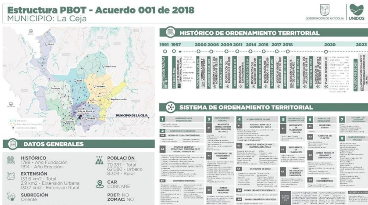
Ilustración 3. Ejemplo ficha tablero “Estado Planes de Ordenamiento Territorial (POT)”, Municipio de la Ceja.