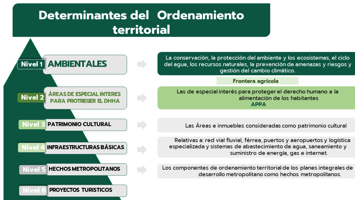
Ilustración 6. Determinantes del Ordenamiento Territorial Ley 2294 de 2023.