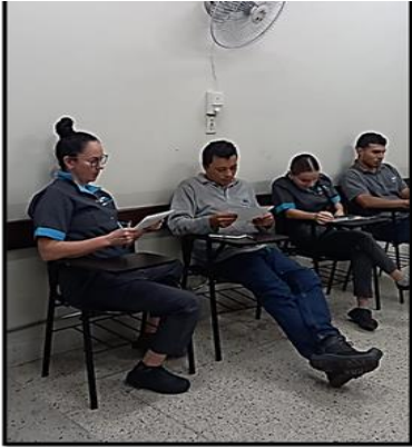
Imagen taller: la empatía