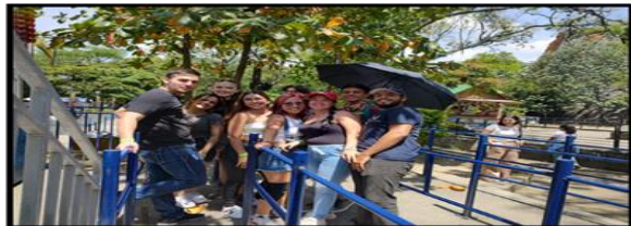
Imagen salida parque norte