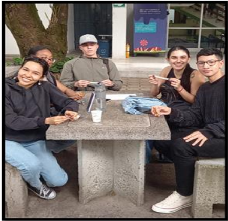
Imagen microtaller: el dulce de la suerte