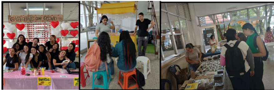
Imágenes gózate tu facultad