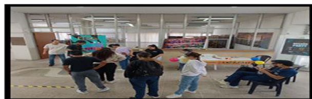
Imagen actividad placer sin riesgo