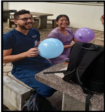
Imagen microtaller: manejo del estrés