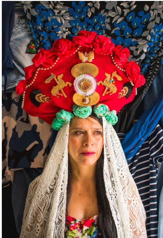
Dar de sí, fotografía digital, 2020.