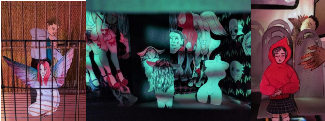
El despertar de la muñeca, 3 dioramas (técnica mixta) 25 x 40 x 30 cm, 2021.

El disfrazarse le permite a los niños potenciar su imaginación y jugar a ser lo que quieran ser, a la vez que les ayuda en su proceso de socialización y aprendizaje; por esta razón es igualmente preocupante cómo los medios de comunicación y la industria textil continúan perpetuando los estereotipos de géneros por medio del disfraz, encontrándonos fácilmente con disfraces hipersexualizados dirigidos a mujeres o niños, y de superhéroes y figuras de poder o violencia.