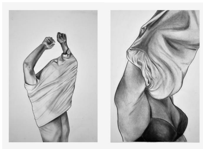
Serie Veladuras, carboncillo sobre papel, 35 x 50 cm, 2019