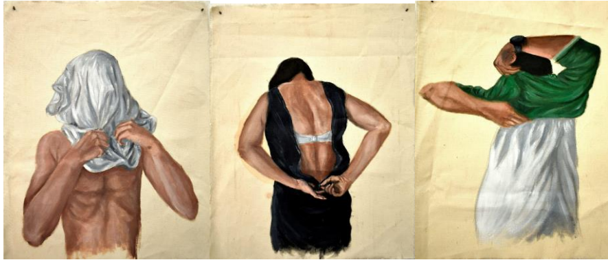
Serie Veladuras, óleo sobre tela, 35 x 50 cm, 2019.

En la actualidad, donde la industria de la moda y la mentalidad consumista manipulan nuestras elecciones de vestuario, me surge una inquietud por el ritual diario de vestirse y desvestirse.