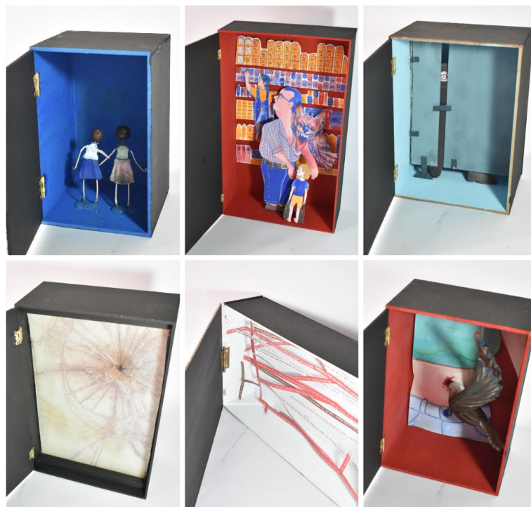
Serie "Cajas de pandora" diorama (técnica mixta), 2021.

Ni siquiera recuerdo cuando empecé a sentir el miedo y la culpa heredada de la religión, como si el pecado original me persiguiera toda la vida aún después de ser bautizada. Tardé mucho en darme cuenta de que lo que nos sucedía a las mujeres no era karma divino sino de que a partir de la educación y el sometimiento, hemos sido juzgadas y que también con el mito se controla a las masas, y así surgen los primeros señalamientos porque fue Eva la que comió del fruto prohibido, fue Pandora la que abrió la caja y fue mi culpa que me acosaran, porque mi cuerpo tal vez sea solo un objeto que no supe cuidar. Es decir, por mi culpa, por mi culpa y por mi gran culpa.