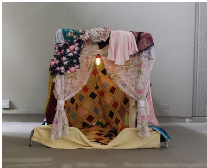
La madriguera, Instalación in situ hecha a partir de piezas textiles, 1.2 x 1 m, 2023.

En este proyecto me pongo a mí misma bajo el foco, me cuestiono quién soy a través de mis cosas, elementos que utilizo como material de construcción de mi “madriguera”, en la que me resguardo, tanto a nivel emocional como físico. En esta pieza el sonido tiene un papel relevante al