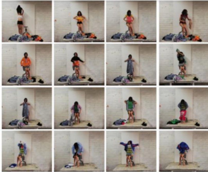
Amalgama , Video-performance, Duración (00:04:33), 2019.