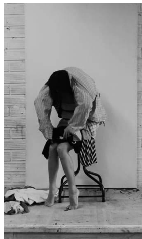
Amalgama , Video-performance, Duración (00:04:33), 2019.

Teniendo en cuenta lo anterior, quise explorar la relación entre la identidad del otro y la mía, por medio de una acción performática que consiste en desprenderme de mi identidad al