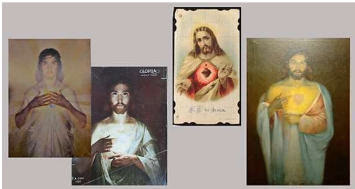
Izquierda: obra de Cano 1930 – Centro: Estampa popular – Derecha: Obra de Chaves 1943

Según Patricia Londoño Vega, autora de la obra "Religión, cultura y sociedad en Colombia. Medellín y Antioquia 1850 - 1930", la Iglesia en Antioquia no fue afectada en gran medida por el anticlericalismo liberal porque gozó de protección especial en el período de Pedro Justo Berrío hasta 1873, y, además, las familias antioqueñas tenían entre sus miembros curas y monjas lo que filtraba cualquier intento de crítica a la Iglesia Católica.