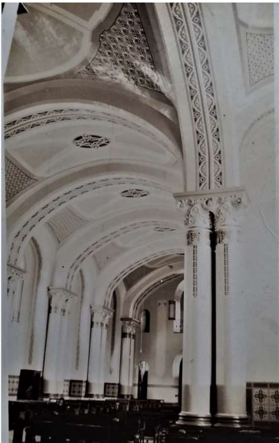
Foto de la decoración original encontrada en los archivos del artista.

deterioro", "son de 1935, cuando le fueron encargadas al maestro, según consta en documentos de la época, fotografías y también, tradición oral".