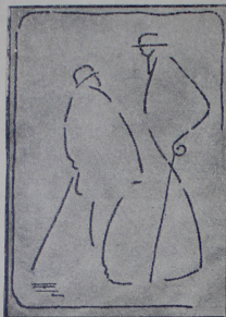
Un mes apenas de separación y el contento de la entrevista les saltaba a los ojos...

Qué saludo mas efusivo el de estos dos camaradas! Un mes apenas de separación y el contento de la entrevista le saltaba a los ojos, a las manos y so-