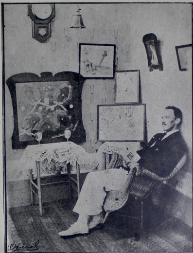
Fot. M. Lalinde

Todavía hay algo que más obliga a más crea profundo entusiasmo por esta cátedra abierta ordenada y científicamente, tal como debe ser, en la Universidad, para estudiantes como para señores de alguna edad en secciones nocturnas, en la Escuela de Minas donde se ha hecho obligatoria en los dos primeros años de curso y para niñas en el Colegio regido por H. H. de La Presentación; hay algo más, decimos, y es la verdadera preparación profesional del señor Herzig, de nacionalidad suiza, que reside en Medellín hace once años y que dejó cursado en escuelas de Europa el estudio de la Cultura Física, mediante lo cual ha obtenido diplomas y valiosos timbres de honor en torneos rigurosos.