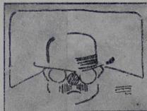
Fíjate en cómo se le va echando tierra a una que otra verdad...