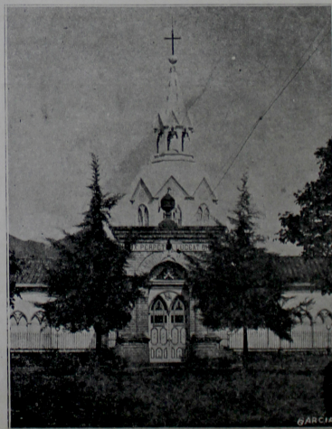
Hermosa fachada del Cementerio de Salamina, al Occidente de la ciudad.

Abraamos el libro. Leámoslo todo, lo antiguo y lo nuevo. Contemplemos el alma de otras edades,