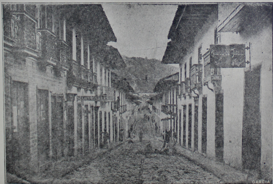
Un aspecto de la calle real de Salamina, vía para Manizales.

«Il est doux de pleurer, il est doux de sourire, dice Alfredo de Musset. Es dulce llorar, es dulce sonreír al recordar males que se podían olvidar». Mas... a qué este preámbulo, cuando yo no he venido a comunicarnos mis pesares, sino a celebrar con vosotros la pascua de este día; a señalar con cintillo de oro esta página de nuestra historia municipal.