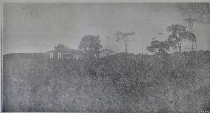
EL CABLE AEREO DE MARIQUITA A MANIZALES

Vista del campo cercano a la Estación del Cable aéreo de Manizales, cuya inauguración se llevó a efecto el 2 del pasado mes de Febrero.