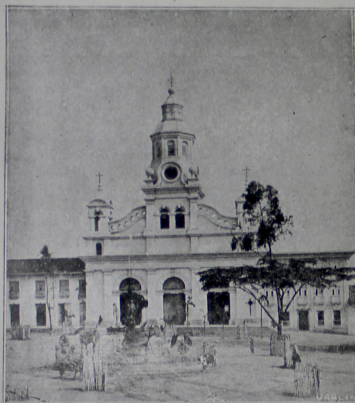
Iglesia principal de Salamina, en la Plaza mayor, costado Norte.

De los anaqueles de esa biblioteca, se esparcirá para todos una dulce aura espiritual; será como fuente cuya agua lustral ha de roborar las caídas del cuer-