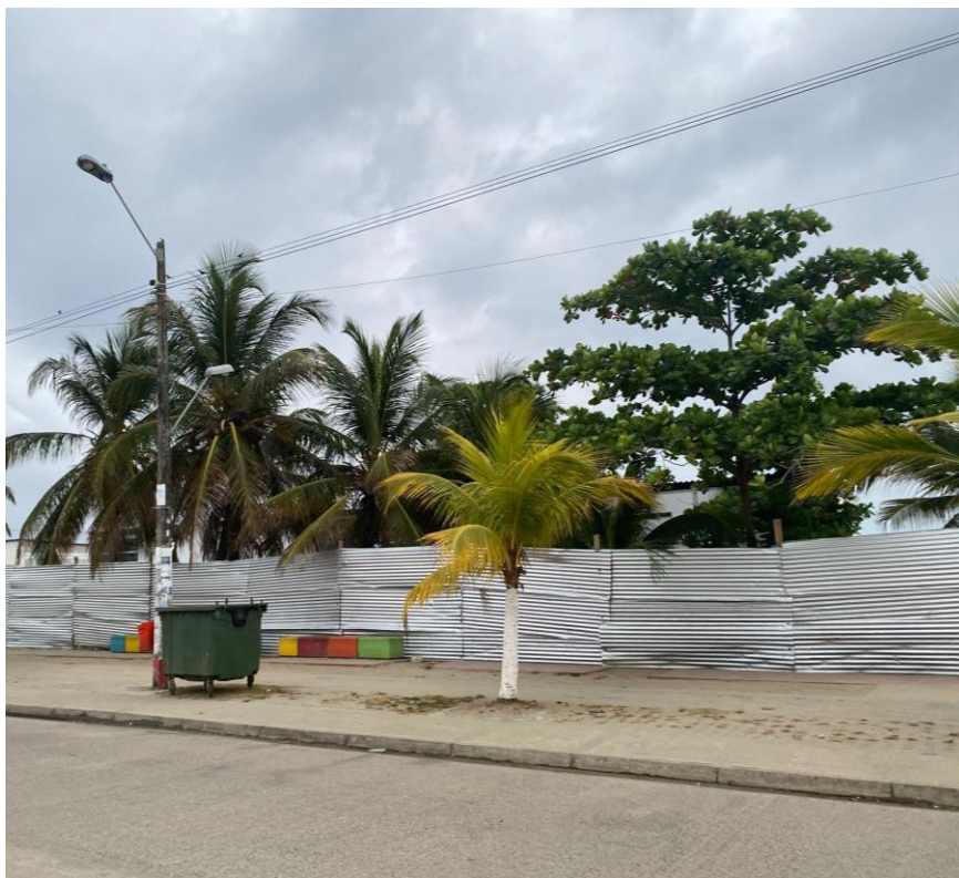
Figura 7 Instalaciones del puerto marítimo cerrado por la Alcaldía Municipal de Necoclí.

sellado sitios como parques y las instalaciones del nuevo puerto marítimo esto a través de jornadas de desalojo.