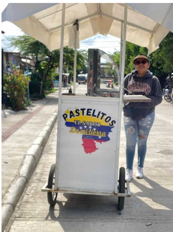
Figura 6 Habitante de Necoclí de origen venezolano.

calzado, discotecas, estaderos, servicios de mantenimiento de electrodomésticos y mano de obra para construcción (albañiles). En general, el crecimiento de la participación de la población migrante en laborales informales ha sido inminente, dado que la necesidad de generar ingresos para continuar el proceso de movilidad inicialmente se ha convertido en una oportunidad para dar inicio a una nueva vida en el municipio.