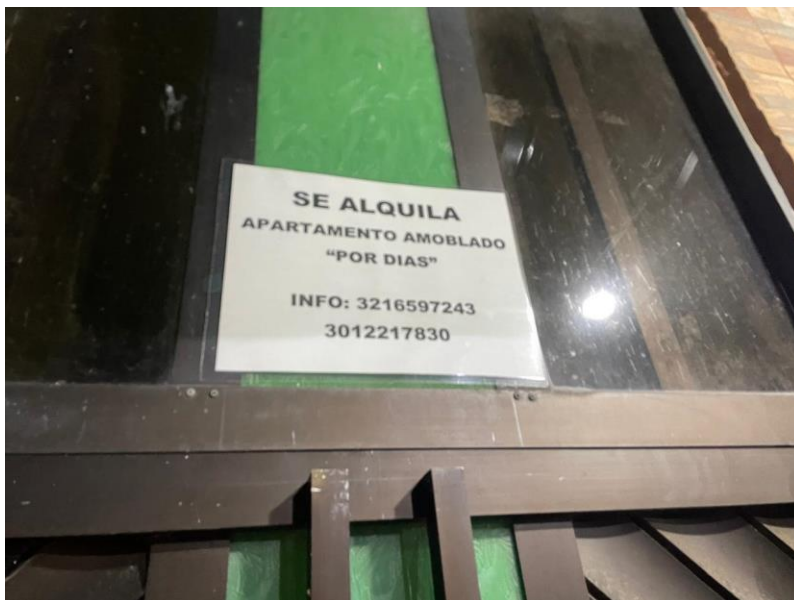
Figura 2 Apartamento ofertado para arrendar por días.

pesos diarios (1.200.00 mensuales) por persona, y en la mayoría de casos este servicio es ofrecido de manera masiva, ya que alojan muchos migrantes.