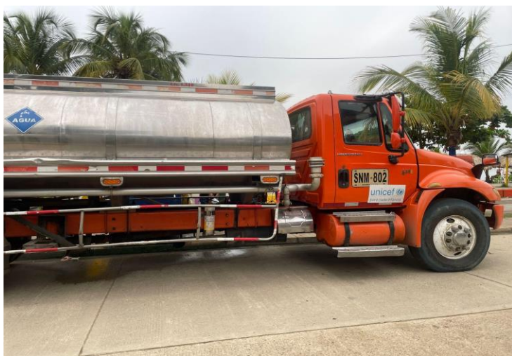
Figura 8 Camión surtiendo agua para migrantes de parte de UNICEF.

Por otro lado, Unicef ha establecido puntos con tanques de agua para que así la población migrante la use para sus necesidades. Así mismo, es importante aludir que Samaritan's Purse tiene un comedor donde se atiende a las personas migrantes de lunes a viernes, aquí se les brinda el desayuno, el almuerzo y la cena; respecto a esto, los migrantes han manifestado que se sienten agradecidos pero los fines de semana son días difíciles para ellos ya que el comedor no abre, así que se les dificulta un poco el hecho de recoger el dinero para comprar los tiquetes de transporte marítimo. Otra organización presente es World Vision, quien se encuentra trabajando en conjunto con UNICEF, Sahed y la Cruz Roja Colombiana en cuanto a brindar atención humanitaria, pero priorizando la reivindicación de los derechos de niños y niñas, entre estas organizaciones se constituyó un espacio donde los infantes interactúan entre ellos por medio de juegos y actividades para fortalecer sus capacidades e identificar riesgos mientras se encuentran en la selva.