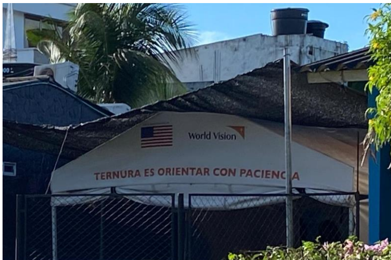
Figura 9 Punto de cuidado de niñas y niños