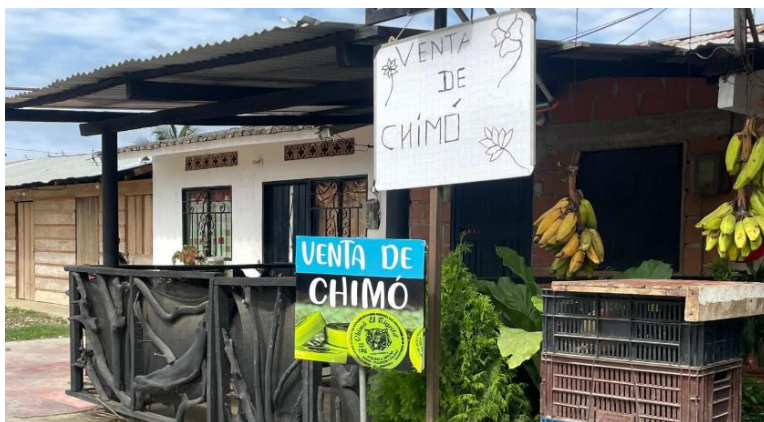
Figura 1 Punto de venta de chimó, producto venezolano

de alimentación, dinámicas laborales, dinámicas de habitacionalidad y dinámicas de relacionamiento, esto se evidencia por la presencia de nuevos elementos alimenticios como la Chicha Venezolana, el Chimó o Chimú (extracto de tabaco energizante con origen en indígenas venezolanos) y frituras de origen venezolano, de igual modo los migrantes son reconocidos por locales por su participación en nuevas dinámicas laborales y económicas desde las ventas informales de alimentos y otros productos de uso cotidiano, y a su vez para los locales la población migrante de origen venezolano es caracterizada por la vulnerabilidad económica en comparación a otras nacionalidades, dado que el 98 % de las personas dedicadas a pedir colaboraciones económicas por fuera de supermercados y otros sectores del municipio son de origen venezolano. Esto demuestra que a pesar de la inseguridad y los problemas de relacionamiento entre necocliseños y población migrante de origen venezolano, los locales perciben las necesidades y vulnerabilidades por la cual pasa esta población.