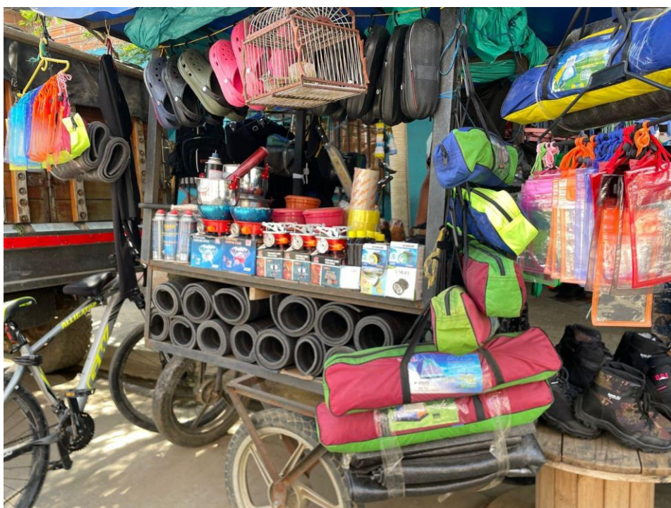
Figura 5 Puestos de ventas de kits de supervivencia

para acampar, linternas, estufas, ollas, recipientes para guardar comida, colchonetas, creolina para evitar contacto con las serpientes (el líquido milagroso), machetes, navajas, y estuches impermeables para celulares. Esta actividad económica ha tenido un crecimiento exponencial dado que al día de hoy existen más de 30 puestos formales e informales dedicados a la venta de este tipo de insumos.