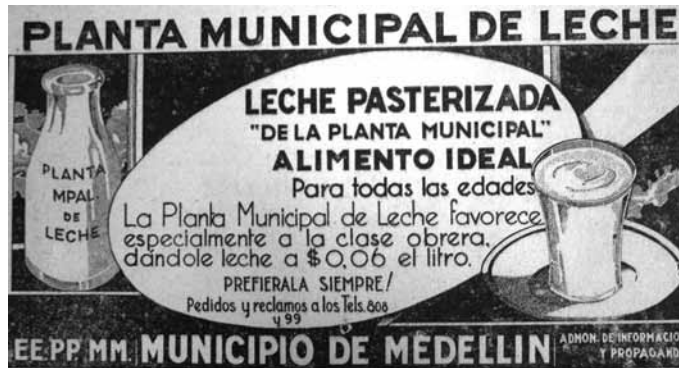
FIGURA N.º 1: PUBLICIDAD DE LA PLANTA MUNICIPAL DE LECHE