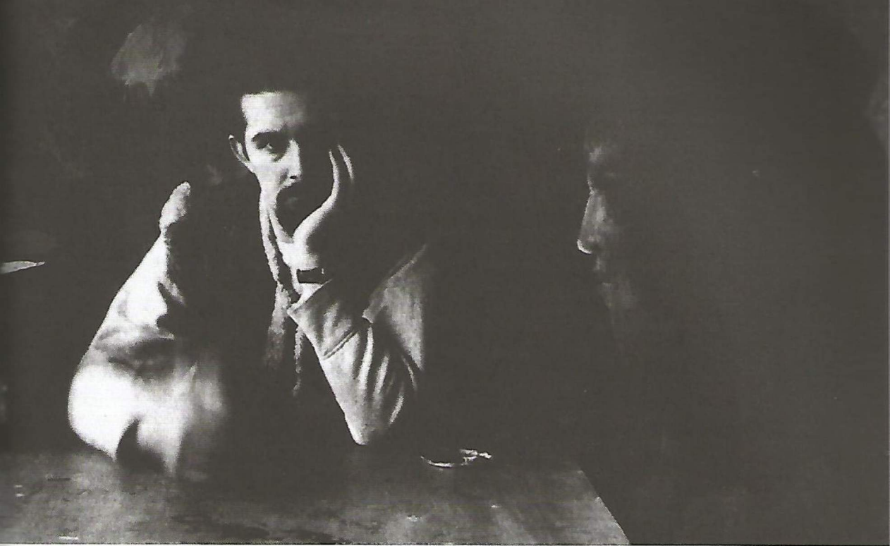
Fernando Botero