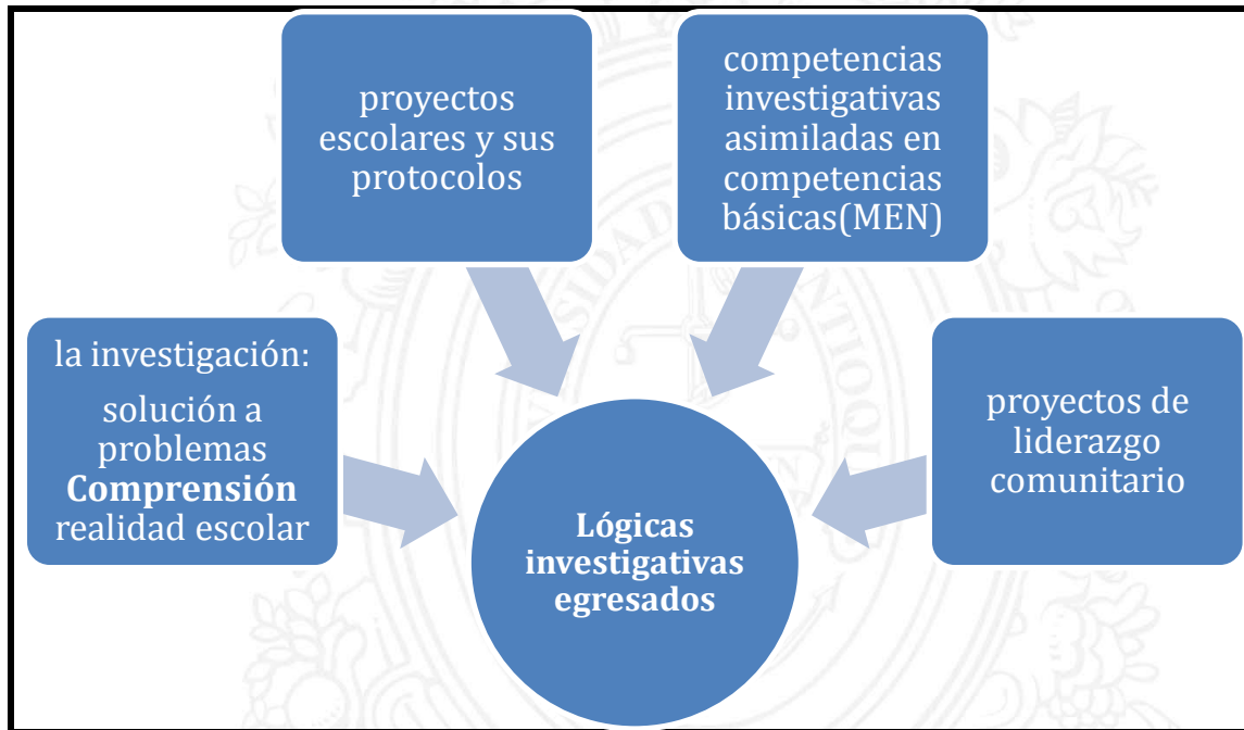
Figura 1. Aportes a las conclusiones del proyecto

ideas que muestran los puntos que sintetizan los aportes a las conclusiones de este proyecto.