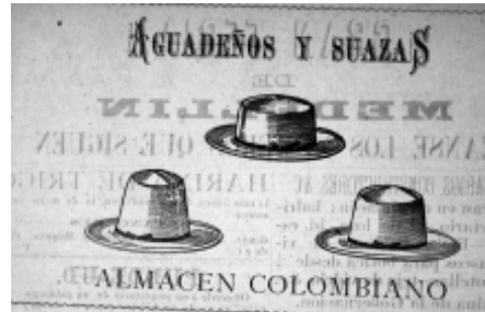
3: Antioquia Industrial 49

cios se insiste en la procedencia colombiana, lo cual da pistas sobre el surgimiento de productos manufacturados en el país a finales del siglo.