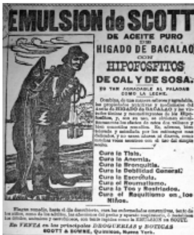
8: El Espectador 14

El muchacho, entre joven y adulto, se inspira en la figura retórica por antonomasia, su imagen representa a todas