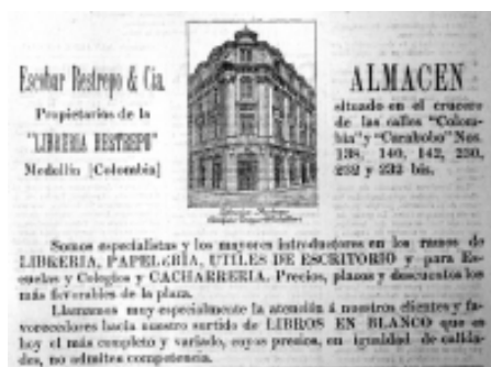
20: Helios 32

Los avisos promocionales de algunos bienes y servicios son menos relevantes para el análisis de la imagen publicitaria, como en el caso de la Librería Restrepo y seguros La Equitativa (Fotografías 20 y 21). Ambas empresas utilizan edificios sólidos, uno más pequeño que el otro, centrados en la parte superior para indicar un perfecto equilibrio y transmitir la idea de solidez y tradición; ésta es una composición sin riesgos, estable y equilibrada. Por lo demás, se advierte que la imagen de la librería corresponde al Edificio Duque que se construyó en esa época en Medellín.