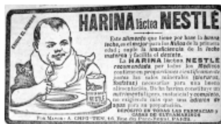
30: Las Novedades 45