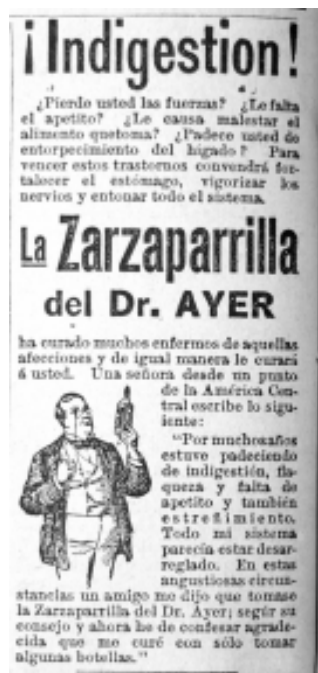
5: El Espectador 9

manifestaciones comunes a un variado espectro de enfermedades, pero luego acude al testimonio de una señora centroamericana que menciona los beneficios del producto y para concluir recomienda emplearlo. En este largo texto se prefiere explotar la función referencial por encima de otras.