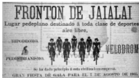
18: El Industrial 28

El aviso del circo (Fotografía 19) recurre a la composición en diagonal, formada por el equilibrista y las escaleras. El retrato en el círculo al lado derecho llama la atención porque significa el respaldo del director al espectáculo y queda la imagen dentro de la imagen.