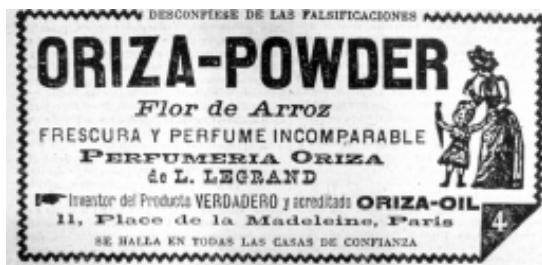
12: Las Novedades 19