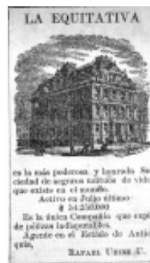
21: El Industrial 33