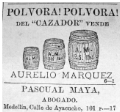
36: La Correspondencia 53

la fabricación de productos de consumo final, tales como cigarrillos, telas, calzado, sombreros y velas para el alumbrado, entre otros; la importancia de su producción devenía en un menor precio para el público, pero fueron más importantes los esfuerzos encaminados a producir herramientas y máquinas necesarias para obtener los bienes.