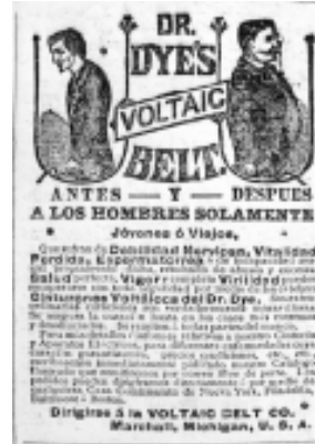
7: La Justicia 11

gen emblemática que acompaña todos los mensajes del producto y permite identificarlo frente a cualesquiera otros de su género; así lo recuerda el texto cuando le advierte al receptor que debe identificar el empaque con su distintivo de marca para no confundirlo. El uso de los caracteres tipográficos produjo una diferenciación reconocible e igualmente se debe tener en cuenta la frecuencia de aparición en la prensa y el uso de distintos medios para reiterar constantemente el producto frente al receptor.