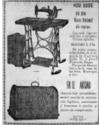
26: El Industrial 40