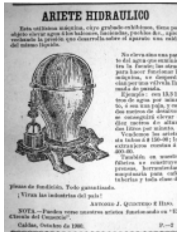
39: La Patria 56

ma con el carácter de mejora in- troducido en la misma máquina; y entiendo que no baste a justificar