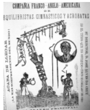
19: Los Tiempos 29