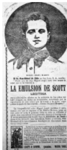
9: Helios 15