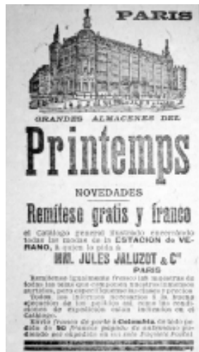
31: La Correspondencia 47

en el periódico El Espectador en 1887, que ofrece artículos y moda de París, ropa hecha, cortes importados, sombreros y artículos de vestuario. Esta sastrería es un ejemplo de la expansión económica que vislumbra la llegada de la manufactura en corto tiempo y en su local reúne a un amplio número de ayudantes: “La Sastrería de Fernández Hermanos cuenta hoy con treinta obreros hábiles, de buena disposición para manejar la tijera y con brío para la puntualidad”. 46