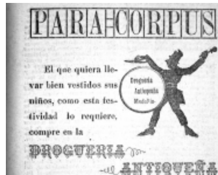
32: Helios 48