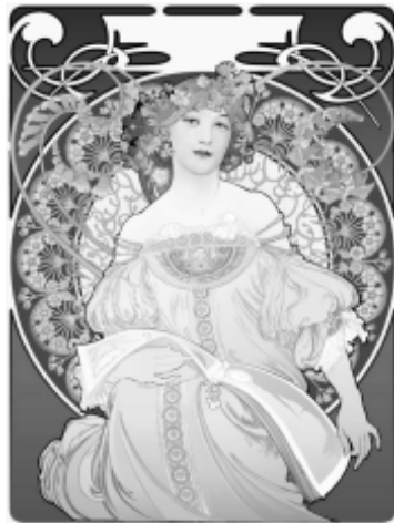
10: Alphonse Mucha 16

Se puede observar que la imagen complementa su presentación con un tipo de letra resaltada por el tamaño y el grueso, el texto netamente referencial enuncia todas las ventajas del producto