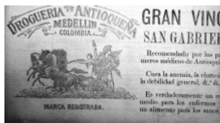
17: El Espectador 25

grafías 15 y 17), cuya concepción de las figuras corresponde a la evocación de la cultura griega o romana mediada por la interpretación del clasicismo. Este elemento trasmite una significación más amplia porque enfatiza en la distinción de un producto amparado por la idea de lo clásico y es la tradición la que lo respalda.