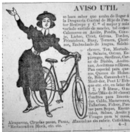
28: El Industrial 42

mienza a sufrir cambios que se deben fundamentalmente al auge de la explotación minera, la consolidación del cultivo del café y