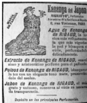
13: La Justicia 20

Los diferentes tipos de letra se usan en todos los ejemplos (Fotografías 14 a la 17), pero cabe resaltar el aviso de la Droguería Antioqueña que aparece en la Fotografía 14, donde el énfasis se halla centrado en seis tipos de letra, pero ade-