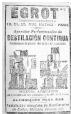
35: Las Novedades 52