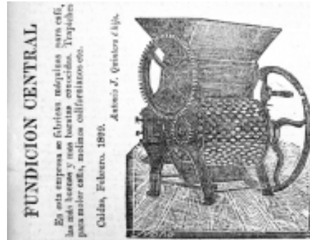
38: Las Novedades 55

lo que creo se hace entre noso- tros con el solo procedimiento de remplazar con nueva marca la mar- ca original que se introdujo. 57