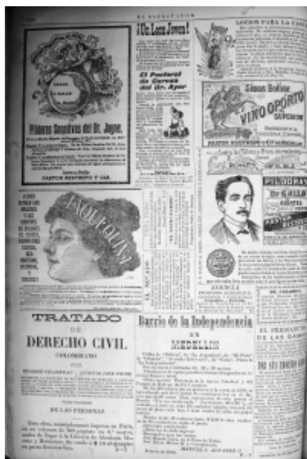
1: El Espectador . 4

trabajo únicamente se incluyen los avisos que aparecieron en la prensa. Para el primer ejercicio se eligió una página del periódico de don Fidel Cano, El Espectador , ya que éste permite hacer un recorrido de más de cien años donde son evidentes los cambios de la imagen y de los productos que se promocionan; la Fotografía 1 muestra una página del periódico publicada en marzo de 1899, al finalizar el siglo XIX, en la cual se mezclan ofertas publicitarias con imagen y texto, y otras de texto únicamente.