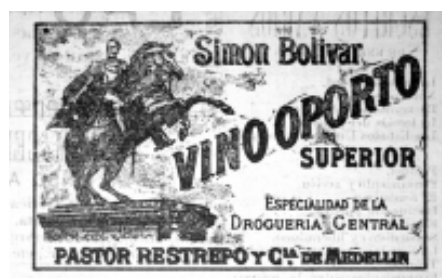
16: El Espectador 23

Otro aspecto que diferencia a esta publicidad de otras es la economía de elementos. No era frecuente usar pocos elementos de texto y en cambio se acostumbraba dar largas explicaciones sobre el producto, con efectos fatigantes para el receptor.