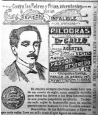
6: El Espectador 10