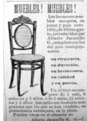
27: La Correspondencia 41