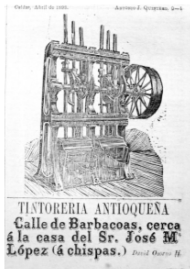
34: Las Novedades 51

Las imágenes referentes a la industria son casi todas de máquinas trilladoras, bombas hidráulicas, un alambique para destilar ron (Fotografía 35), despulpadoras de café y molinos