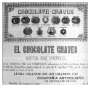
23: Vida Nueva 37

Varias de las imágenes que aparecen (Fotografía 22) son clichés que venían en las cajas de tipos, su uso se acomodaba a la intención del producto y en ese sentido unas manos podían aparecer en diferentes contextos; los clichés incluían desde productos de escritorio hasta elementos agrícolas y algunos cumplían la función de indicar o señalar, las variantes se daban en los tamaños y en la manera de resaltarlos en el aviso. A las otras características se ha aludido antes y responden a la variedad de tipos de letra, la forma compuesta con tipos que se ve en el aviso “Galería universal” (Fotografía 25) es una novedad y también fue tratada en la silueta de Marcelino Vélez que publicó La voz de Antioquia en julio de 1887. Estos recursos muestran que había innovaciones.