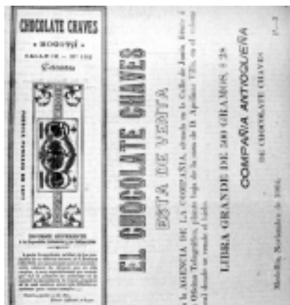
29: Vida Nueva 44

de ambos anuncios, de 1896 y 1904, respectivamente, ellas indican un avance en el tratamiento de la imagen publicitaria en los ocho años transcurridos. La diferencia se aprecia en el paso de los elementos tipográficos y las letras capitulares resaltadas con figuras, a sellos con características de distinción (Fotografía 29); se superan los acertijos iniciales y se pasa a una concentración en las bondades del producto y la procedencia antioqueña de la fabricación. Esta preocupación por mejorar la promoción del producto indica que el chocolate adquirió una creciente importancia en los hábitos alimentarios de la ciudad.