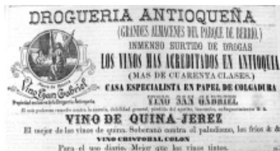
14: Las Novedades 21

más los adornos rodean la imagen y la imagen misma está colocada en un círculo doble que la resguarda del texto, ubicada a la izquierda para lograr un equilibrio visual. Este planteamiento compositivo lo cumple también la imagen de la Fotografía 17.