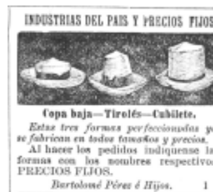
24: La Correspondencia 38