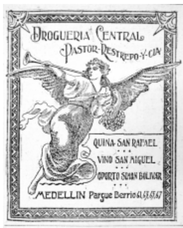
15: Las Novedades 22

En los avisos de la Droguería Central de Pastor Restrepo se destaca el empleo de las guardas, en el ejemplo de la Fotografía 15 las guardas que enmarcan el ángel están elaboradas por un tramado amplio con adornos lanceolados en las esquinas y refuerzan la importancia del sujeto en la iconografía cristiana dominante en el medio. La imagen se resalta por el tipo de composición, donde la figura ocupa la mayor parte del espacio publicitario y está concebida visualmente para usar la diagonal que permite dar una mayor sensación de movimiento; además, las alas del arcángel salidas de las márgenes provocan una sensación de libertad implícita en los efectos del licor.