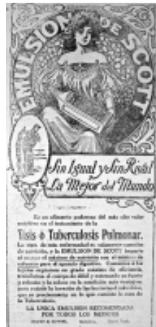
11: Helios 17