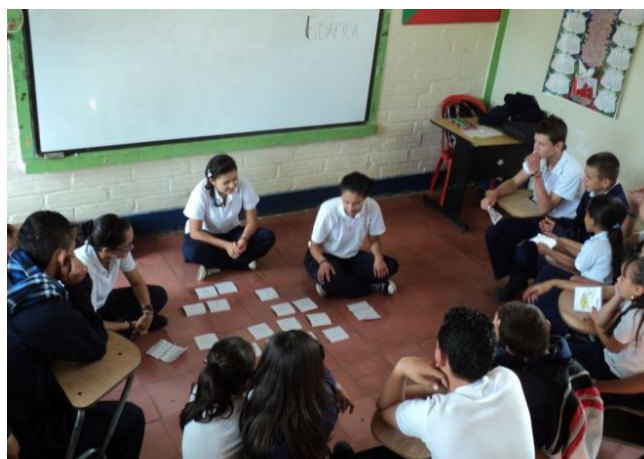
Figura 4. Estudiantes del grado noveno de la I.E.R San Francisco de Asís del municipio de Jericó, Antioquia

Para la ejecución del trabajo de campo se diseñó un programa en tres etapas. La primera de ellas consistió en determinar quiénes y por qué razón harían parte de la muestra participativa ante el