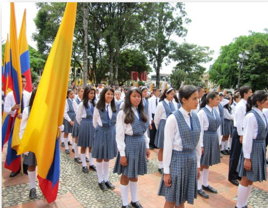
Figura 2. Fotografía tomada en el parque municipal de Jericó, Antioquia, el 20 de julio de 2012, a estudiantes del grado noveno de la I.E.R. San Francisco de Asís con ocasión de la celebración del Día de la Independencia.

La elección de esta fotografía como material informativo se debe a que brinda datos que permiten analizar actualmente la enseñanza de las Ciencias Sociales todavía como instrucción cívica, dado que es todavía una constante en muchos colegios del municipio de Jericó, especialmente la I.E.R. San Francisco de Asís, el