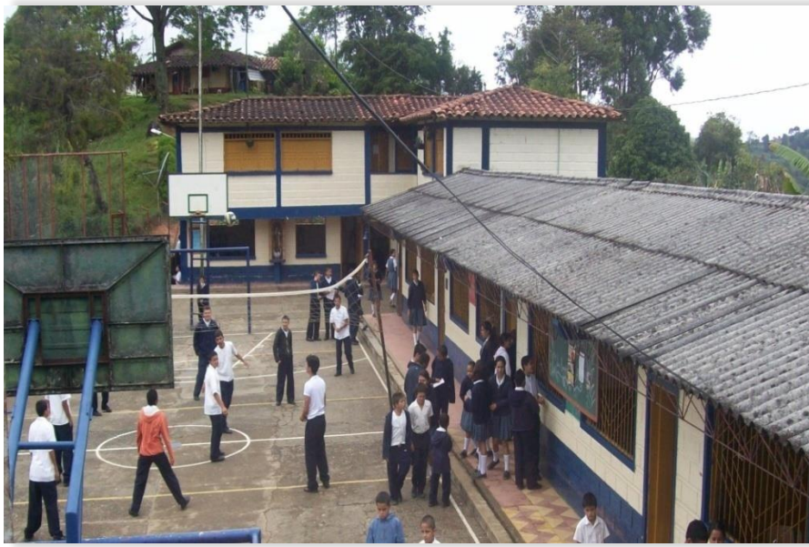
Figura 5. Fotografía correspondiente a la planta física de la I.E.R. San Francisco de Asís del municipio de Jericó, Antioquia; tomada el 15 de mayo de 2013. En ella se aprecia a los estudiantes en el descanso.

Reconocemos que el proyecto democrático escolar es una tarea que ha de implementarse en el tiempo, de ahí que sea preciso cultivarlo desde temprana edad de modo que a futuro se cuente con ciudadanos comprometidos y respetuosos de los asuntos políticos, económicos y sociales.