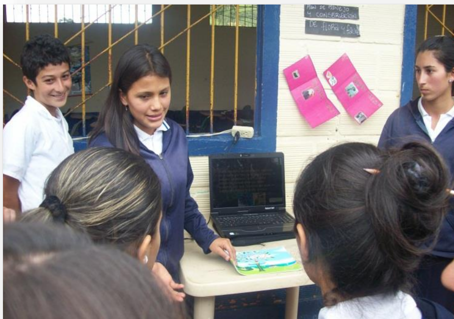
Figura 3. Fotografía tomada en la I.E.R. San Francisco de Asís, el 3 de noviembre de 2012, en el marco de la presentación de proyectos productivos a la comunidad.

respeto a los símbolos patrios, el honor a la bandera, entre otros. Se observa en la fotografía un tipo de educación intencional, puesto que está orientada a un fin preciso que, en este caso, versa sobre el nacionalismo; se da el reconocimiento nacional representado en la bandera. Es de resaltar la postura corporal de los estudiantes, el uso adecuado del uniforme y la presentación personal, aspectos que hablan de una educación que tiende a la unificación y que se inscriben en el método tradicional en el que contenidos, normas y criterios, son afines a todos los miembros de la comunidad educativa; los estudiantes cumplen una función primordialmente receptora.