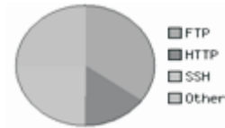
Figura 3: Resultados desplegados por el NTOP con el primer grupo de políticas sin aplicar préstamo

Los resultados de la implementación del primer grupo de políticas sin utilizar préstamo, se pueden observar en la Figura 3.