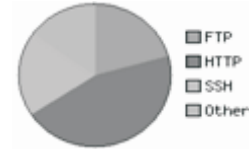
Figura 5: Resultados desplegados por el NTOP con el segundo grupo de políticas sin aplicar préstamo

Los resultados de la implementación de este segundo grupo de políticas sin aplicar préstamo se pueden observar en la Figura 5.