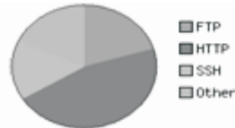
Figura 7: Resultados desplegados por el NTOP con el grupo de políticas para préstamo

Para poder observar si el préstamo funcionaba, se decidió realizar una última prueba con unas políticas configuradas como muestra la Tabla 4 (grupo de políticas 3). Los porcentajes de este grupo de políticas no suman 100%, queda un 15% sobrante, el cual queda libre para ser prestado a alguno de los protocolos o a todos. En la Figura 7 se ven los resultados que se obtuvieron mediante para esta prueba.