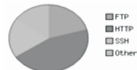
Figura 6: Resultados desplegados por el NTOP con el segundo grupo de políticas aplicando préstamo

Como en el caso anterior, al realizar las pruebas utilizando préstamo, no se observó ninguna diferencia (ver Figura 6), debido a la misma razón que en el caso anterior.