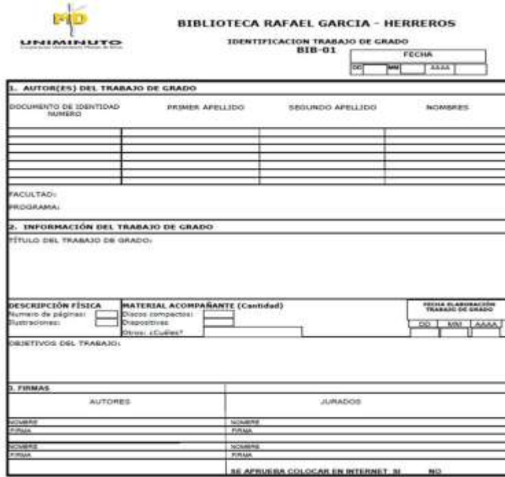
Formato de identificación del trabajo de 1