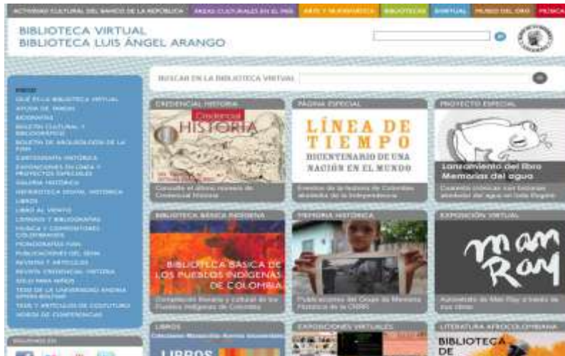
Biblioteca Luis Ángel Arango 1

http://www.banrepcultural.org/blaavirtual/indice