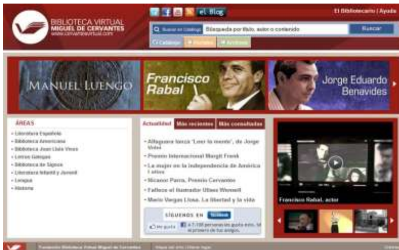
Biblioteca Virtual Miguel de Cervantes 1