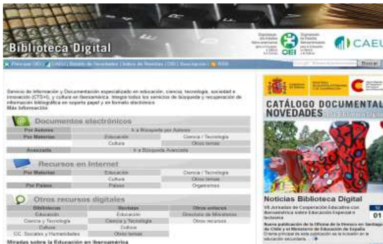
Biblioteca Digital OEI (Organización de 1