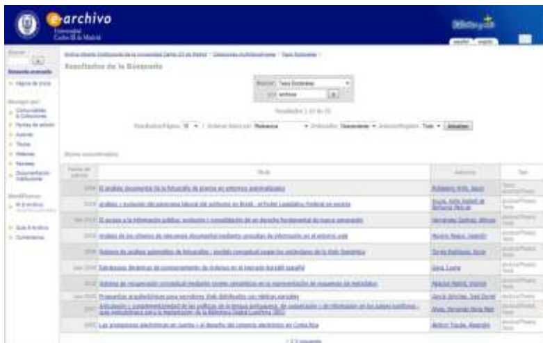
Biblioteca Universidad Carlos III de Mad1

http://e-archivo.uc3m.es/handle/10016/2/simple-search?query=archivos