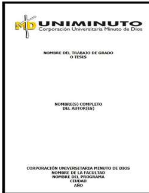
Formato de presentación para el estuche 1