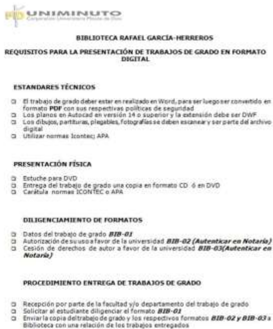
Ilustración 13: Requisito para la presentación de trabajo de grado.

Requisito para la presentación de trabajo