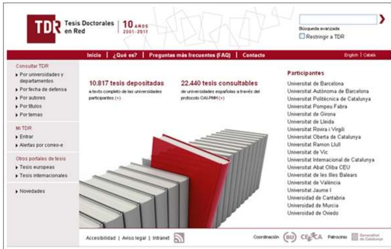
Tesis Doctorales en Red 1