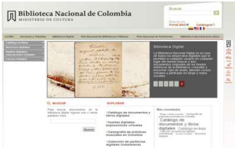
Biblioteca Nacional de Colombia 1