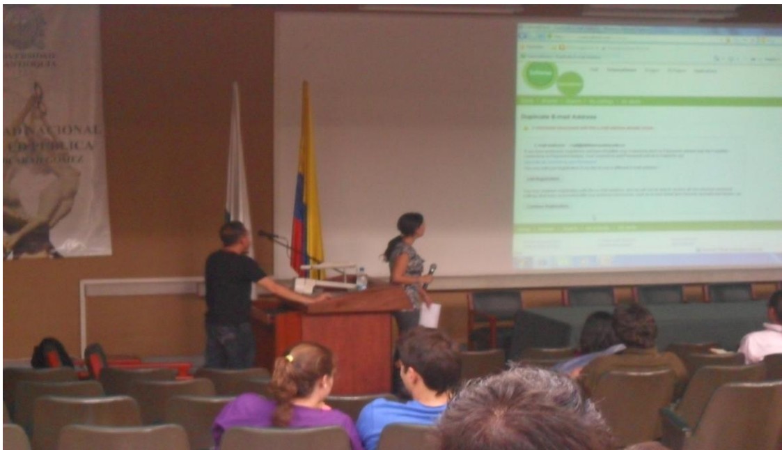
Asistencia a taller dictado por el proveedor de base de datos Elsevier Science