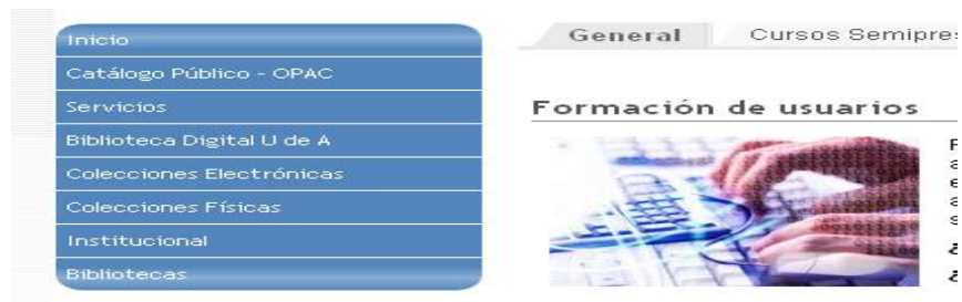
Imagen del Servicio de formación de usuarios

En este sentido el sistema de bibliotecas de la Universidad para la capacitación de sus en el desarrollo de habilidades informativas, les plantea a sus usuarios las siguientes preguntas: