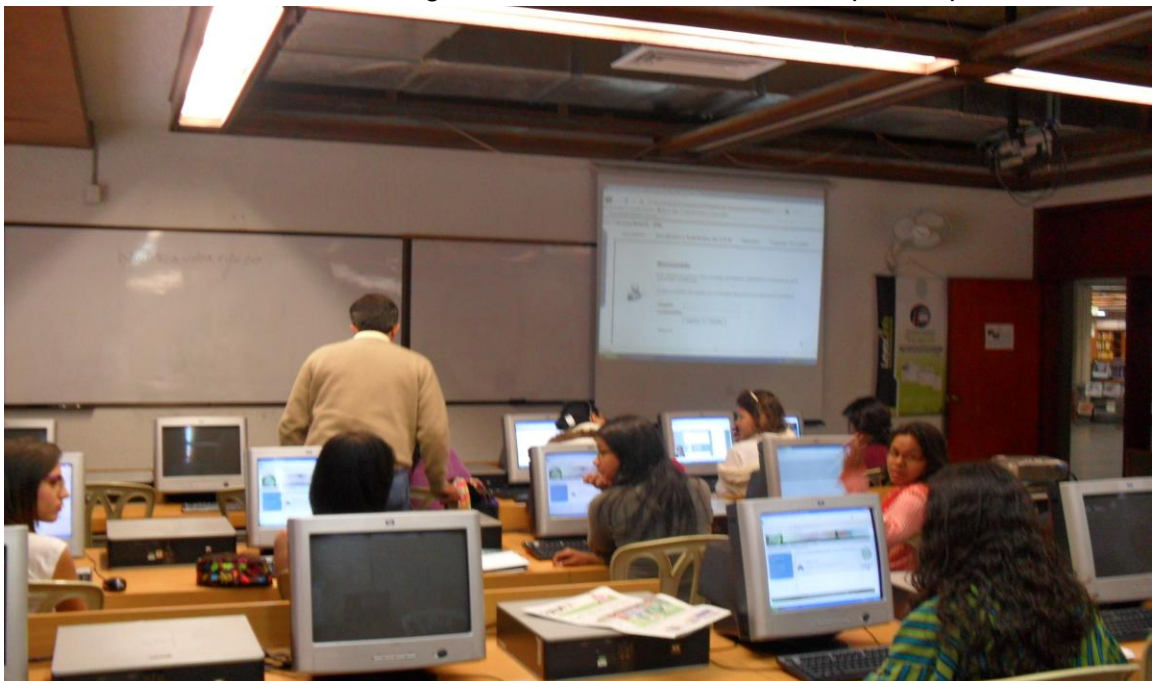
Asistencia a la realización de los cursos del programa de formación