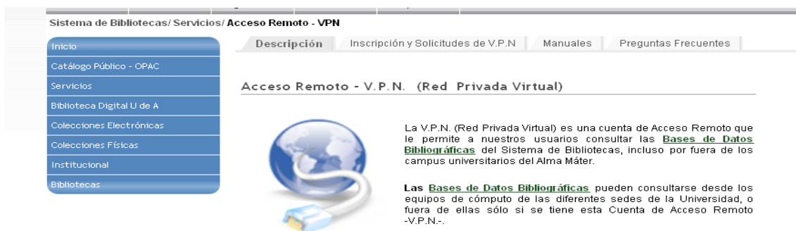
Imagen del servicio de Acceso Remoto VPN

Este servicio es especialmente para la comunidad académica de la Universidad de Antioquia y se requiere previa inscripción. A continuación una muestra del servicio trabajado a través del portal web de la Universidad.