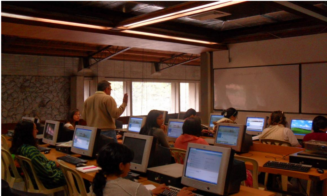
Seguimiento a las actividades realizadas por los usuarios durante la realización de los cursos