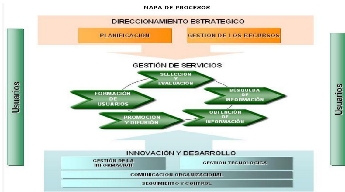
Imagen del Mapa de Procesos del SGC

La anterior información es asimilada a través de la aprehensión diaria del estudio temático de cada uno de las categorías del sistema de gestión de calidad, analizando en ellas los conductos normativos y procedimentales que influirían en el rol propuesto a ejecutar en la práctica académica como integrante del Programa de Formadores de Usuarios del Sistema de Bibliotecas de la Universidad de Antioquia.