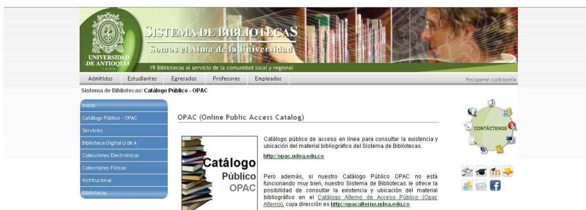
Imagen acceso al OPAC, en el sitio web

Este proceso se inicia con el manejo del Opac que aparece como el primer hipervínculo de la página web de la biblioteca. El manejo de esta herramienta es de vital importancia para los funcionarios de la biblioteca, pues a través de ella se orienta al usuario en la búsqueda de información bibliográfica.