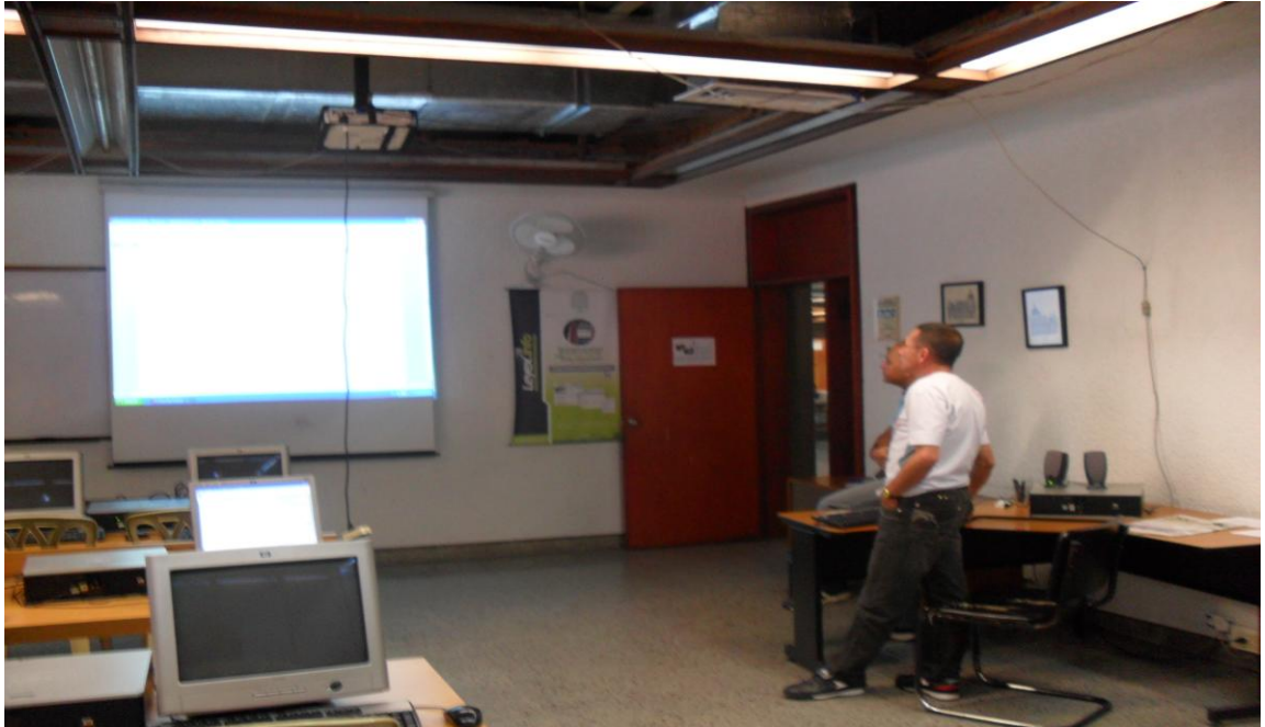
En esta imagen se visualiza la instrucción impartida por los r asesores