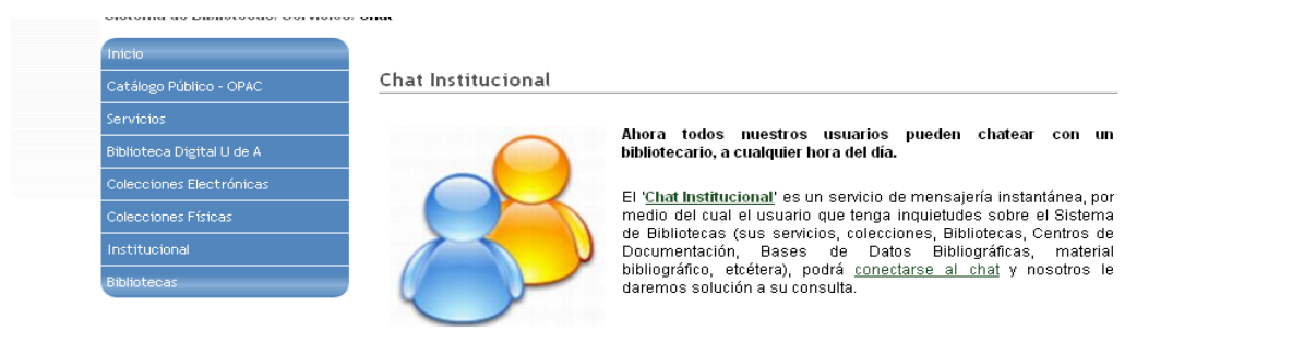
Imagen del Chat en el sitio web

También encontramos el servicio de chat institucional, que según lo trabajado en el desarrollo de esta actividad se conoce como el servicio de mensajería instantánea, por medio del cual el usuario que tenga inquietudes sobre el Sistema de Bibliotecas (sus servicios, colecciones, Bibliotecas, Centros de Documentación, Bases de Datos Bibliográficas, material bibliográfico, etcétera), podrá conectarse al chat obteniendo seguidamente la respuesta a la consulta.