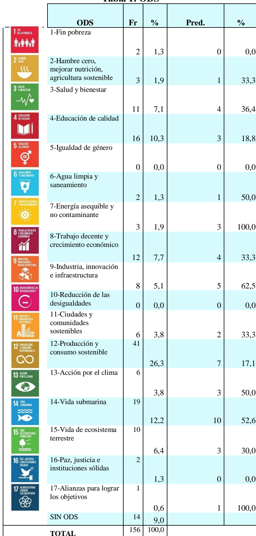
Tabla 1: ODS