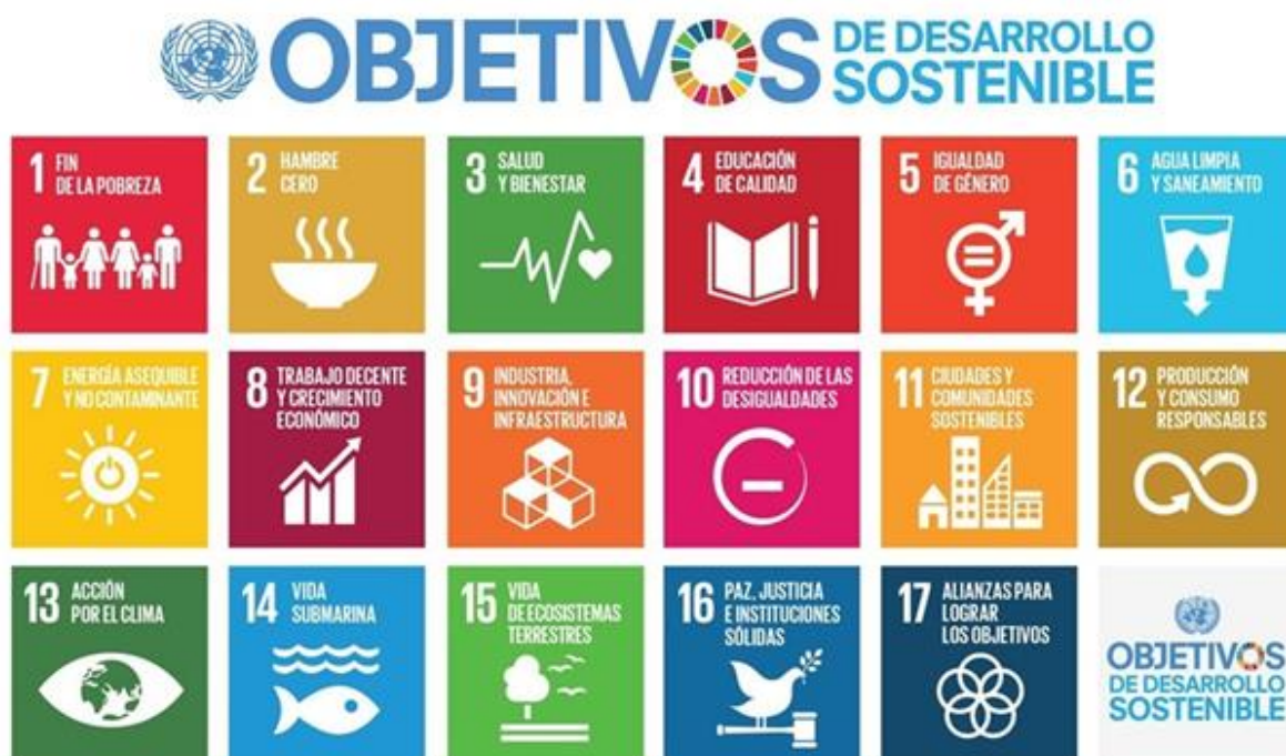
Imagen 1: Objetivos de Desarrollo Sostenible