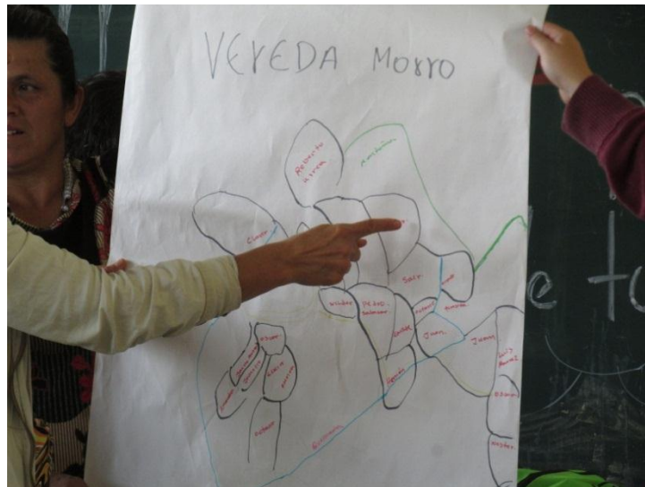
Ilustración 1. Cartografía de la memoria. [Recurso propio]