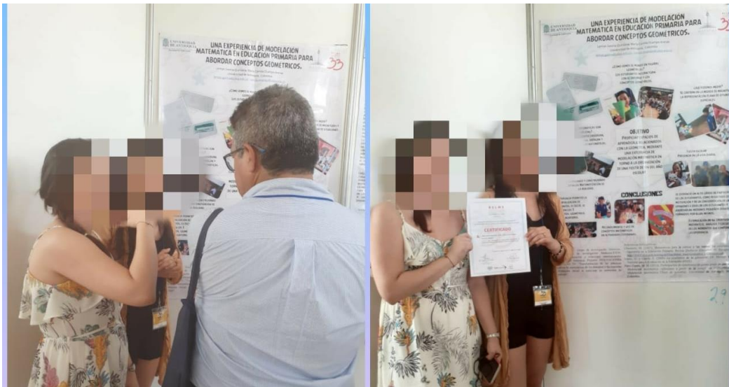
Imagen 1. Ambiente de aprendizaje “La fiesta escolar” presentado en RELME 33.

La fiesta escolar fue un ambiente que tuvo como objetivo propiciar espacios de aprendizaje relacionados con la geometría, mediante una situación de Modelación Matemática en torno a la organización de una fiesta de fin del año escolar. El desarrollo de la experiencia posibilitó abordar temáticas propias de las matemáticas en el nivel escolar y permitió que los estudiantes relacionaran las matemáticas con la cotidianidad, ante lo cual se mostraron interesados y motivados. Dicho ambiente fue presentado en el evento de RELME 33, desarrollado en La Habana, Cuba en la modalidad de poster (Imagen 1).