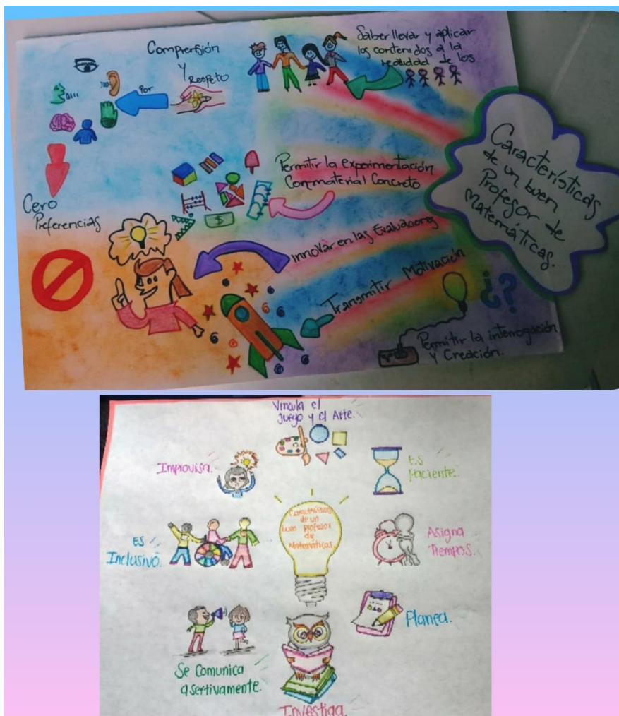
Imagen 4. Lo que caracteriza un profesor de matemáticas según los maestros y las maestras en formación.

Es importante señalar que el alcance del objetivo general se infiere a partir del cumplimiento de objetivos específicos y es, a su vez, el reflejo del grado en el cual se ha dado el cumplimiento de los mismos.