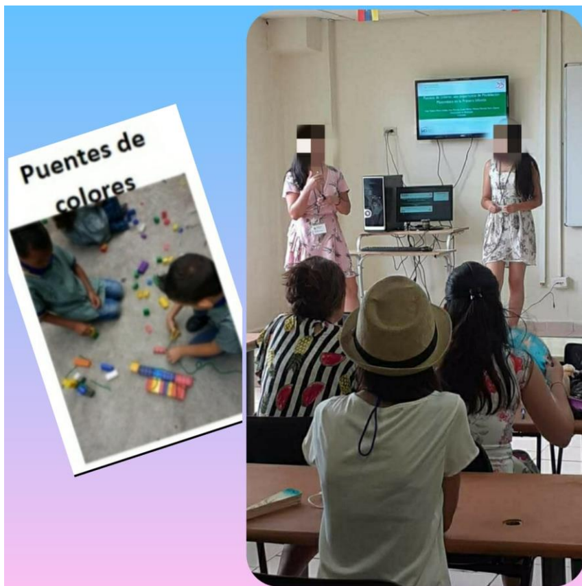
Imagen 3. Ambiente de aprendizaje “Puentes de colores” presentado en RELME 33.

Y, en tercer lugar, a largo plazo el proceso contribuirá a las prácticas de los maestros en formación cuando se encuentren en ejercicio. Lo anterior lo afirmamos ya que, al finalizar el proceso le pedimos a los maestros y las maestras en formación que representaran lo que caracteriza a un profesor de matemáticas y en este ejercicio encontramos expresiones como “investiga”, “vincula el juego con el arte”, “permite la experimentación con material concreto”, “saber llevar y aplicar los contenidos a la realidad [de los niños y las niñas]”, entre otros (ver Imagen 4). Dichas expresiones nos hacen pensar que sus emociones respecto a lo que es enseñar matemáticas se transformaron hacia una experiencia que permite a los estudiantes comprender para qué sirven las matemáticas y a los maestros una posibilidad de escribir y ser crítico y propositivo frente a su práctica.