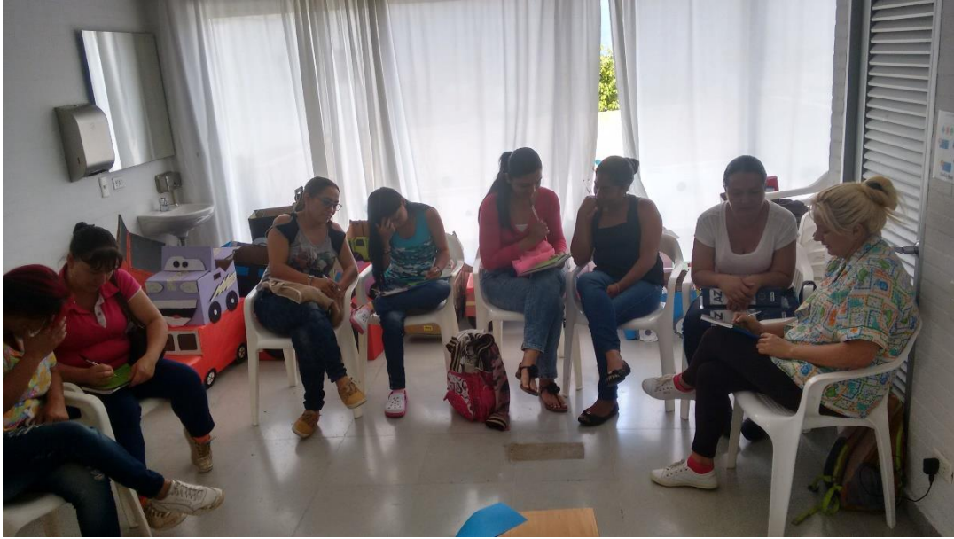
El buen trato