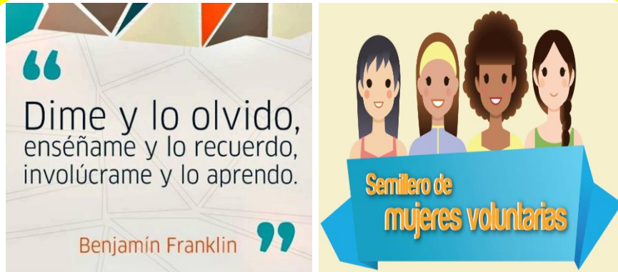
Paletas con esta información