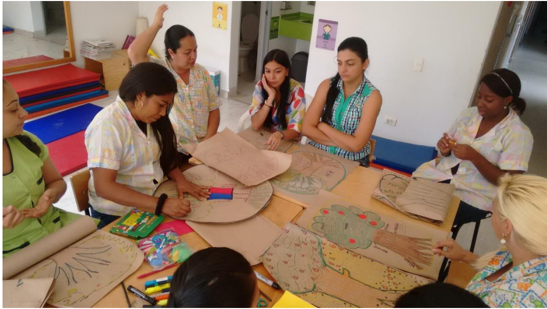
Proyecto de vida