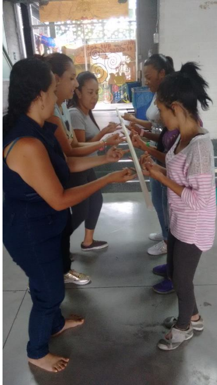
Seguimiento y reconocimiento del rol de voluntaria