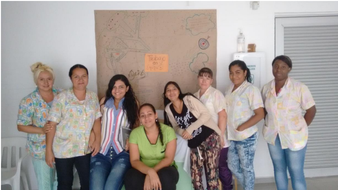
Trabajo en equipo