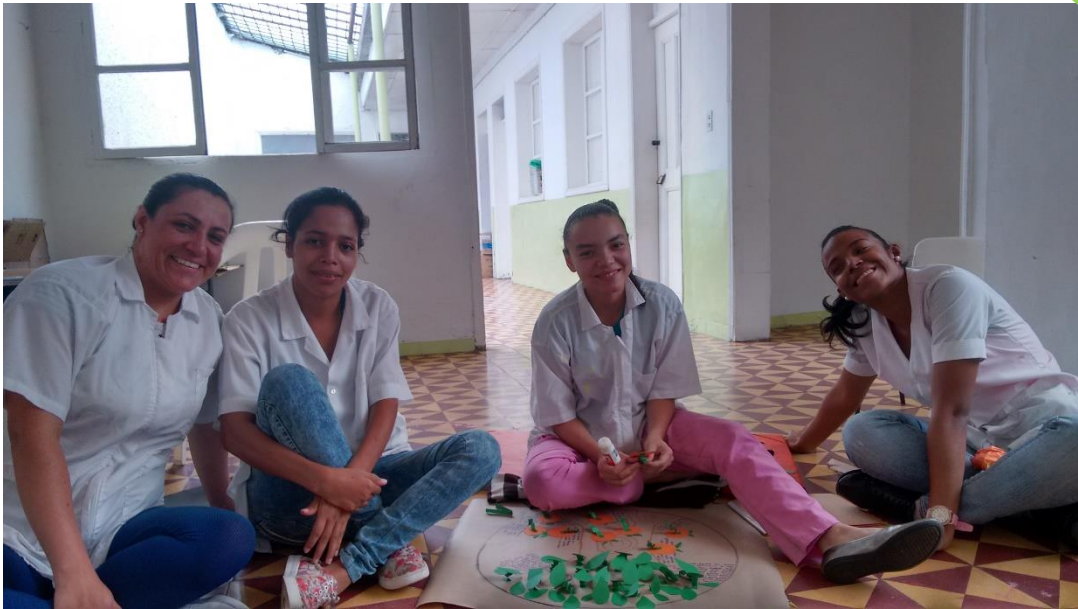
Proyecto de vida