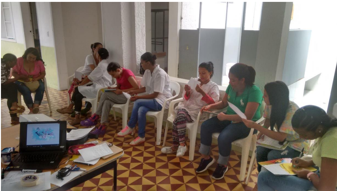
El buen trato