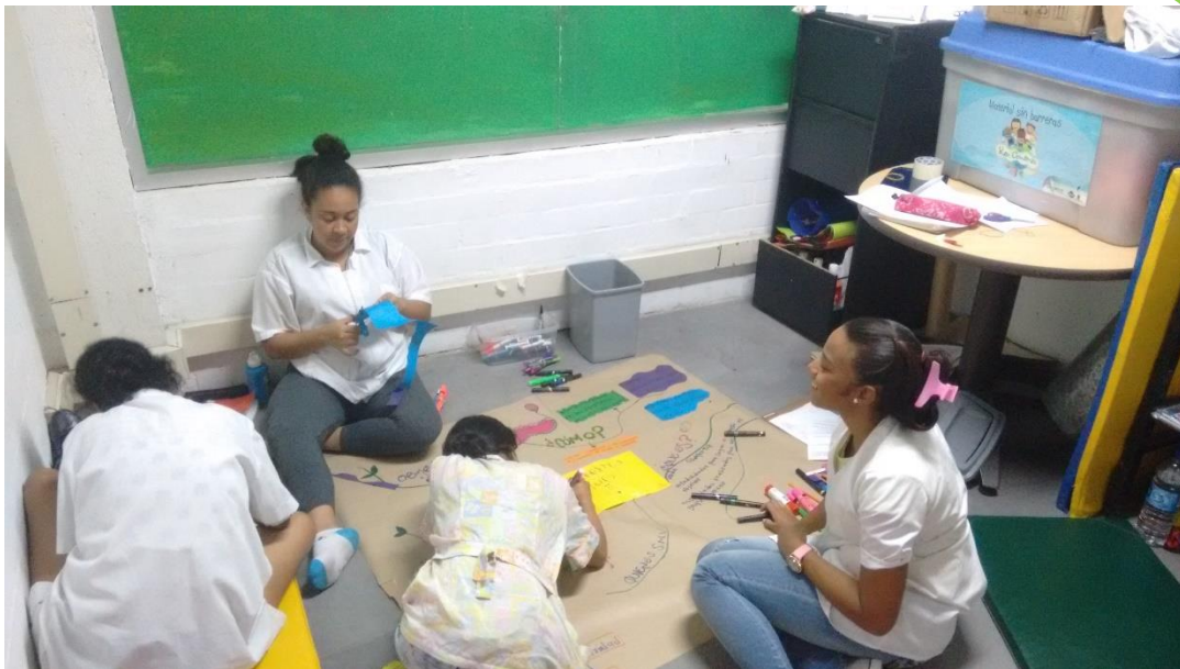
Trabajo en equipo