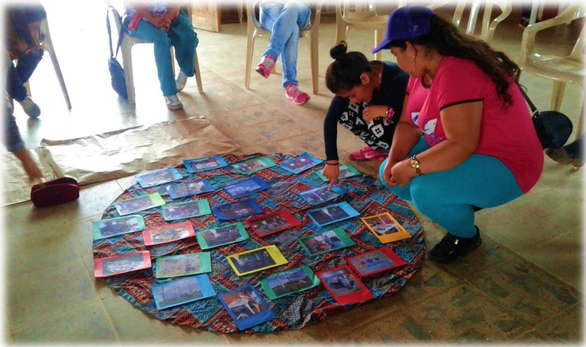
Imagen 6. Alternativas para la transformación de conflictos, 19 de Noviembre de 2017.