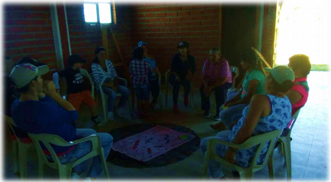
Imagen 3. Escalera de las habilidades sociales, 6 de Agosto de 2017.

La segunda temática del primer módulo fue empatía y grupos de habilidades sociales , que buscaba incentivar el fortalecimiento de las habilidades sociales básicas, avanzadas y de expresión de sentimientos, basándose en un trabajo previo de fomento de la empatía.