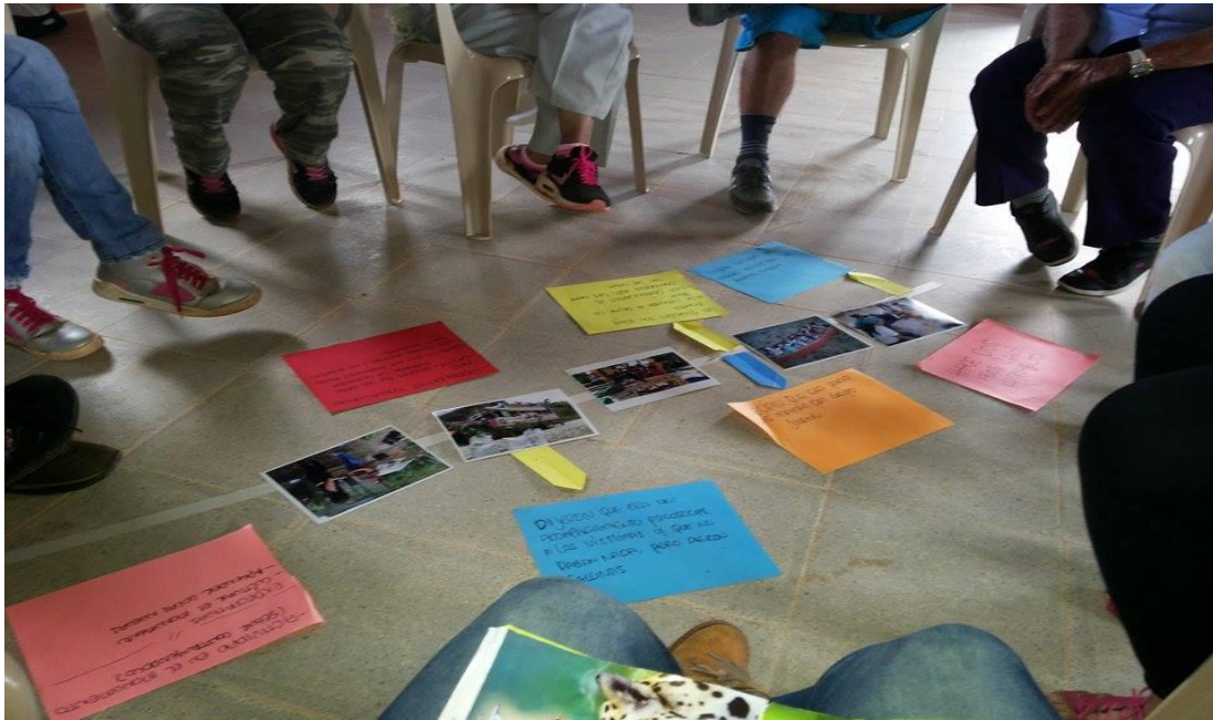
Imagen 1. Empalme: Línea de Tiempo, 5 de Febrero del 2017.

Este primer acercamiento, ligado a una lectura de contexto y a los antecedentes del proceso, permitió identificar problemáticas vecinales debido a distorsiones en la comunicación, pues las participantes manifestaron por medio de sus expresiones y comentarios que les disgustan los chismes, malentendidos y discusiones entre vecinas que terminaban por convertirse en conflictos no resueltos. Si bien, no comunicaban directamente la problemática, se hizo notable al escuchar las expresiones de las participantes y la entonación al momento de realizarlas. Al respecto, la autora María Fuquen (2003) plantea que: