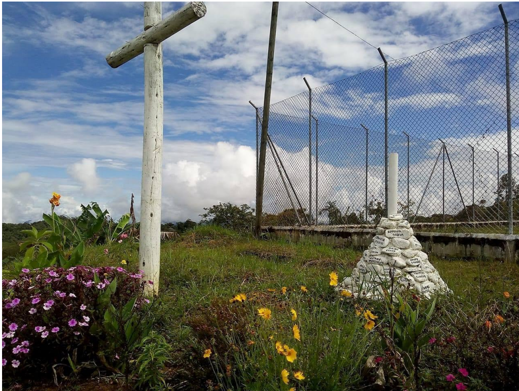
Imagen 7. Monumento a la memoria de la Vereda Cruces, 11 de junio de 2017.

Finalizando, me parece importante recalcar que no solo somos profesionales en formación, somos sujetos inscritos en una realidad social histórica que compartimos con aquellos a quienes pretendemos acompañar desde del ejercicio profesional, ello nos pone preguntas también por los propios intereses y sentidos de vida, que no solo se refieren a la elección de una disciplina profesional específica, sino a la orientación que le damos a ésta, entendiendo que si bien ella es fundamental en la propia experiencia vital no es lo único que la nutre.