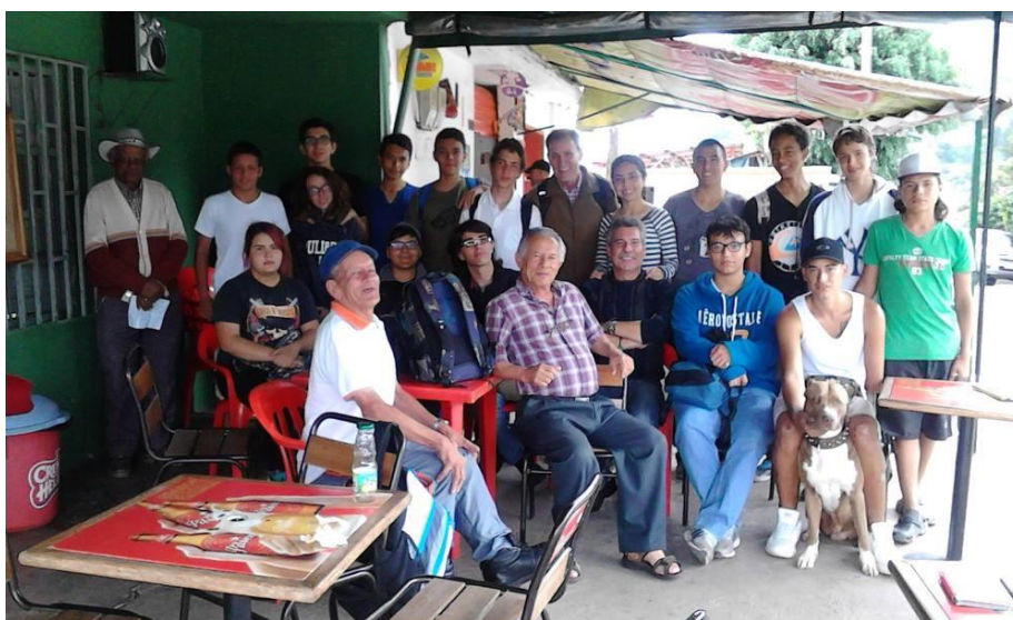
Ilustración 7. Recorrido territorial con estudiantes de la Institución Educativa Eva Escobar y Colegio Soleira.

Los jóvenes que participaron de la práctica, inicialmente identificaron el territorio solo como el lugar donde habitan, nada más, pero en un ejercicio por identificar otros factores se les preguntó que si mañana se mudaran de barrio, entonces su territorio ya sería su nuevo barrio? A lo que ellos contestaron que no, y reconocieron que en su territorio existen, personas, costumbres, lugares y dinámicas que lo diferencian de otro territorio y todos esos aspectos cultivan en ellos sentido de pertenencia con su territorio.