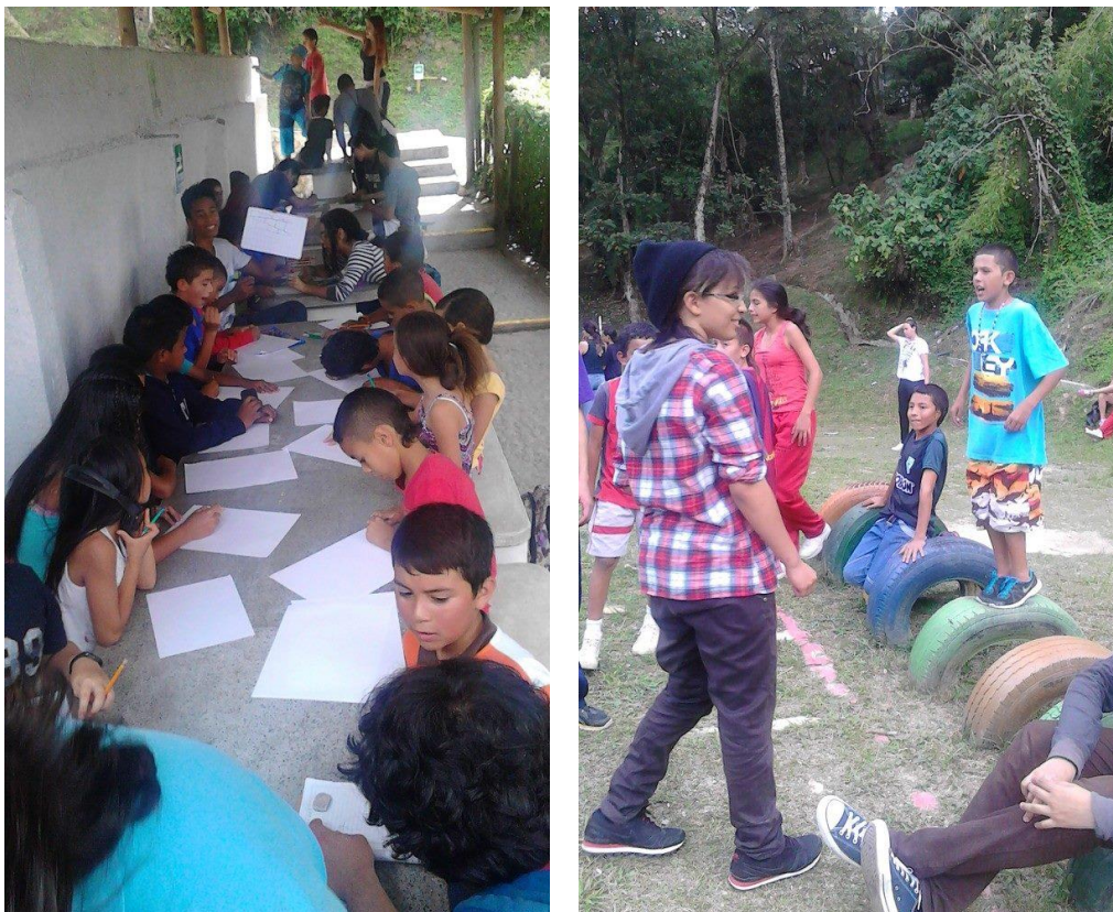
Ilustración 4. Dinámicas de integración con estudiantes de la Institución Educativa Ana Eva Escobar

La otra dinámica de integración se realizó solo con un grupo (10° grado de Ana Eva Escobar) y consistió en presentarse y contar la historia de alguna de las cicatrices que tuviéramos en el cuerpo.