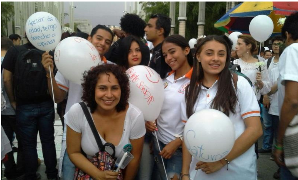
Ilustración 5. Participación en la marcha por la paz de estudiantes de la Institución Educativa José Antonio Galán

Y por último, Flisfisch se refiere a la participación como la posibilidad de intervenir en alguna acción colectiva, donde lo relevante es el grado de organización social desde donde se pudiera ejercer algún tipo de influencia (Flisfisch, 1980).