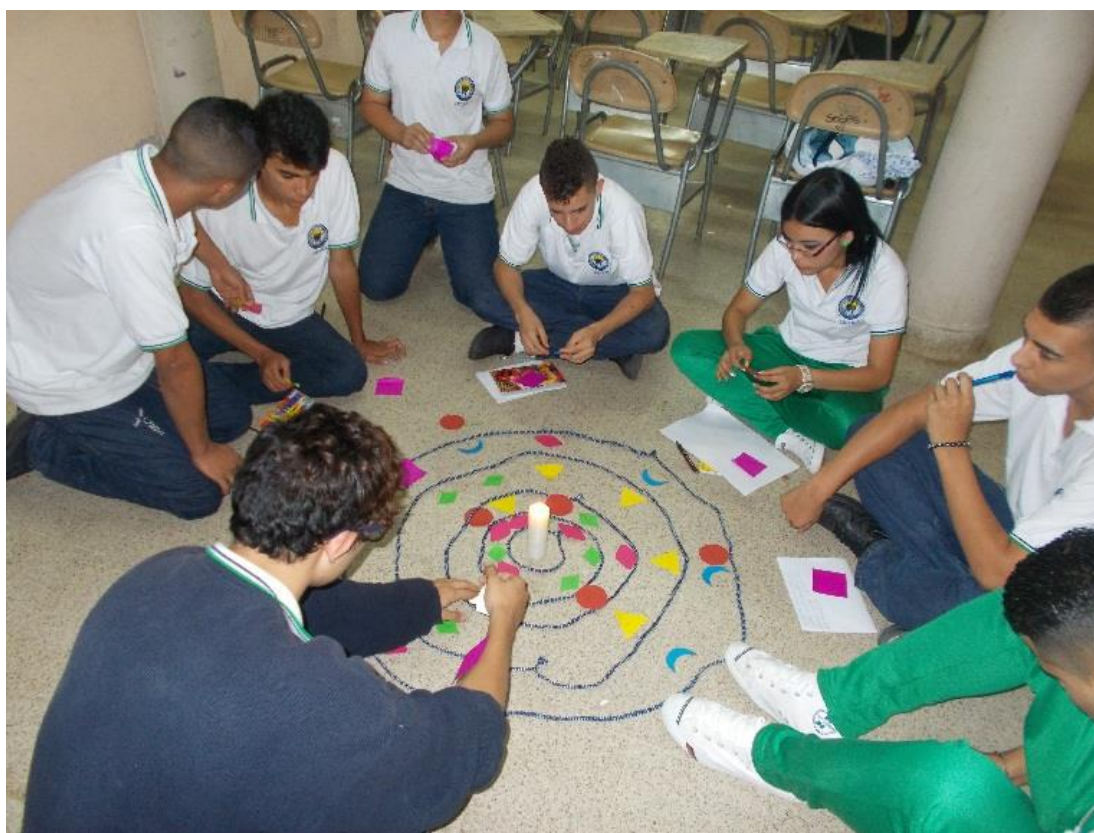
Ilustración 1. Mandala: Diagnostico de los territorios con estudiantes del colegio Concejo Municipal de la Estrella (yo, familia, amigos y comunidad).

La herramienta del Mandala le aportaba a la técnica, la posibilidad de visualizar por medio de éstas figuras el estado de cada ámbito (Yo, mi familia, mis amigos y la comunidad), tanto individual como colectivamente con relación a las emociones y sentimiento ya descritos. Además, en el centro del mandala se colocaba una vela prendida que le daba un sentido más simbólico al ejercicio, pues la luz de la vela representaba a cada uno de los participantes como ser de luz, y milagro de la vida.