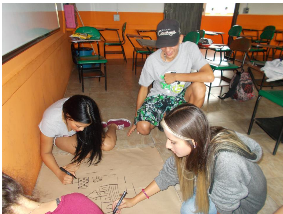
Ilustración 3. Cartografía Social Institución Educativa José Antonio Galán

cultura, la cancha etc. la honestidad y el buen ejemplo lo relacionan mucho con las instituciones religiosas, y los antivalores como la corrupción, varios jóvenes lo asociaron con la policía que hace presencia en el territorio, la discriminación la asociaron con la escuela pero vista como espacio donde se da la discriminación entre sus pares, etc.