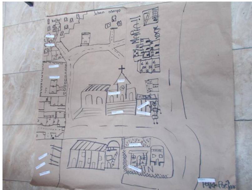
Ilustración 2. Cartografía Social Sector La Tablaza - Municipio La Estrella

“El uso de material cartográfico en el aula permite enriquecer el proceso de aprendizaje al facilitar la incorporación de la espacialidad como categoría de organización del mundo. Por esta vía, se amplía el repertorio de relaciones que se puede establecer a partir de cualquier materia tratada.” (Vega, 2003. Pág. 7).