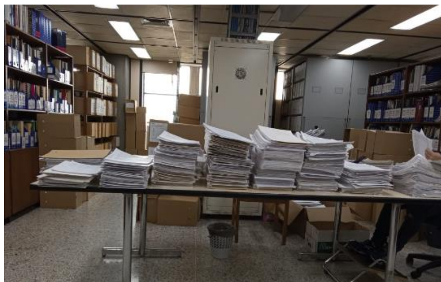
Imagen del Archivo de Gestión de la Gerencia de Catastro, tomada por Carolina Cossio

Cabe resaltar que, debido a la contingencia generada por el COVID 19, en un inicio las prácticas debían ser desarrolladas en su totalidad desde casa; pese a esto se presentaron algunos cambios y permisos que dieron pie a que la Universidad y la Gobernación, acordaran la asistencia presencial al archivo durante dos días de la semana; siendo así, inicialmente se trabajó en la investigación del contexto de la organización por lo cual fue posible identificar la problemática de acumulación documental, lo cual había traído diversas complicaciones a la Dirección de Sistemas de Información y Catastro, tales como la pérdida de información, la dificultad que esto ocasionaba en la consulta de los documentos y la pérdida de espacio en el archivo.