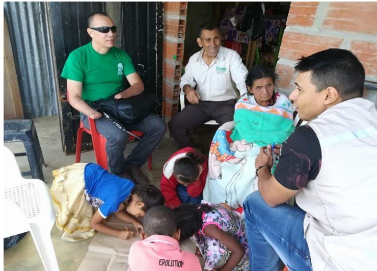
Ilustración 5, Barrio La Avanzada, comuna 1, familia 4.