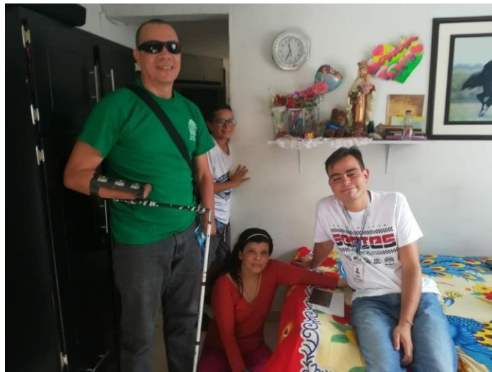
Ilustración 3, Barrio Popular, comuna 1, familia 2.

para una persona con movilidad reducida en el momento de salir de la casa. La persona con discapacidad se nota animada, motivada y es bastante participativa en la actividad; manifestó que se identificaba mucho con la lectura que estaba haciendo porque en días pasados había vivido en una amargura porque no le gustaba expresar sus emociones y sentimientos y que se vestía siempre de negro, cosa que en la actualidad es diferente, porque, ya expresa todo lo que siente y lo que piensa. De esta manera se hace posible notar como el acompañamiento de Biblioteca en Casa por medio de este proyecto va generando cambios en las personas con discapacidad, las cuales manifiestan la gratitud que tienen con el proyecto.