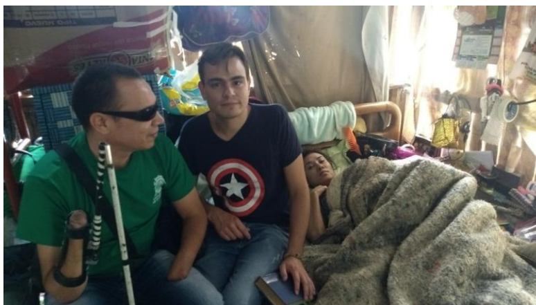
Ilustración 4, Barrio Versalles, comuna 3, familia 3.

Las mismas familias de las personas con discapacidad construyen los procesos con los cuales se pretende mejorar la calidad de vida de las personas, al igual que las barreras accesibles, pues no permiten que haya un buen desarrollo en el acompañamiento y en el trabajo de la institucionalidad, pero, también las personas con discapacidad pueden capacitarse y formarse pero si la accesibilidad para salir de sus viviendas es difícil como de muchas familias de las que he visitado haciendo el acompañamiento en casa en el proceso de prácticas de trabajo social de la universidad, sigo resaltando el trabajo que desarrolla biblioteca en casa con esas familias que tienen personas con discapacidad debido a que lo hacen con entrega con compromiso con ganas con responsabilidad con amor trabajo que de acuerdo también a los programas que he seguido que existen en Medellín enfocados a la habilitación a la realización de personas con discapacidad, es un trabajo de resaltar porque un trabajo domiciliario que llegue hasta las propias familias y partiendo de esas necesidades particulares es muy novedoso, como lo viene desarrollando el parque biblioteca España con el proyecto Ser Capaz en Casa.