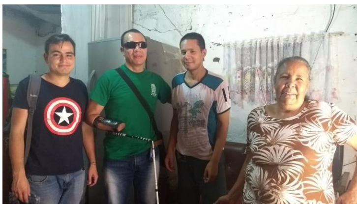
Ilustración 2, Barrio San José la Cima, comuna 3, familia 1.

A modo de memorias. Se presenta el relato de experiencias vividas en las visitas a personas con discapacidad y a sus familias con el objetivo de describir anécdotas, actividades desarrolladas, técnicas utilizadas, aprendizajes significativos y la valoración del proceso logrado con el programa Biblioteca en Casa.