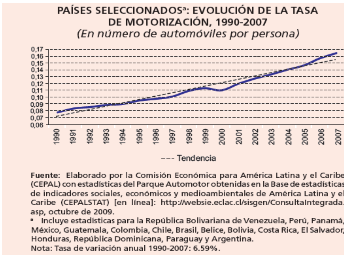
Grafica 1. Evolución de la tasa de motorización