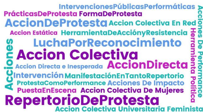
Gráfica 2. El escrache como repertorio de acción colectiva feminista

En los siguientes gráficos se mencionan diferentes concepciones que describen en los artículos revisados al escrache feminista; cada uno se refiere a una categoría encontrada en la fase de análisis de la investigación. Estas connotaciones o sentidos asociados a la palabra escrache, permiten entender el fenómeno desde su emergencia hasta la actualidad en el accionar feminista, son: el escrache como repertorio de acción colectiva feminista, denuncia pública, búsqueda de la justicia, estrategia feminista y catarsis colectiva.