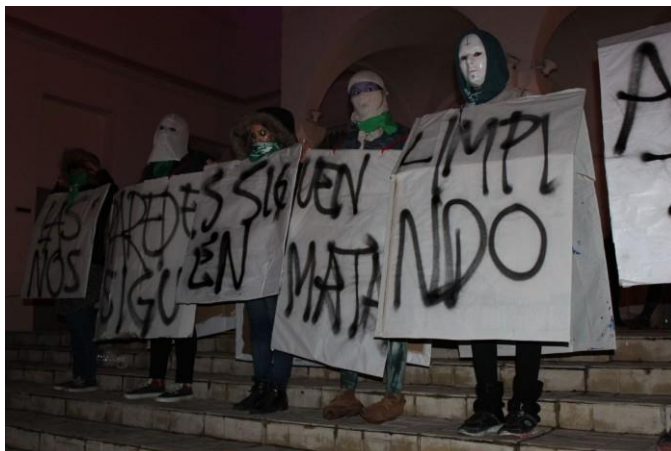
Foto 1. Organización Asamblea 8M Fiske Menuco, Argentina. Mujeres lesbianas, travestis y trans. .

Si bien, ellas buscan el reconocimiento de la violencia contra la mujer e intentan revelar el silencio que ofrece la institucionalidad frente a los feminicidios, no es hasta que los/as espectadores/as interpelan, interpretan o preguntan sobre la acción, cuando este acto del habla surte efecto y adquiere existencia. Así entonces, el testimonio no es reconocido y no vale hasta que realizamos una acción de apropiación del espacio” (Barreto y Flores, 2016, p.211).