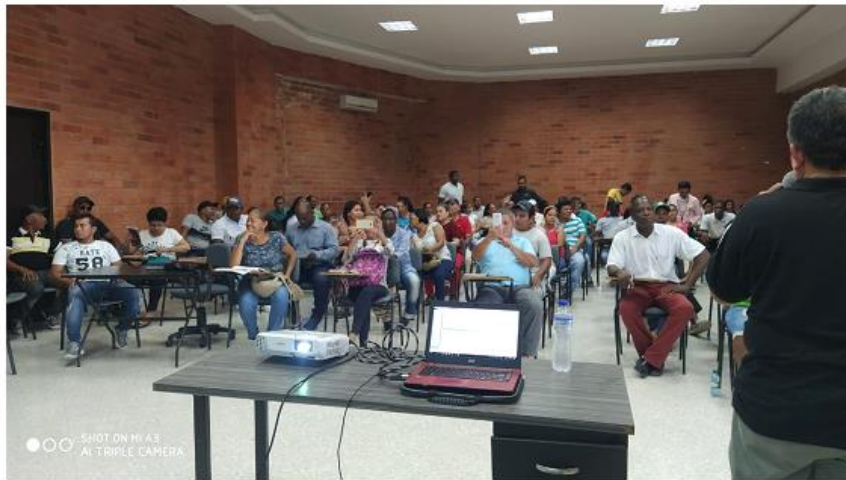
capacitación juntas de acción comunal, 27 de febrero de 2020