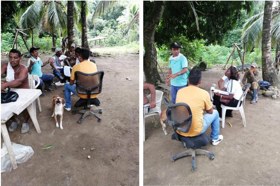
Junta de acción comunal, vereda Los Mandalinos, 01 de agosto de 2019