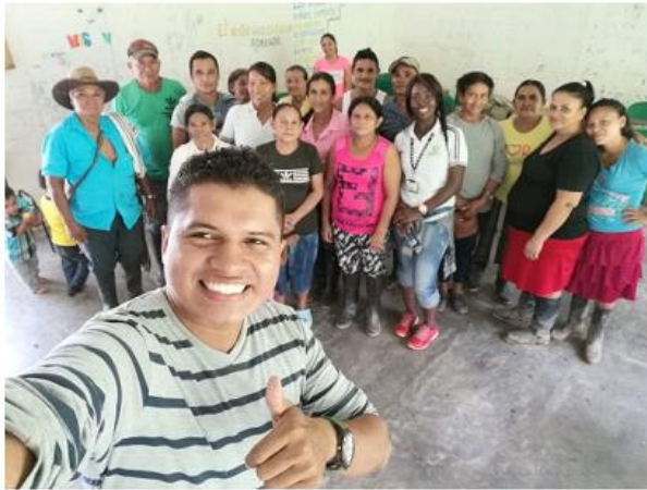
fuelle: galería personal. Junta de acción comunal vereda Buenos Aires