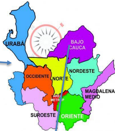
Imagen 5.