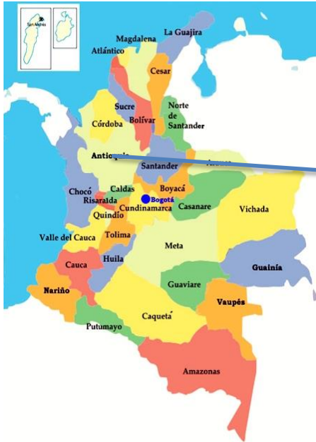
Imagen 4.