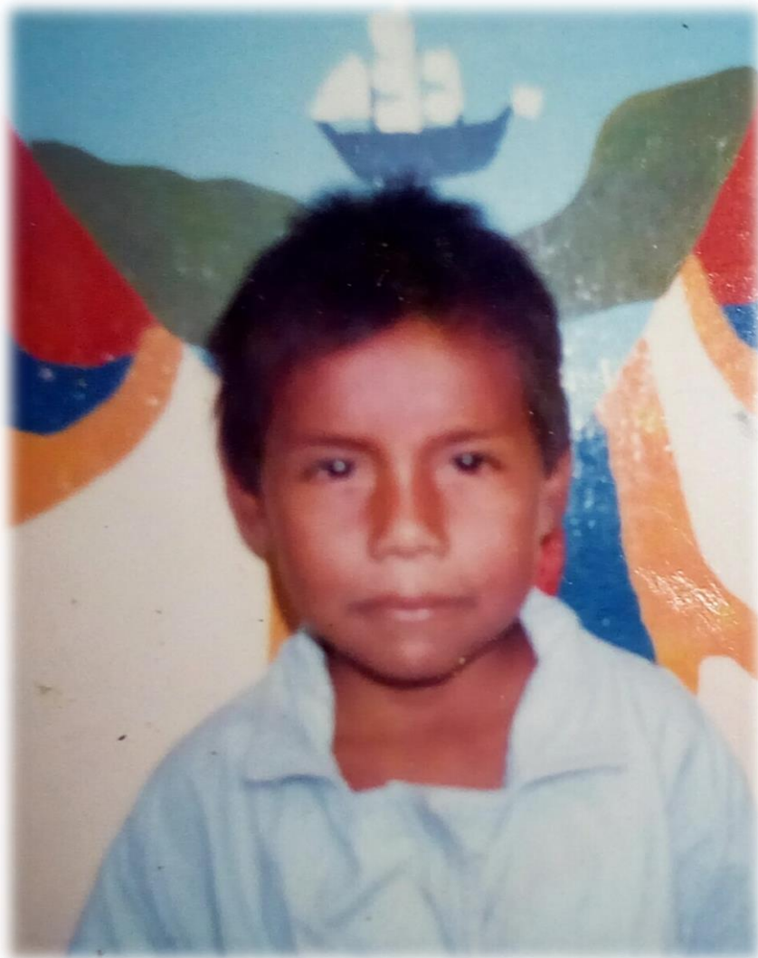
Imagen 3. Tomada en la primera semana de haber empezado a estudiar. (1997)