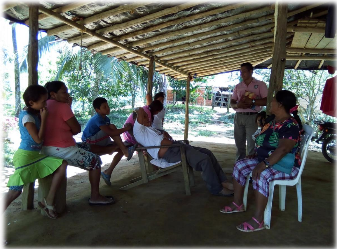
Imagen 15. Espacio de compartir (Duvan Nisperuza 2018)

hablar, contar sus experiencias de vida y de lo que hacían a diario. Espacio que a la llegada de la energía a mediados del año dos mil nueve se fue debilitando hasta casi desaparecer pues hoy la gente se entretiene en el televisor, el celular y con ello en las redes sociales, Facebook, entre otras. Lo que a modo personal seguiré luchando por darle vida y sentido a estos espacios de sabiduría.