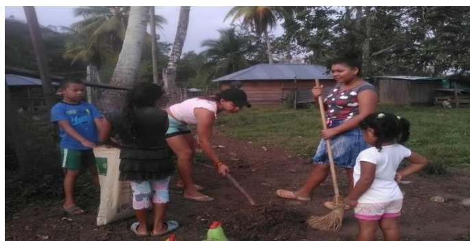
Recolectando abono natural