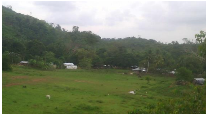
Foto 1. Panorámica general del Resguardo. 2018.