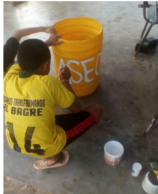
Pintando las canecas para las basuras