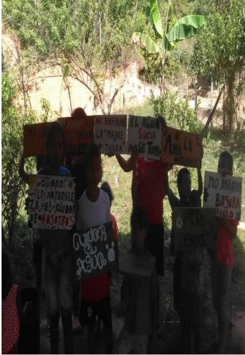
Mostrando el arte para conservar la Madre Tierra