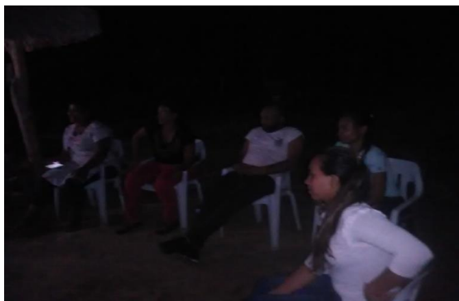
Escuchando a los mayores en San Andrés de Sotavento