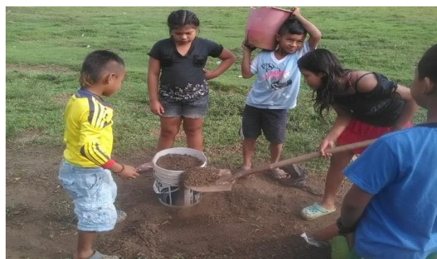
Recolectando abono natural