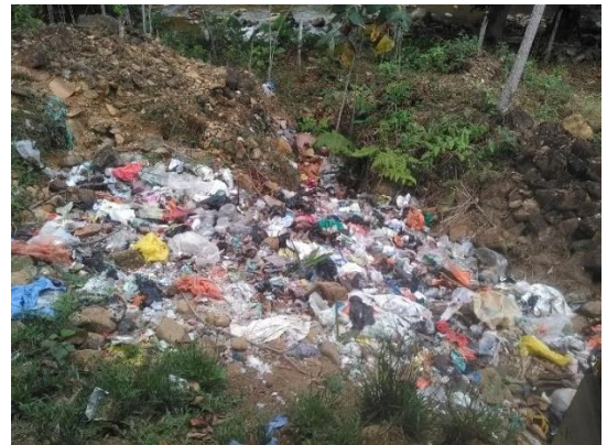
Relleno sanitario del Resguardo