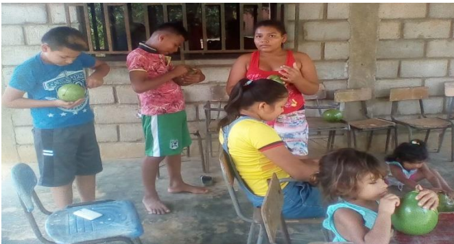
Realizando vasijas con totumas