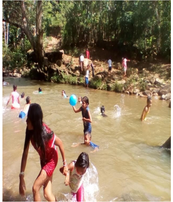
Conectándonos con nuestra hermosa agua