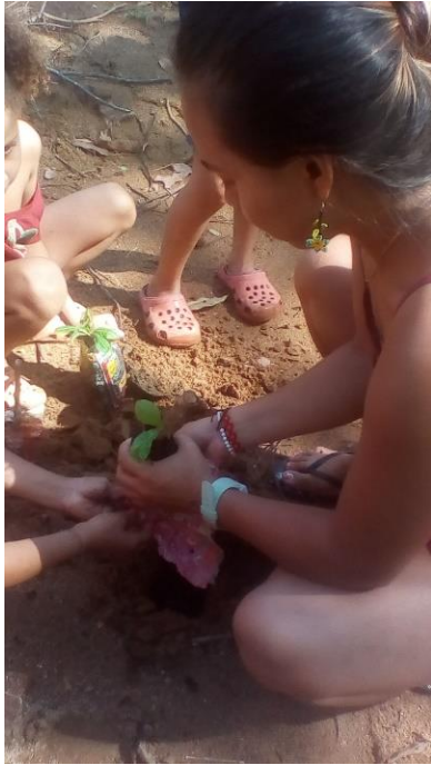
Plantando árbol de totumas