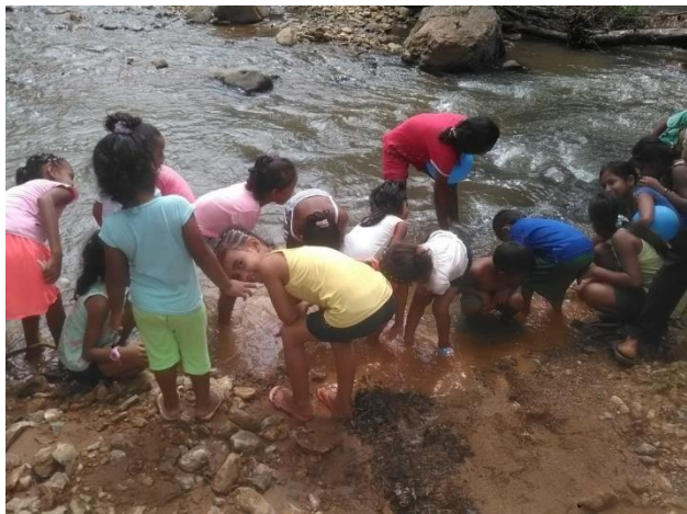
Saludando la quebrada