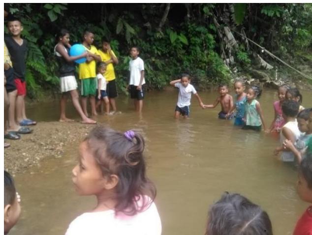
Conexión con el agua