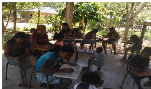
Realizando avisos sobre el cuidado de la Madre Tierra