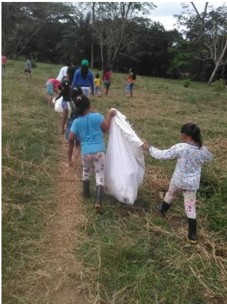
Salida de campo.