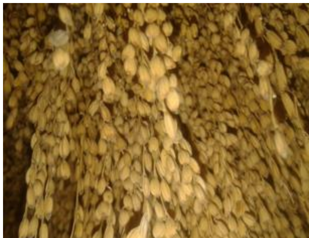
Ilustración 16. Arroz Orgullito-Contra la Plaga

El orgullito contra la plaga, sus características y proceso de siembra todo es igual al orgullito, lo único que los diferencia es el olor que se genera cuando este cosido, cuando se destapa el caldero sale un olor natural propio de esta variedad que puede llegar hasta 100m de distancia, cuando alguien llega a casa es muy fácil de reconocerlo que se está cocinando este arroz y lo puede distinguir por el olor penetrante.