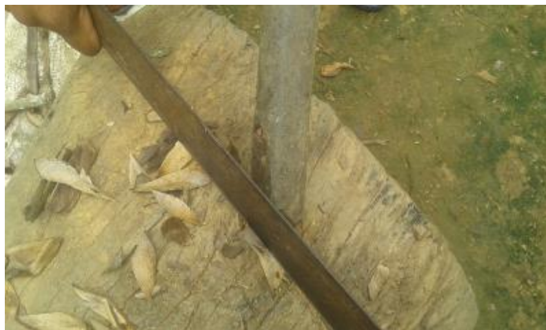
Ilustración 26. Abuelo Alista su Espeque para la Siembra

debe tener a la mano un espeque y la cuartilla que son las herramientas que se utilizan para realizar la siembra, nuestros abuelos han adquirido prácticas para esta actividad ya que el espeque se le elabora la punta con una forma y longitud de acuerdo al arroz que se va a sembrar.