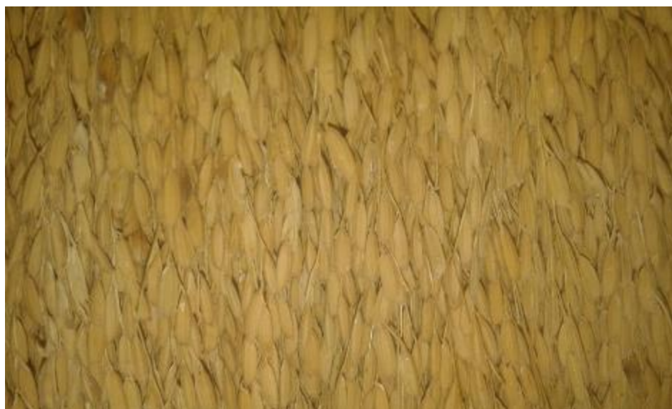
Ilustración 22. Arroz blanquillo

Se caracteriza por ser un arroz de grano fileño de color blanco y punta delgada, el gajo crece más de una cuarta, la mata puede crecer hasta dos metros de altura, sus hojas son de color verde, su guaña es delgada. Esta variedad de arroz es blandita para desgranar y pilar, al momento