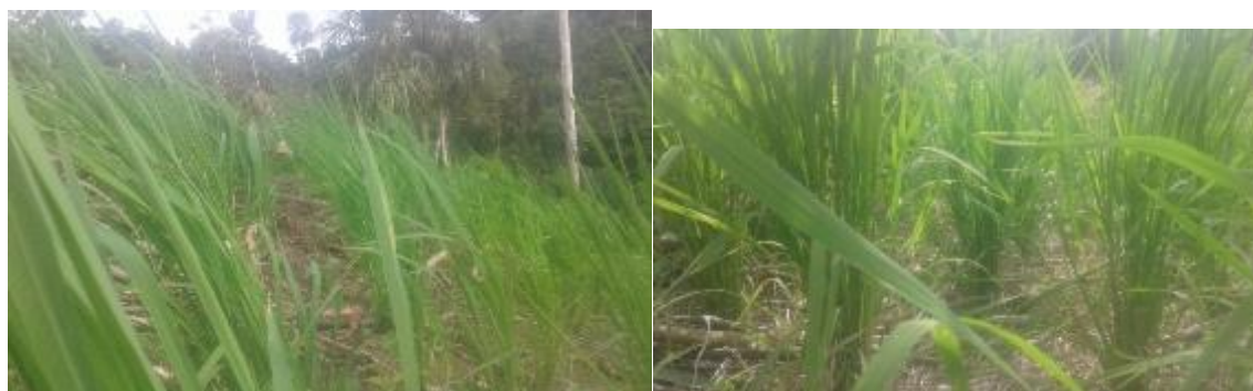
Ilustración 28. Limpia de Arroz de Tres Meses

Paso 9. Limpia; se realiza cuando el arroz tiene tres meses y sería la segunda limpia, se debe volver a limpiar para que este se crezca, tenga mejor desarrollo y cuaje bien el gajo, con esta limpia es suficiente, simplemente hay que esperar que llegue la cosecha.