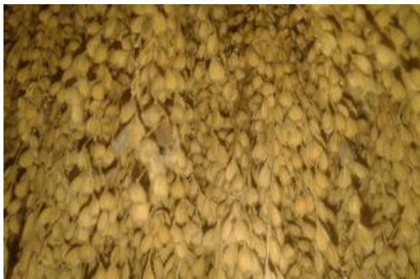
Ilustración 15. Arroz Orgullo de las Mujeres (fuente propia, 2016)

Se caracteriza por ser un arroz de grano redondo y muy pequeño, es de la familia de los chombos, de color amarillo con puntas negritas, de gajo corto, coposo con una guaña gruesa, alcanza una altura de un metro y medio cuando está en la producción, sus hojas son de color verde muy gruesa y afiladas, pueden cortar si no sabemos caminar dentro del cultivo. Esta variedad es fácil de desgranar ya que el grano se suelta muy fácil del gajo, el terreno más adecuado para esta variedad es en lomas o tierra que no sean húmedas, esta calidad de arroz se debe asolear de uno a dos días dependiendo la intensidad del sol.