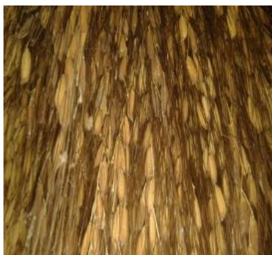
Ilustración 19. Arroz Yeragual Negro

Puedo decir que la anterior variedad y esta son hermanas, simplemente se distinguen por el color uno amarillento y el otro negro, en lo demás todo es similar.