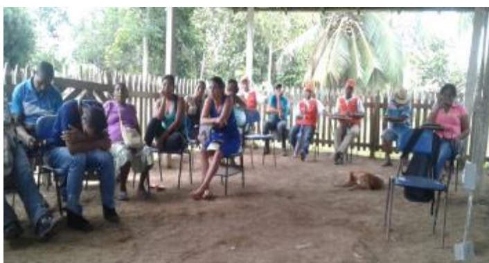
Ilustración 8; Encuentro Local, (fuente propia, octubre 2016)

Encuentro local: esta actividad se realizó con el fin de establecer un vínculo con la comunidad que permitiera obtener confianza por parte de ellos. El tema central fue identificar cuáles son las principales problemáticas que han llevado a la pérdida de algunas semillas de arroz, de la misma forma plantear que alternativas podíamos realizar para recuperar lo que se estaba perdiendo cuando se dejaba de cultivar el arroz. En este encuentro se seleccionó la población con las cuales se trabajaría la semilla con el fin de facilitar todo el proceso.