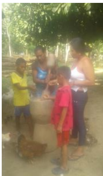
Ilustración 13. Abuelas cocinando alimento y pilando el arroz

Talleres de aula: trabajado con los estudiantes de los grados 3, 4 y 5 de la casa del saber Bocas de Palmitas, donde se trabajó con los granos de arroz como material didáctico, también los