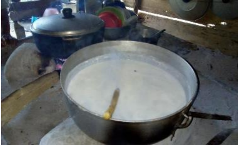
Ilustración 32. Alimento Tradicional, Mazamorra de Arroz