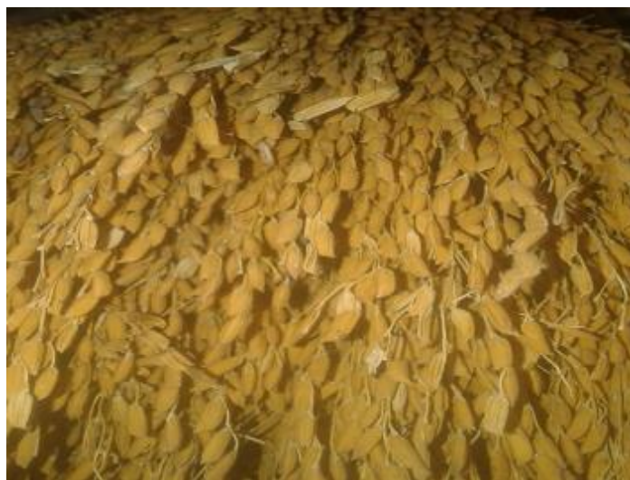
Ilustración 23. Arroz Ligerito Mono

Se caracteriza por ser un grano fileño ( delgado ) de color rojizo, de gajo delgado y muy fácil de desgranar y pilar, algo que caracteriza a los arroces marfilitos es, que con solo un día de sol pueden estar listos para pilar, la característica de la planta y el proceso de siembra es el mismo de las demás variedades.