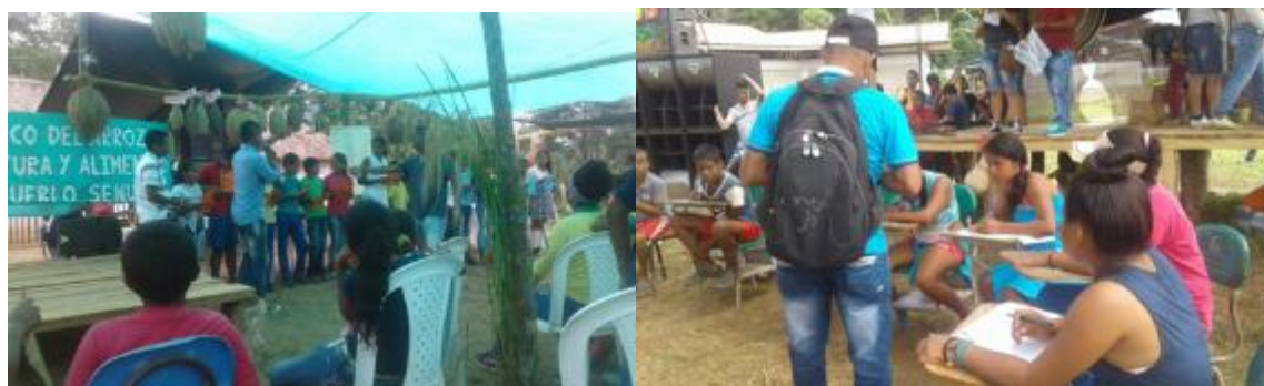
Ilustración 37. Foto; Concurso Pedagógico (fuente propia, 2016).

Contar la historia del arroz, como es proceso del cultivo, el concurso pedagógico que consiste en poner a prueba el conocimiento de los estudiantes sobre que tanto conocen del cultivo del arroz y la cultura Senú, para que esta permanezca en cada una de las memorias de los alumnos y participantes.