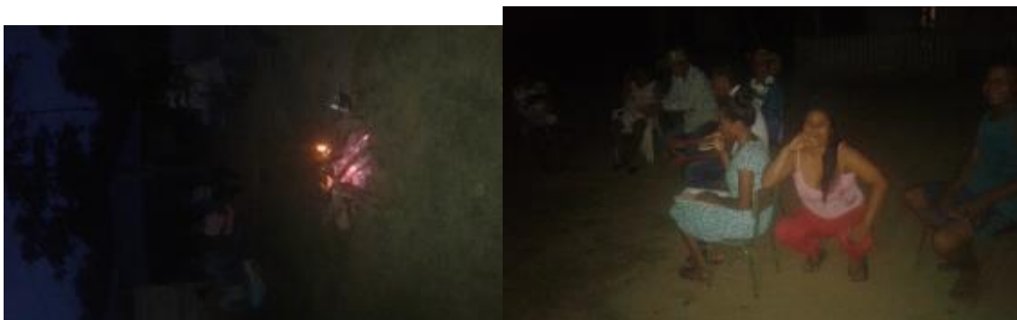
Ilustración 10. Dialogo con mayores al rededor del fuego

Dialogo con sabios y sabias: en esta actividad el objetivo era conocer y establecer qué relación tiene el cultivo de arroz con la familia y qué papel juegan los niños-niñas y las mujeres dentro de esta práctica del cultivo.