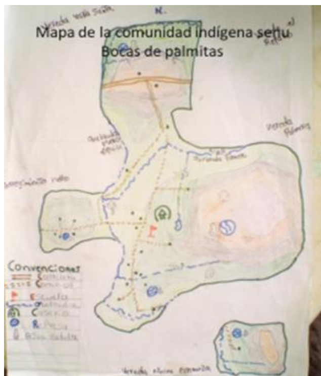
Ilustración 5; Mapa Comunidad Bocas de Palmitas

Su nombre Bocas de Palmita surge debido a la ubicación geográfica, ya que se encuentran al lado de la desembocadura que forman las quebradas palmera y mello, de esta situación viene en nombre de boca, y palmitas se debe a la gran cantidad de palmitos ( palma amarga ) que hay en la zona, este es un árbol de gran tamaño que puede alcanzar alturas hasta de 30 metros, de las que se toman sus palmas para empalmar la casa Senú.