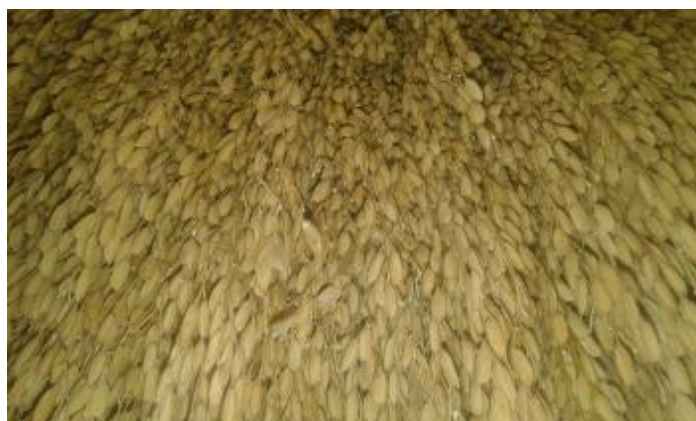
Ilustración 21. Arroz fortuna

Es un arroz que pertenece a la familia de los chombos, es de color amarillento de gajo grueso y largo, la mata es similar a las anteriores, las características de su grano lo hace ser un arroz duro para pilar, por ende, lleva mucho sol debido al espesor de su grano. Una de sus características que lo hacen diferente es la duración que tiene para producir, es de cuatro meses,