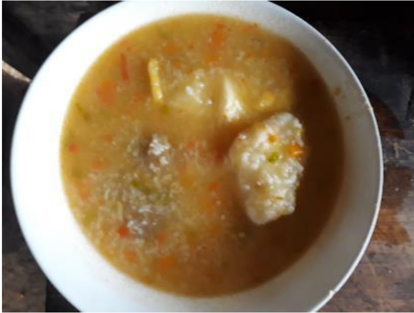
Ilustración 31. Alimento tradicional, Mote de Arroz