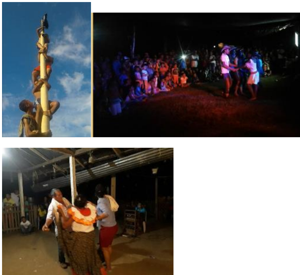
Ilustración 38. Fotos; Bailes Tradicionales y Actividad de Vara de Premio.

recreativas ancestrales que buscan promover la salud y visibilizar los juegos tradicionales del pueblo Senú.