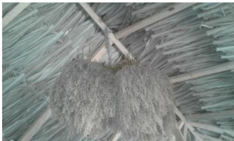
Ilustración 31 Puños de Arroz de Semilla en el Gancho. (Fuente propia, 2016)

Paso 12. Selección de semilla; se escogen los puños de arroz que previamente ya fueron seleccionados en su recolección, y son colgados en el gancho que está sujeto a la vara caballetera de la casa Senú, donde permanecerán con una estricta seguridad y acompañamiento de las mujeres del hogar, se bajarán de ese sitio cuando se época de siembra.