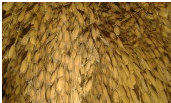
Ilustración 20. Arroz Toldo Sucio

Es un arroz de grano delgado, familia de los marfilitos de color negrito en la punta del grano, tiene un pelito aproximadamente de un centímetro, es de gajo largo, la planta puede alcanzar