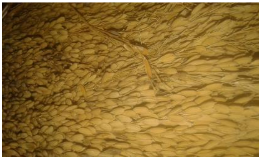
Ilustración 24. Arroz Perla

Este tipo de semilla es de grano delgado, hace parte del grupo de los arroces marfilitos, los que hacen parte de esta familia son característicos por lo delgado de los granos, por esto los abuelos los agrupan de esta forma, su color es coloradito, el gajo mediano, es muy característico por el peso que tiene, ya que regularmente un puño puede dar 10 libras de arroz, es un arroz lerdo ya que para tener producción dura 4 meses. En el proceso de siembra es muy similar a las demás variedades.