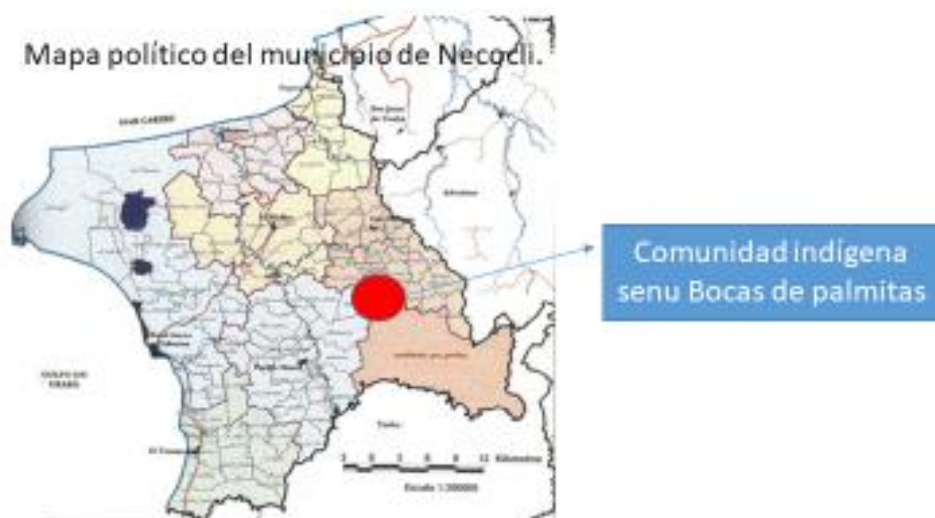
Ilustración 4. Mapa del Municipio Necoclí