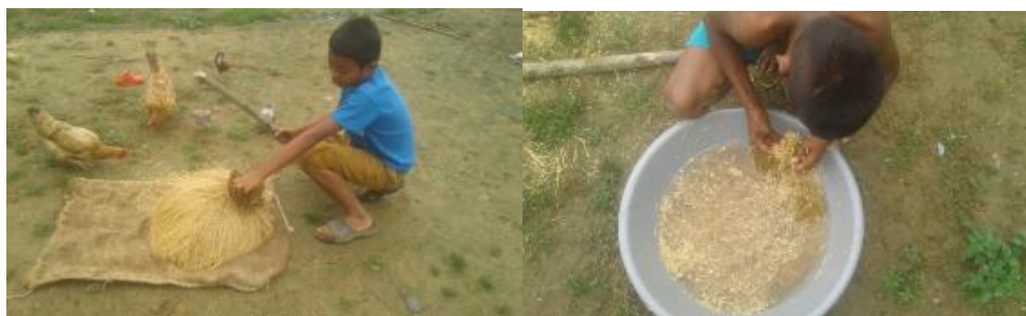
Ilustración 25. Niños Desgranado y Sacando el Vano del Arroz para Luego Sembrar.

Paso 6. Se organiza la semilla; se bajan los puños de arroz del gancho, sobre un costal y con un palito se golpea para desgranar, no se debe hacer en el pilón porque los golpes de la mano con el pilón pueden pillar un poco y dañar la semilla, luego se introduce el arroz desgranado en un recipiente con agua para sacar el arroz vano o malo, finalmente se echa en un costal para que este desagüe la húmeda, y se debe curar con ceniza para evitar que las hormigas se coman la semilla del arroz.