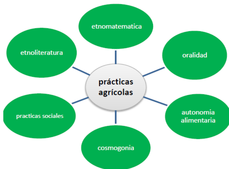
Ilustración 33. Pilares del Conocimiento Ancestral a Través de las Prácticas Agrícolas Senú (Tomado de tesis de grado, Julio, Medellín, 2013)

Esta práctica se integran pilares educativos el cual lo gráfica de esta forma.