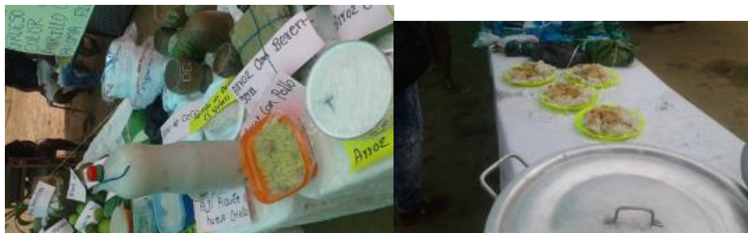
Ilustración 36. Foto; exposición de platos derivados del arroz

elaboración, con el fin que los alumnos aprendan como es el proceso de elaboración de cada uno de estos platos.