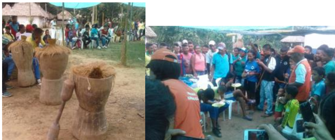
Ilustración 36. Foto; Concurso del Pilandero y Comelón

Los concursos del pilandero y comelón, que visibiliza las destrezas de los niños y niñas en estas actividades, pero a la vez que estos no olviden estas prácticas tradicionales.