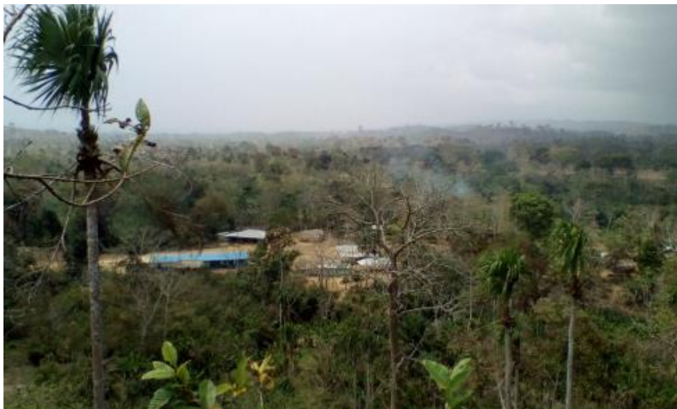
Ilustración 2. Comunidad Bocas de Palmita