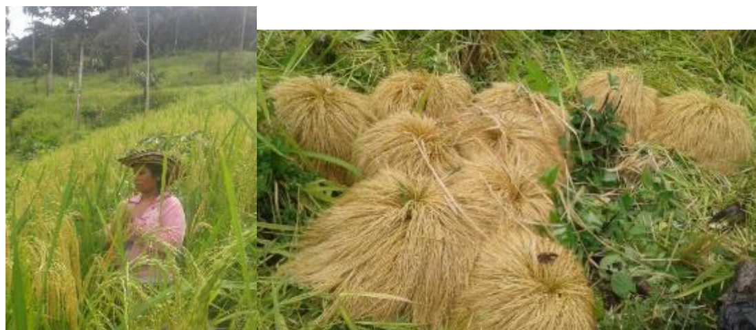
Ilustración 29 Corte de Arroz

Paso 10. Recolección de cosecha; esta se realiza cuando el arroz está maduro y se debe hacer después que pase el quinto de la luna, para evitar que esta se dañe, en esta misma fase se escogen los puños de arroz que van a quedar de semillas para el próximo año.