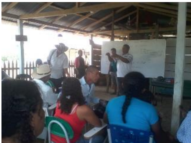
Ilustración 7. Socialización de Semilla