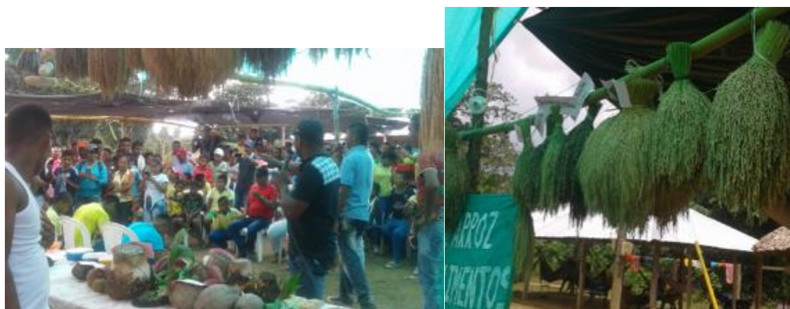
Ilustración 34. Foto de Exposición de Semillas en el Marco del Festival del Arroz.

Dentro del encuentro se destaca actividades como el trueque que consiste en: los participantes traen semillas de arroz para intercambiar, pero se ha ido complementando con otras semillas para dar más fuerza a la parte agrícola, no solo recuperar semillas de arroz sino también recuperar otras semillas que están desapareciendo en el territorio de Bocas de Palmita.