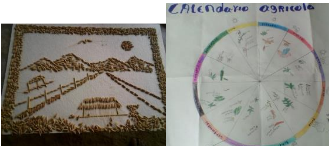
Ilustración 14. Dibujo decorado con granos de arroz y calendario agrícola realizado por los estudiantes, (fuente propia, 2017)

niños y niñas pintaban cada uno de los objetos y materiales que se utilizan en el proceso del cultivo de arroz. El objetivo de la actividad fue saber que tanto conocimiento tienen los alumnos sobre este cultivo, y finalmente lograr construir con ellos mismos un calendario agrícola Senú, de acuerdo a nuestro contexto con asesoría de sabios expertos en la agricultura.