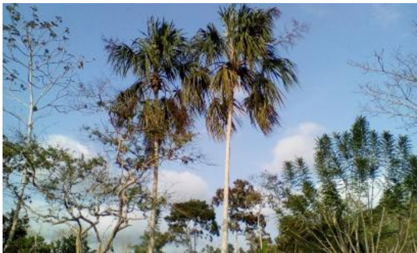
Ilustración 6. Árbol de Palmito (palma amarga) (fuente propia, febrero 2019)