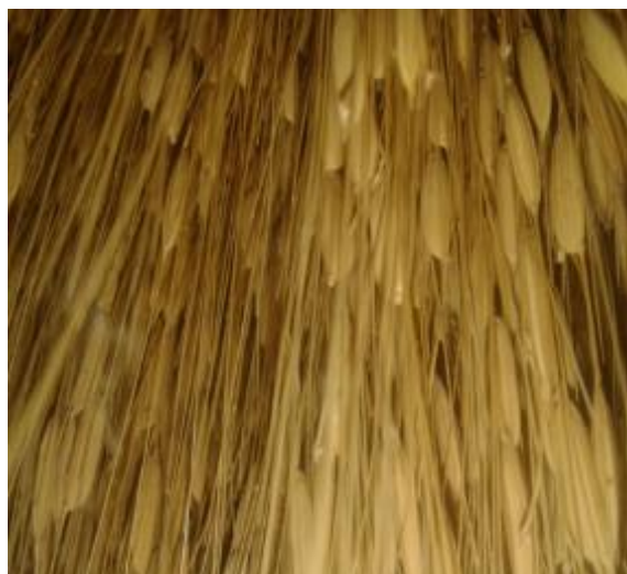
Ilustración 18. Arroz Yeragual

Este arroz se caracteriza por ser de gajo largo, de grano delgado, familia de los marfilitos de color amarillento, tiene un pelo en el extremo del grano que puede alcanzar a hasta siete