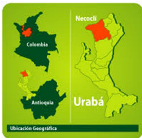
Ilustración 3. Ubicación Geográfica de Necoclí.