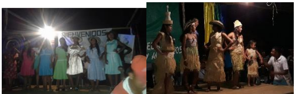
Ilustración 35. Fotos; niñas exhiben vestido tradicional y artesanal en el marco del festival del arroz

El reinado cultural y pedagógico colocando a prueba la creatividad de los estudiantes para construir vestidos artesanales y tradicionales utilizando el material del arroz.