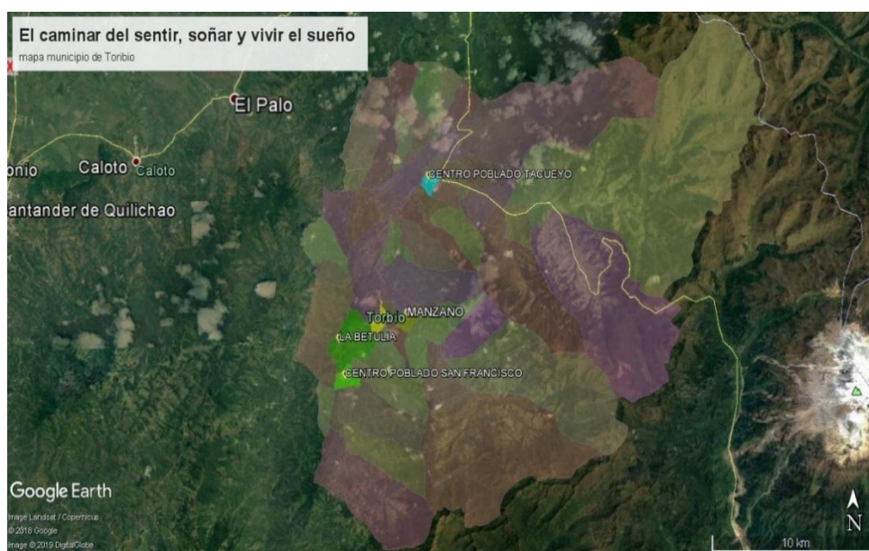
Ilustración 1 Mapa del municipio de Toribio, Tomado de Google Earth, Imagen 2019 Digital

“El sector rural –que concentra el 99.9% de la población-- está conformado por estos tres resguardos con sus respectivos Cabildos, reconocidos como entidades públicas de carácter especial, con personería jurídica, patrimonio propio y autonomía administrativa; igualmente la mayoría de la población del casco urbano se reconoce como miembro de la etnia nasa y son gobernados por el Cabildo de Toribio. Al interior de los resguardos operan 66 Juntas de Acción Comunal JAC de las veredas que fueron incorporadas en el sistema de gobierno indígena, así como los Bloques de veredas o Capitanías, una figura organizativa diseñada para mejorar los mecanismos participativos. Los tres cabildos están asociados en el Proyecto Nasa, la asociación de autoridades indígenas del municipio constituida de acuerdo con el Decreto 1088 de 1993, que tiene similares condiciones de entidad pública que los cabildos”. (Alcaldía Municipal de Toribio, 2017)