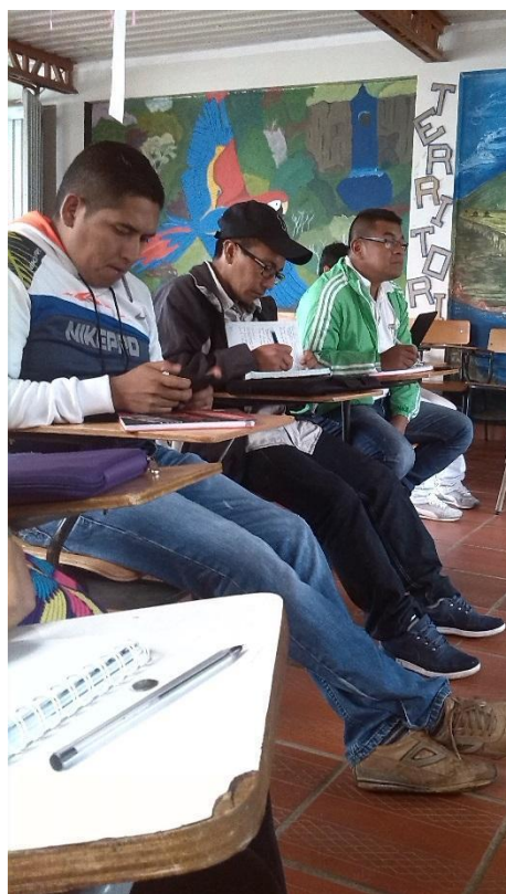
Fotografía 4. Locales, Encuentros, Escuela Agroecológica Cecidic, 2015