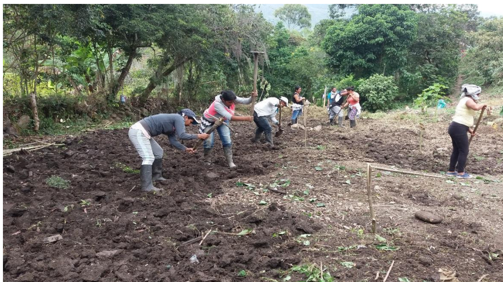
Fotografía 18. Minga de preparación del terreno, Tomada por Juan C Yatacue, 2018

traen malos pensamientos, como consecuencia muchas veces de problemas en sus hogares. Por este motivo se requiere que las personas hagan un pago o armonización. Esta minga la hicimos con padres de familia y docentes del centro piloto wasak kwewexk. (Ver fotografías 18 y 19)