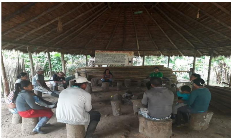
Fotografía 21. La Tulpa, 2018

En el tul se plantaron semillas como; frijol, alverja, maíz, alchucha, yuca, arracacha, piña, zapallo, remolacha, zanahoria, flores, acelga, espinaca, y demás, se ve una alegría de tanta variedad de productos, todos hacen alusión de seguir conservando y el centro Wasak K, debe ser una casa donde se empiecen a recolectar y compartir a la comunidad semillas, siendo un ejemplo de Tul y la conservación de la semilla.