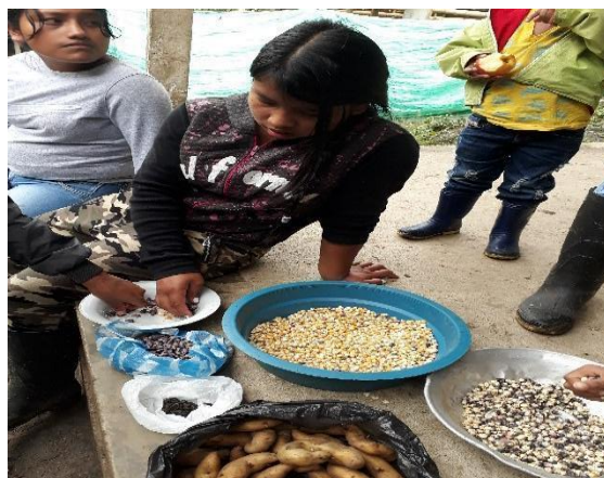
Fotografía 23. Compartir semillas el Tul