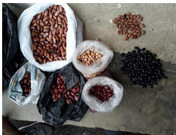
Fotografía 22. El Compartir de semillas para el Tul, tomada por Lina Noscue

sin mezquindad, si no por el contrario generar espacios abiertos que entre todos se cuide y así mismo sea un beneficio comunitario. (Ver fotografías 22 y 23)