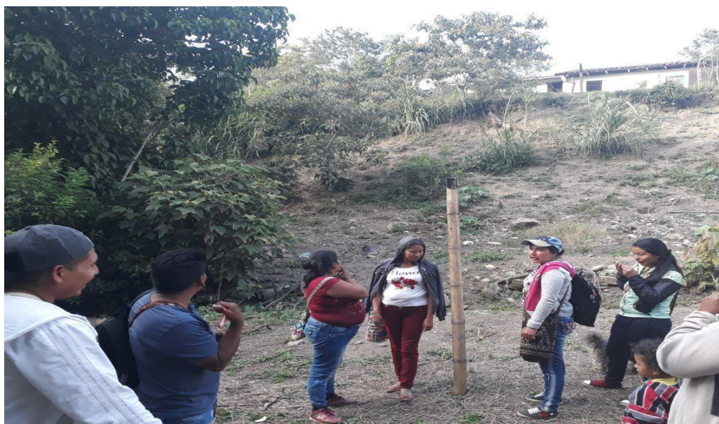
Fotografía 17. Recorrido Finca Manzano, con equipo Wasak Kwewesx y estudiantes

En la tercera minga, nos dirigimos al lote para soñar y planificar las actividades del próximo encuentro, cómo debíamos orientar la siembra y la armonización, como realizar la preparación del terreno con los padres de familia y estudiantes. Algunos padres de familia aportaron sus conocimientos sobre la preparación de abonos orgánicos, esto nos llevó a darnos cuenta que tanto nosotros como la tierra estamos mal alimentados, y que la forma como hemos tratado la madre tierra, aplicándole herbicidas, fertilizantes químicos y tratándola solo con machete genera una desarmonía entre el hombre y la tierra.