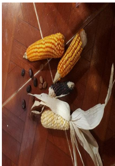
Fotografía 11. Semillas para Ofrenda Laguna San José, 2017