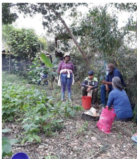
Fotografía 28. Armonización del Tul