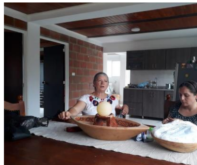
Fotografía 25. Encuentro familiar de mujeres, tomada por Lina Noscue, 2018