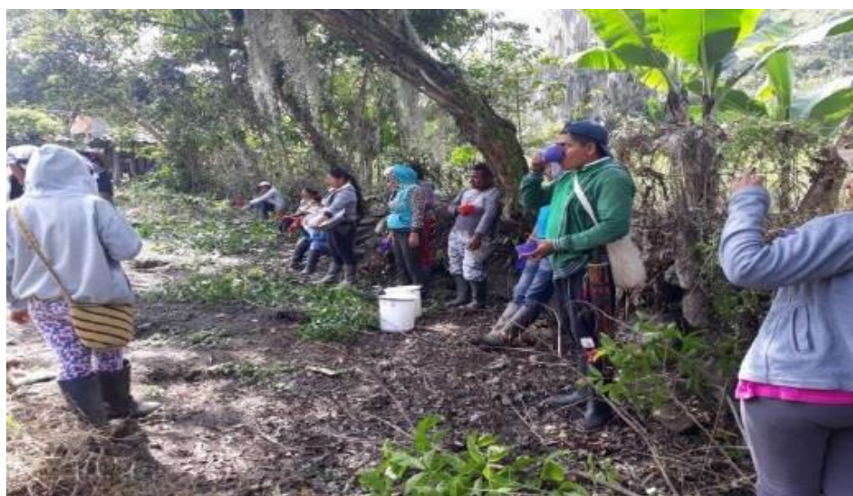
Fotografía 20. Mingas de limpieza, foto tomada por Lina R Noscue, 2018

además afirmaron que no se debe permitir tomar fotos de los extraños, ya que ojean el terreno con malas intenciones, señalando que para el próximo encuentro, se debía traer materiales para alimentar el terreno como abonos orgánicos. Finalmente quedaron compromisos para las próximas mingas, acordando con todos, una periodicidad de ocho días, para reunirnos en torno al Tul. Encargarnos del cuidado de la siembra y fortalecer la amistad y hermandad entre comuneros. (Ver fotografía 20 y 21)