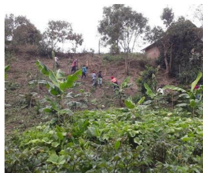
Fotografía 27. Minga de limpieza y cosecha del Tul