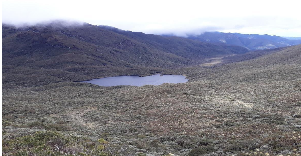
Fotografía 13. Laguna San José, Huila