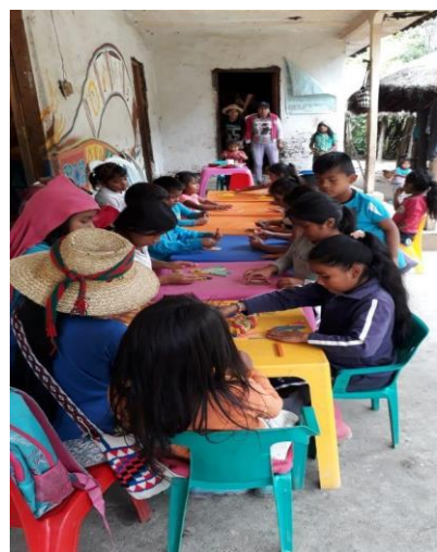
Fotografía 29. Compartir juegos aprendidos en etno matemáticas, 2018