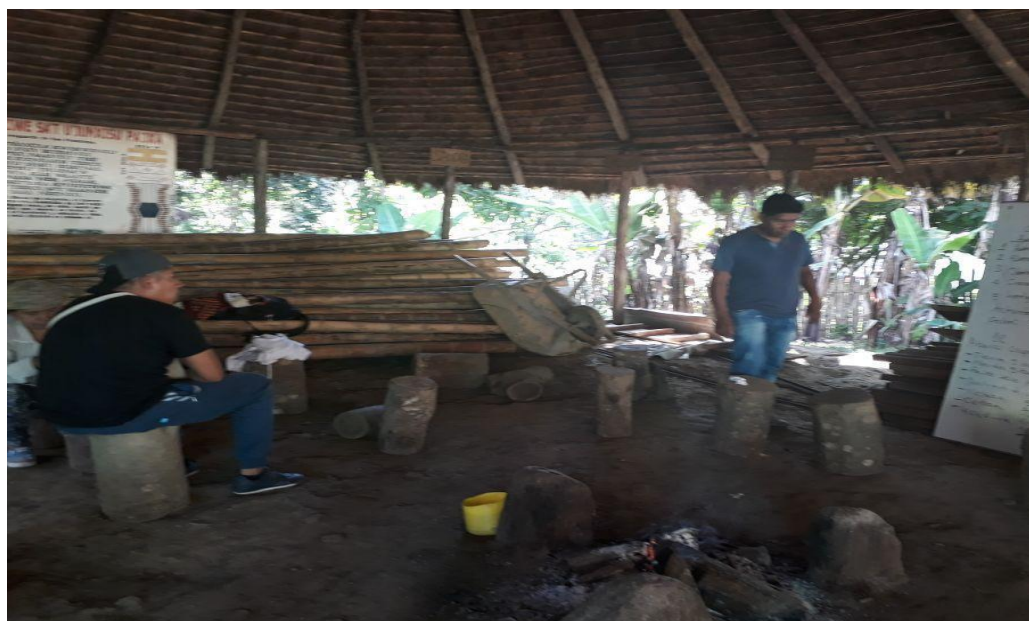
Fotografía 16. Planeación Mingas, Tulpa Wasak Kwewesx, tomada por Lina R Noscue, 2018

Así pues, en esta minga compartíamos, alimentos, y conocimientos sobre el trabajo en la tierra, compartimos también alegrías y sueños del buen vivir de cada uno de los participantes, luego hicimos una evaluación del trabajo realizado y nos propusimos soñar las nuevas mingas colectivamente con el grupo de docentes y los padres de familia. (Ver fotografía 16 y 17)