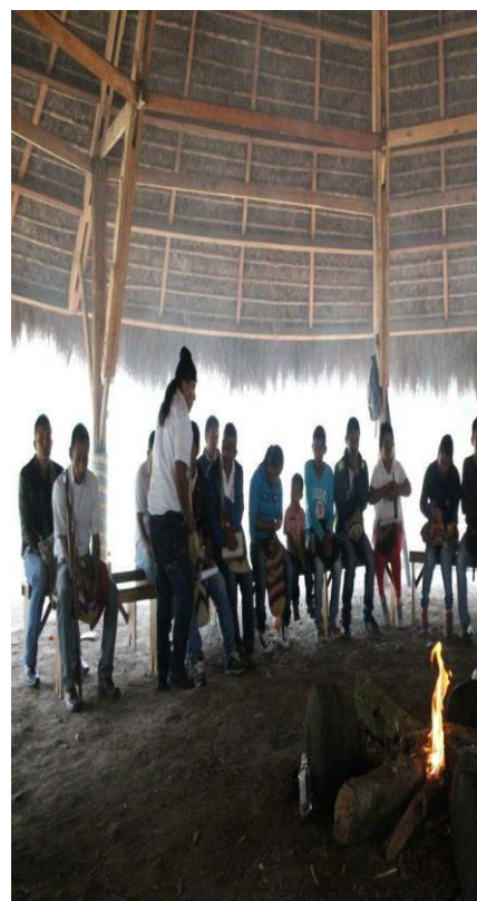
Fotografía 5. Encuentros Tulpas Cecidic, tomada por José M Galvis, 2015