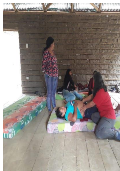
Fotografía 31. Espacios de Sanación, centro Wasak Kwewesx