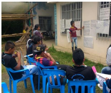
Fotografía 6. Locales Escuela Agroecología Cecidic, Tomada por Juan C Yatacuc, 2016

Nos dimos cuenta que una verdadera autonomía alimentaria, no tenía solo que ver con la compra de los alimentos, que producían los agricultores locales, entendimos que este tema era mucho más amplio que era necesario “Revivir memorias acerca de la alimentación como un principio de resistencia para la comunidad Nasa de Toribio”. En conjunto con los estudiantes realizamos un proceso de autoevaluación, de observación de sus familias, el escuchar a sus mayores, aprendiendo a tener malicia para poder sentir la vivencia y necesidades que planteaban los mayores. (Ver fotos 6 y 7)