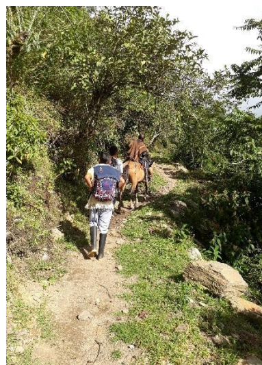
Fotografía 12. Camino a la de Ofrenda Laguna San José, Tomada por Juan C Yatacue, 2017

La laguna de san José, que se visitó para el ritual está aproximadamente a 8 horas de camino, decidimos hacer esa práctica como recuperación del caminar que hacían nuestros abuelos, para la siembra de sus cosechas, porque es muy importante equilibrar el clima para los cultivos, hay que llamar a las lluvias y armonizar el territorio. Para este momento Lina tiene su periodo menstrual y por este motivo el The Wala aconseja que una de las prácticas de la mujer