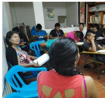
Fotografía 7. Locales Escuela Agroecología Cecidic, Tomada por Juan C Yatacuc, 2016

En cada uno de los procesos, que hicimos participaron los estudiantes de la licenciatura y de la Escuela Agroecológica, en distintos espacios concertados con el coordinador del