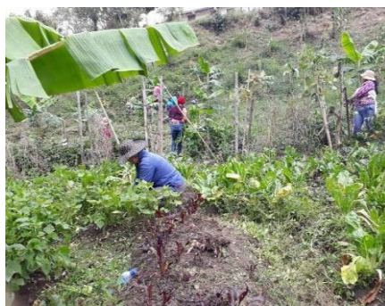
Fotografía 26. Minga de limpieza y cosecha del Tul