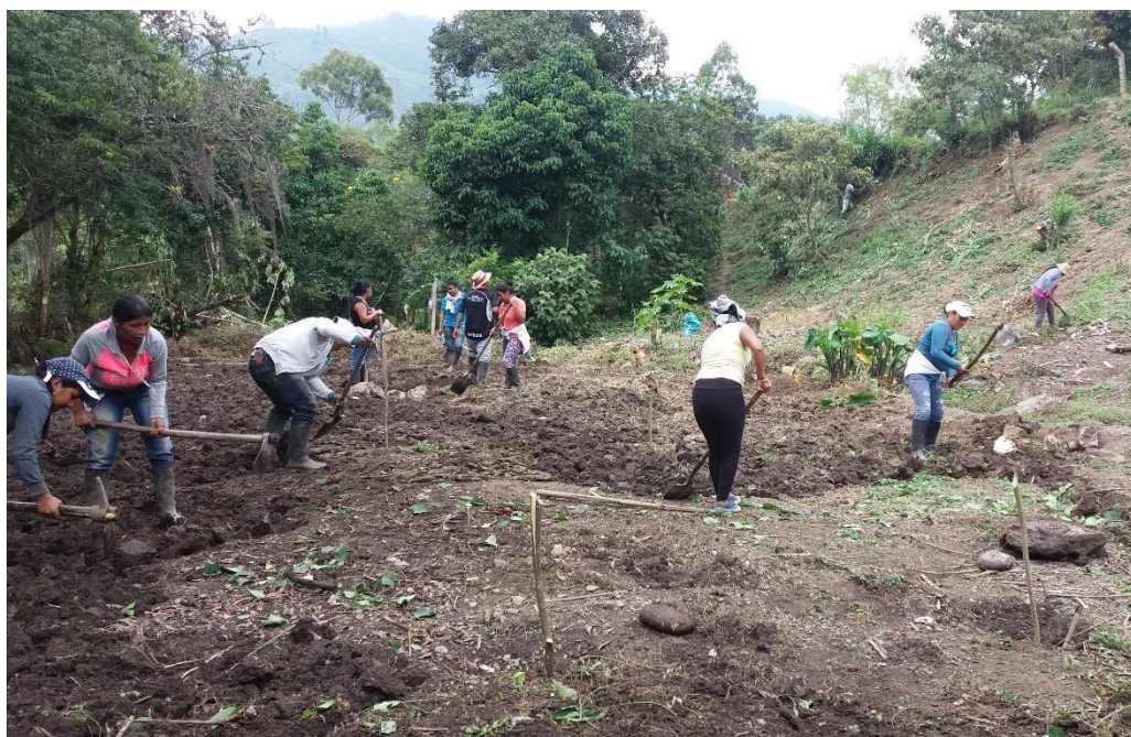
Fotografía 19. Minga preparación del terreno, Tomada por Juan C Yatacue, 2018

Luego del compartir el almuerzo, realizamos las mingas de palabra con participantes, nos presentamos, ya que algunos no nos conocían, empezamos agradeciendo por brindarnos la oportunidad de estar siendo partícipes de la siembra de la semilla con los integrantes del centro piloto, y así poder complementar el sentir, soñar y vivir el sueño; explicamos la importancia de revitalizar la siembra en nuestras familias como principio de nuestros mayores para el buen vivir y la armonía de los Nasas con el territorio.