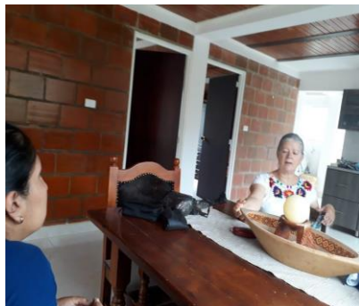
Fotografía 24. Encuentro familiar de mujeres, tomada por Lina Noscue, 2018