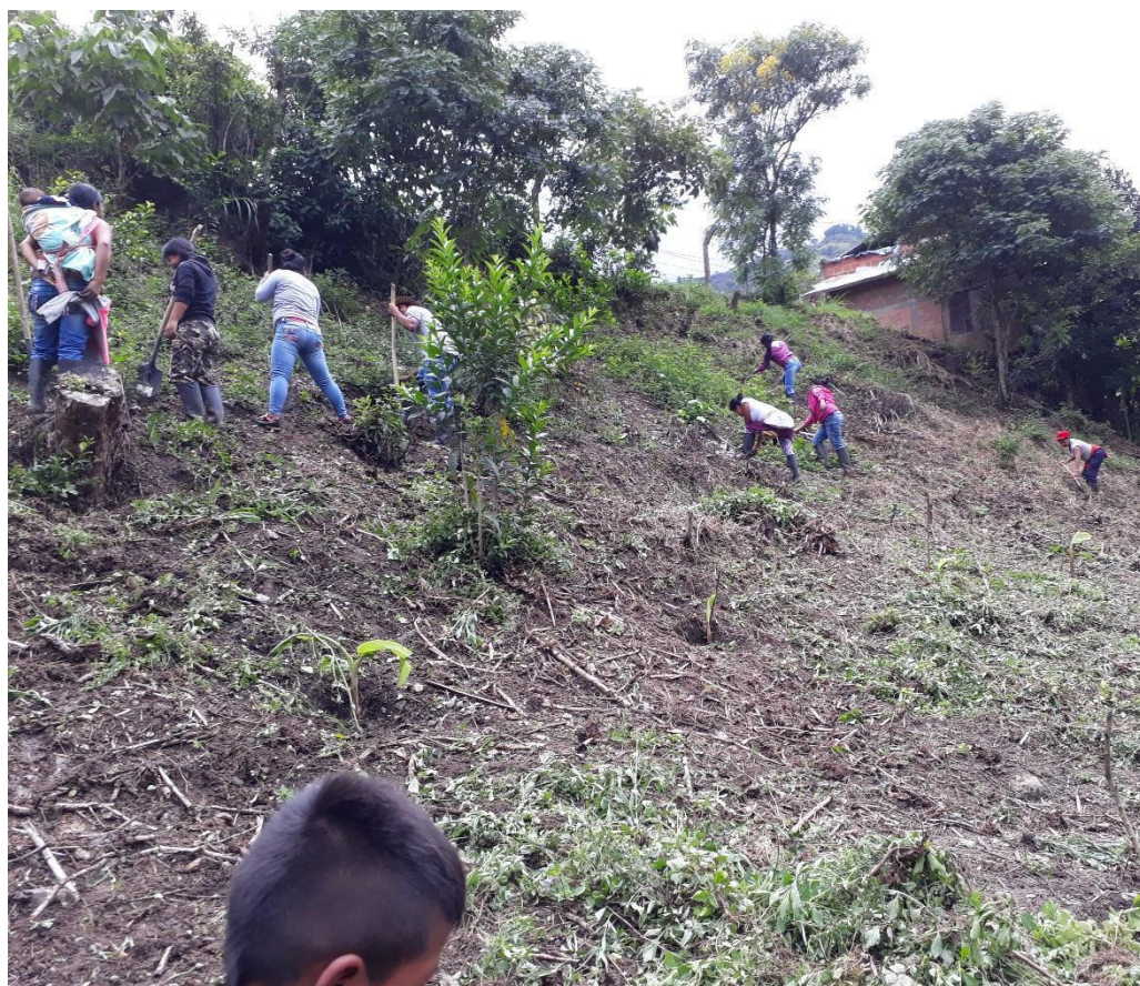
Fotografía 15. Minga de Limpieza, tomada por Lina R Noscue Vitonas, 2018.

En el Mes de Marzo del mismo año, realizamos la segunda Minga comenzamos por compartir el trabajo comunitario, siguiendo el caminar de nuestros ancestros y explicando que la minga es un tejido de educación comunitaria; del soñar despierto y vivir el sueño de pervivencia y resistencia del pueblo Nasa. Compartíamos la palabra dulce con los participantes, para la distribución de las distintas tareas que se necesitaban realizar. Estos espacios se llevaron los sueños vividos en la noche, y se contó las sensaciones que nos da el cuerpo al llegar al espacio es decir “las señas”, se vivencio el murmullo de los comuneros, compartiendo y tratando de interpretar sueños y señas.