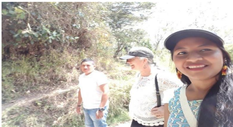
Fotografía 32. Evaluación y recorrido de la semilla del Sentir, Soñar y Vivir el Sueño