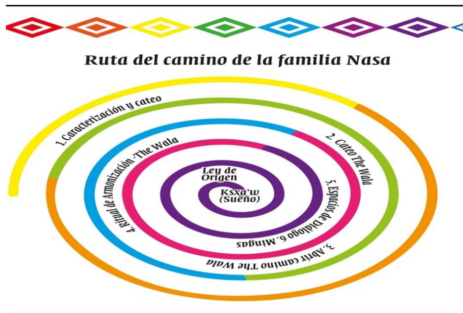
Fotografía 33 Ruta del camino de la familia Nasa, Diseñada por José Miguel Galvis