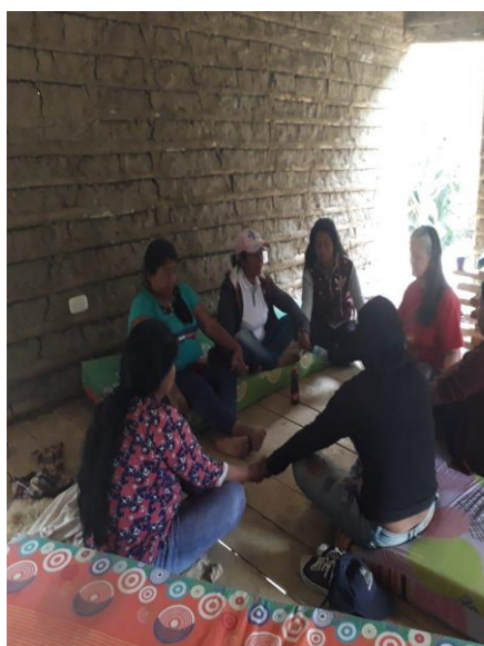
Fotografía 30. Espacios de Sanación, mujeres centro Wasak Kwewesx