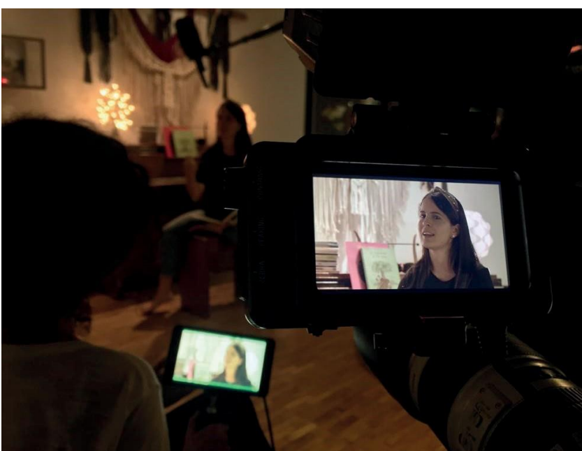
Figura 3 - Archivo personal María Lucía Castrillón Trujillo, 2020.