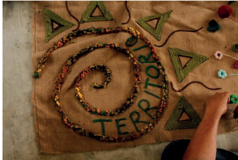
Figura 9 - Archivo personal Valentina Hincapié, 2019.