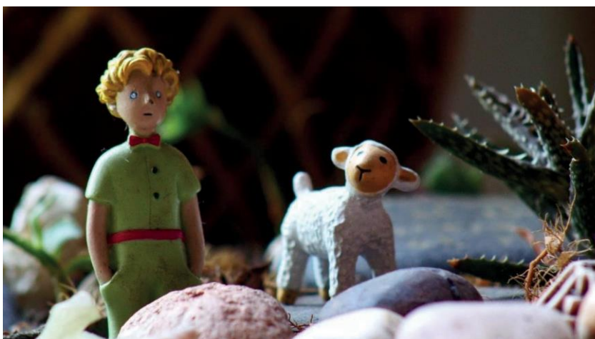
Figura 2 - Archivo personal María Lucía Castrillón Trujillo, 2020.