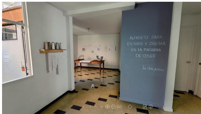
Figura 6 - Archivo personal Luz Stella Gutiérrez, 2018.