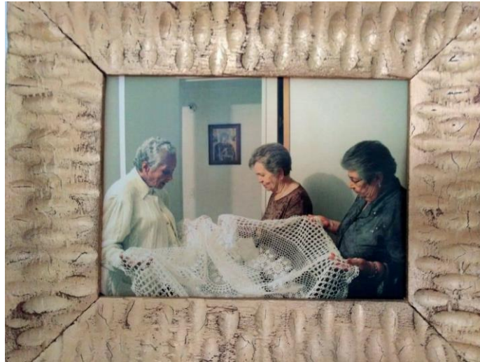
Figura 5 - Archivo personal Luz Stella Gutiérrez, 2018.