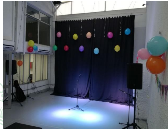
Salón múltiple. Corporación Artística y Cultural Te Creo.

La sede de Te Creo cuenta con cinco salones dotados con todo lo necesario para las actividades artísticas. Uno de ellos es el aula múltiple que, en ocasiones, es utilizada para presentar obras de teatro o actos culturales a todo público, o para que los estudiantes realicen sus muestras artísticas de fin de año. Sin embargo, aunque el espacio es cómodo, a veces se siente la necesidad de unas áreas más grandes.