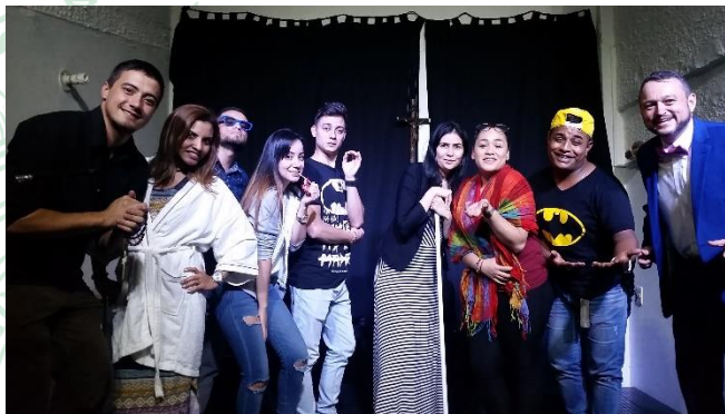
Grupo, Taller Teatro para la vida. Corporación Te Creo. Nov. 2017.