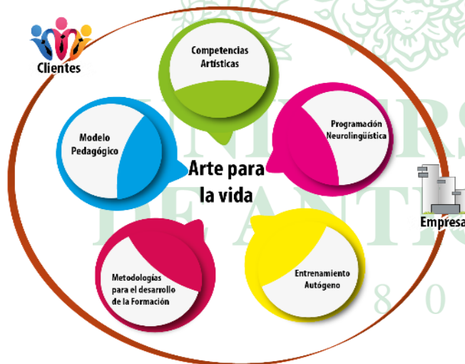
Modelo Pedagógico de Te Creo (Jiménez, 2013, p. 8)

y en la agudeza sensorial que permiten cambiar los paradigmas limitantes y conseguir un control sobre lo que se siente y lo que se hace. Finalmente, un cuarto componente, de desarrollo autógeno . Se denomina autógeno porque se crea a partir del propio