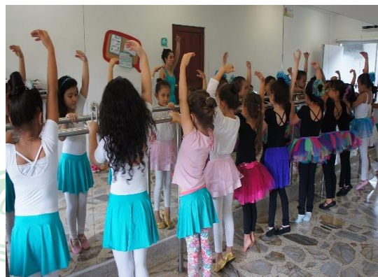
Curso de Ballet. Corporación Te Creo. Marzo 2017