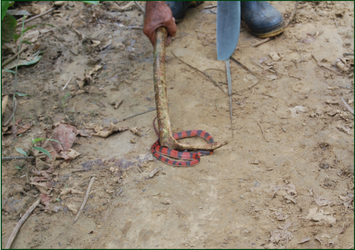
Figura 6. Captura de ejemplar de serpiente no venenosa. Comunidad indígena Senú, Necoclí – Antioquia. Agosto de 2015.

asistencia inicial diversos problemas médicos en zonas rurales dispersas, y en la actualidad son una estrategia social y económica de supervivencia para muchos asentamientos humanos distantes de un centro médico en los cuales se mantiene un legado de herencia cultural/ancestral (Cubides y Alarcón, 2016); en estos espacios la labor de las personas que llevan a cabo diferentes rituales de atención no médica, representan el punto intermedio en la atención hospitalaria dado que centenares de pacientes que llegan al hospital han pasado previamente por las manos de un curandero, medico tradicional o chaman, lo cual no solo demuestra la poca accesibilidad al recurso medico hospitalario y la ausencia de rutas de atención inicial, sino que añade y pone en consideración el rol activo de diversas personas que tienen como fuente de ingreso económico el ofrecer este tipo de servicios a los miembros de una comunidad (Figura 7).