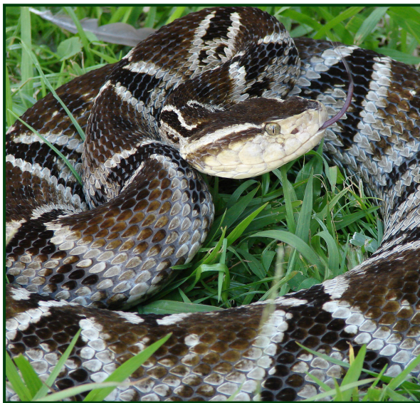
Figura 1. Serpiente venenosa de mayor importancia médica en Colombia. Bothrops asper (mapaná, talla X o cuatro narices) colección herpetológica del Serpentario UdeA. Medellín, Colombia.

En Colombia, uno de los departamentos en el que se presentan más mordeduras de serpientes es Antioquia (Otero et al. , 1992; Otero et al. , 1990, particularmente en las subregiones del Urabá, Occidente, Nordeste, Bajo Cauca y Magdalena Medio, en las que además, buena parte de los afectados recurre a curanderos que proporcionan tratamientos artesanales que incluyen bebedizos, succión de la zona de la mordedura, rezos y oraciones, incisiones o torniquetes, aplicación de la "piedra negra" sobre el sitio de la mordedura, y uso de emplastos de origen natural o de sustancias químicas de carácter tóxico; tratamientos que contribuyen en algunos casos, a la contaminación de la herida o al aumento de complicaciones mayores. En este departamento, se registraron en promedio 616,5 accidentes ofídicos anuales entre 2009 y 2015; siendo este último, el año con el mayor número de reportes (710 casos) (Informe Anual de Accidente Ofídico, Ministerio de Salud). Estos reportes, generalmente ocasionados por las mapaná ( Bothrops asper ) y los verrugosos ( Lachesis acrochorda ), son tratados de manera eficaz, con los diferentes sueros antiofídicos existentes en el mercado farmacéutico nacional, elaborados por el Instituto Nacional de Salud, laboratorios Probiol, laboratorios Bioclón, Instituto Clodomiro Picado de Costa Rica o Instituto Butantan de Brasil.