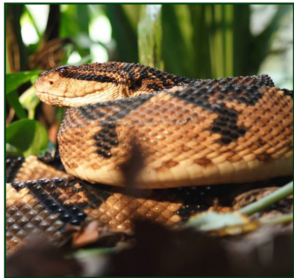
Figura 2. Serpiente venenosa de importancia médica en Colombia. Lachesis acrochorda (verrugoso o rieca) colección herpetológica del Serpentario UdeA. Medellín, Colombia.

Estas cifras poco profundizadas y analizadas desde una perspectiva etnoecológica, se correlacionan con