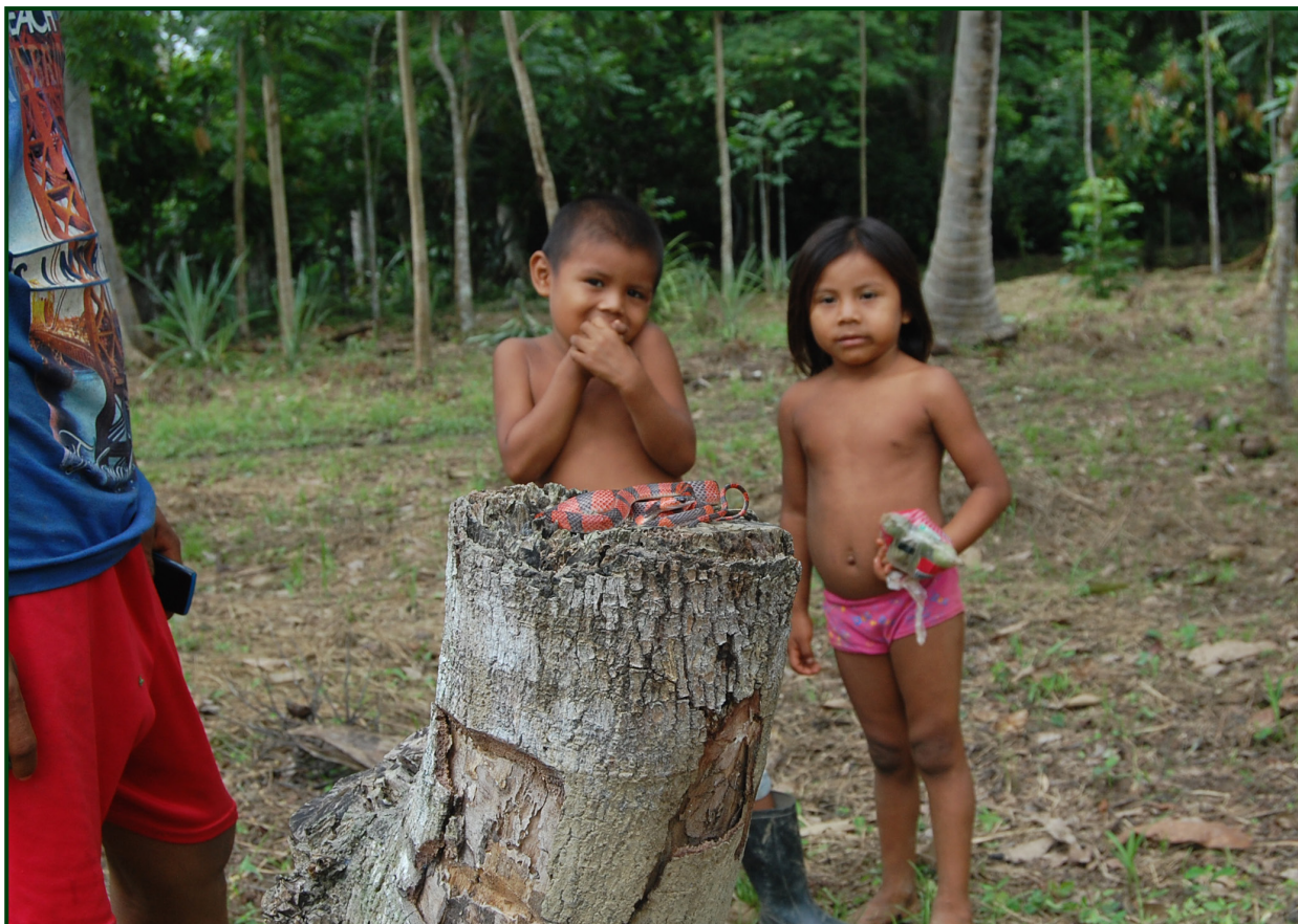
Figura 5. “EL MIEDO A LO DESCONOCIDO” Niño de la comunidad indígena Senú, Necoclí – Antioquia. Falsa coral ( Oxyrophus petolarius ) Agosto de 2015.