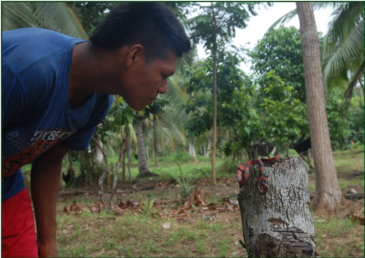
Figura 4. "UNA MIRADA AL CAMBIO" Joven de la comunidad indígena Senú, Necoclí – Antioquia. Falsa coral ( Oxyrophys petolarius ) Agosto de 2015

de conducta hacia las serpientes no es ajena de otras regiones del país pues este rechazo e intolerancia se observa en las ciudades más grandes y denominadas "protectoras de animales", en donde el miedo es apoyado por creencias religiosas y vacíos enormes en los contenidos de enseñanza de las ciencias naturales. En contraste al radical pensamiento del colono occidental, el indígena y campesino dejan abierta la posibilidad de un cambio, de una deconstrucción positiva de posturas fuertes hacia su medio, solo bajo la premisa de conservar y mantener en equilibrio su ecosistema (Cubides, 2016). Por consiguiente, en el ofidismo son diversas las comunidades que construyen imaginarios de vida y asocian a las serpientes a conjunto de rituales e historias que se transmiten de padre a hijo con el objetivo de resaltar la importancia de estas entidades biológicas dentro del paisaje, instruir a los más chicos sobre el peligro potencial al que se someten si confrontan algunos de estos temidos reptiles, o por el significado de divinidad – maleficio que representa dentro de la madre tierra.