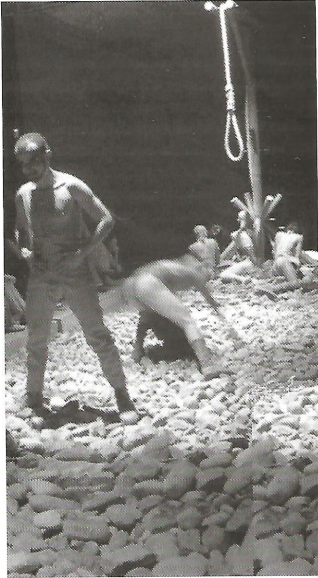
Obra: La penúltima cena

referencia habitual de la retórica y requiere la formulación de una nueva retórica orientada semióticamente. Dicho de otro modo, no se trata de mostrar el inventario enciclopédico, sino de comprender que la globalidad de la imagen está compuesta de rasgos discontinuos o, mejor dicho, abiertos. Como la connotación no domina el discurso de la escena por completo, la trama tiene que permanecer con un grado de denotación, sin el cual, dicho discurso sería imposible de captar. Ello permite entablar el pacto enciclopédico con el espectador, que es capaz de encontrar la congruencia interna de lo escenificado.