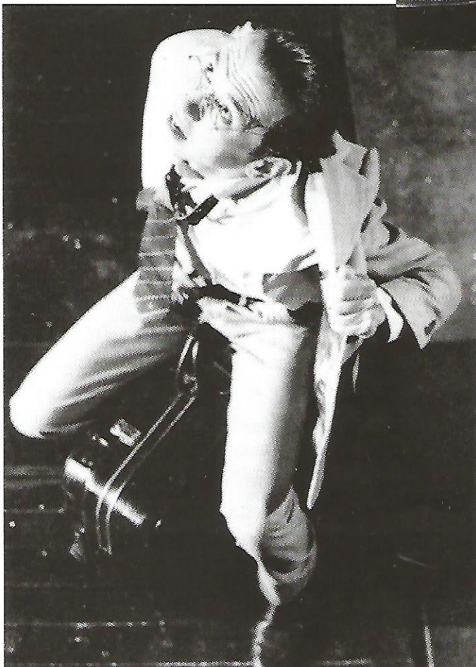
Afamenón y Clitemnestras. Obra: Martillo