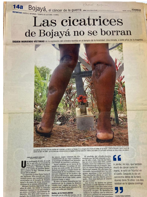
Imagen 7. Artículo de conflicto armado.