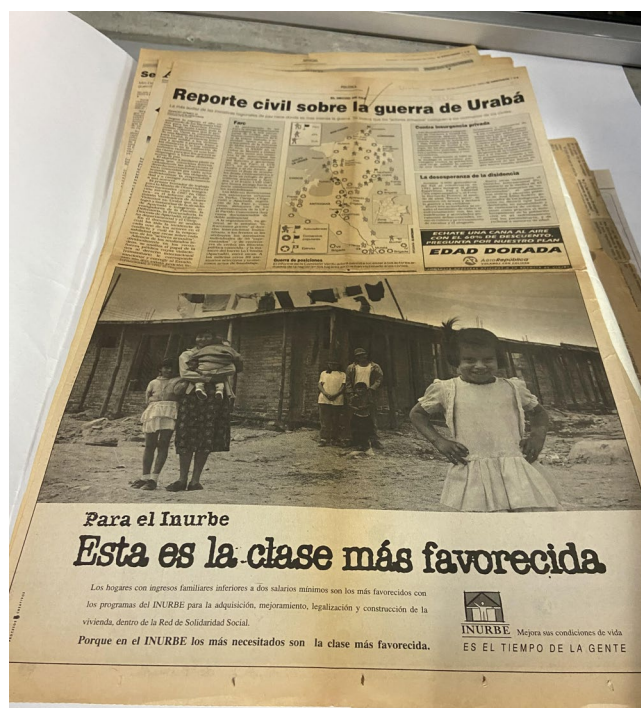
Imagen 5. Artículo sobre conflicto armado.

En este sentido, dentro de la selección de los 300 artículos ingresados se pudo evidenciar el mal estado de 72 artículos que se separan para ser enviados a la sección de la biblioteca donde se restauran los recursos que requieren procesos de conservación y restauración.