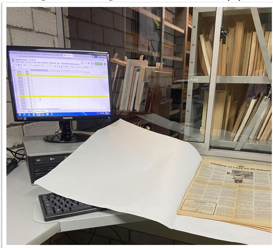
Imagen 4. Espacio de trabajo donde se llevó a cabo el análisis y descripción de los artículos de conflicto armado.

Finalmente, se pasaban a dos carpetas físicas nombradas: ingresados en janium para su posterior digitalización y la otra ingresados en janium para restauración y posterior digitalización. Ambas carpetas al ser digitalizadas deben de ser anexados los objetos del registro para ser recuperados por el catálogo.