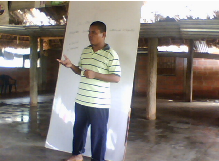
Encuentro local comunidad indígena el pando