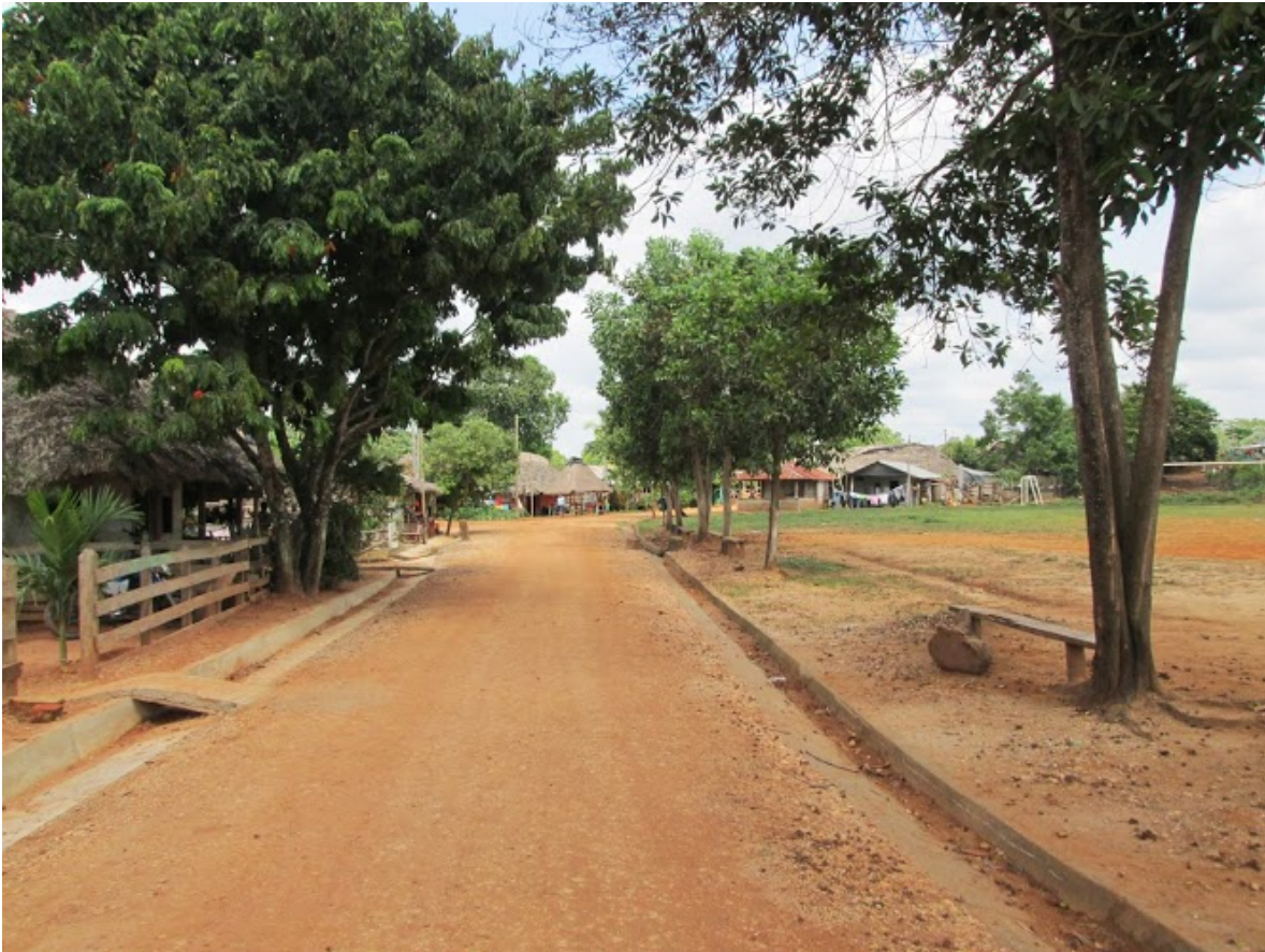
20 de abril-2013

Calle principal comunidad indígena el pando