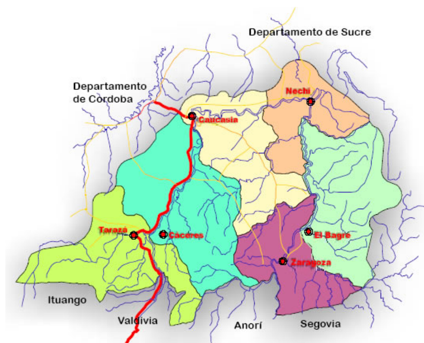
Mapa territorial del bajo cauca antioqueño