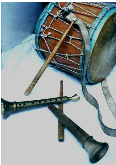
Tambor, baquetas y Chirimías de Girardota. Foto: Hernán Giovanni Osorio, 2001.

Esta tradición que llega con los primeros músicos durante el proceso de conquista y colonización, rápidamente es aprendida por mestizos, negros e indígenas, se vincula a los oficios litúrgicos y profanos, se extiende por toda la América hispana. Su función era reforzar o doblar las voces en los coros de los servicios religiosos de las principales catedrales. Llegó a ser tan común que fue necesario expedir cédulas reales controlando la “explosión” de tanto indio chirimero. Se usaba la cuerda completa (Soprano, alto, tenor y bajón), pero posteriormente, sobre todo para eventos en espacios abiertos (en procesiones, fiestas patronales...), se fue generalizando el uso de dos “clarines” (primo y dúo) y uno o dos tambores (un bombo y/o un redoblante).