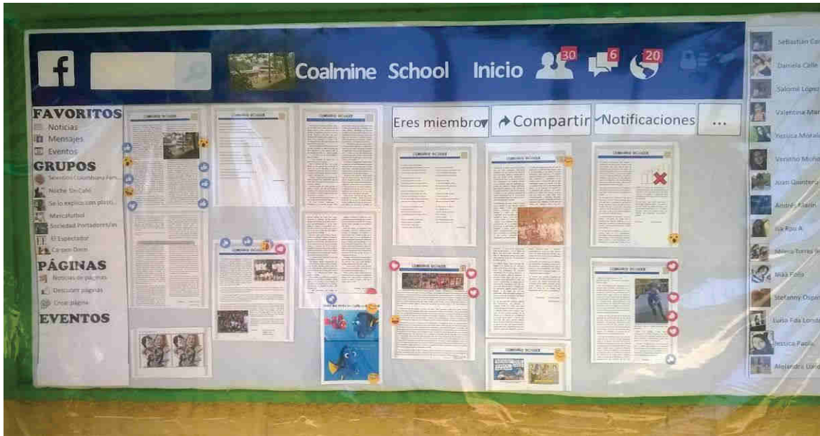
Figura 5. Publicación del periódico mural.

Textos como los de RD-EA-2 y 4, fueron divulgados en estos medios, siendo punto de partida para que otros estudiantes asumieran con mayor seriedad los procesos de escritura. En ellos comenzaron a reflejarse no solo ideas o percepciones aisladas de los escritores, sino que se concentraron miradas compartidas de un mismo fenómeno social: