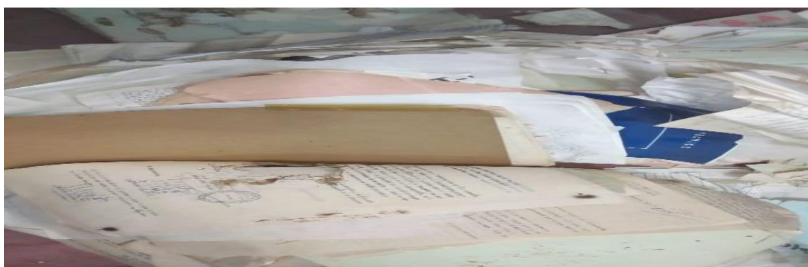
Ilustración 4. Fotografía sobre Centro de Administración Documental de Postobón S.A Planta Bello, Lugar, en donde conservaban los documentos, Bello: C. Blandón. 2019.