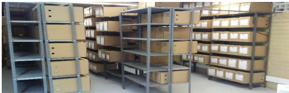
Ilustración 2: Fotografía sobre Centro de Administración Documental de Postobón S.A Planta Bello, Lugar, en donde conservan los documentos, Bello: C. Blandón. 2020.