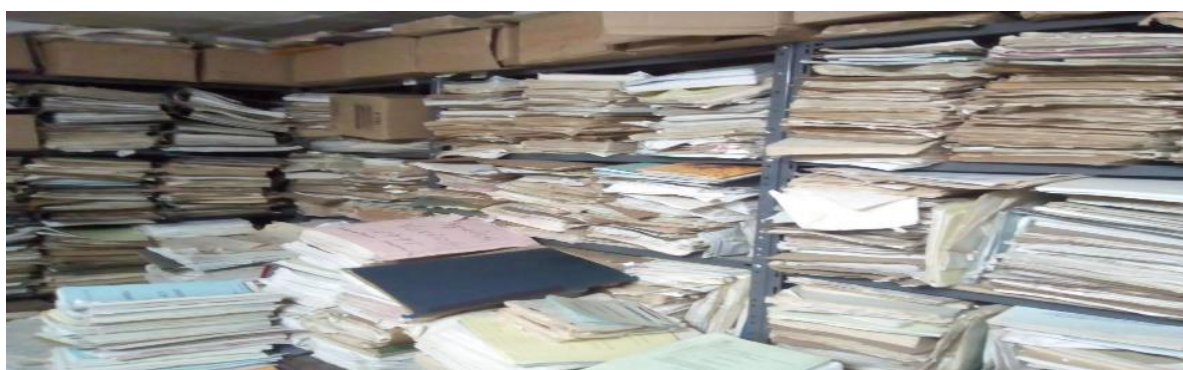
Ilustración 5. Fotografía sobre Centro de Administración Documental de Postobón S.A Planta Bello, Lugar, en donde conservaban los documentos, Bello: C. Blandón. 2019.