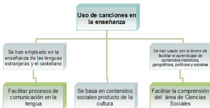
Figura 2. Uso de canciones en la enseñanza

En la figura 2, y teniendo en cuenta las referencias anteriores, se evidencia la estructuración del uso de canciones como estrategia educativa en relación con las Ciencias Sociales y sus contenidos.