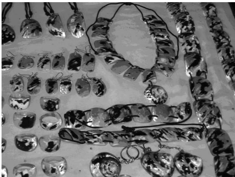
Figura 3. Collares, anillos, aretes y llaveros artesanales trabajados mediante una técnica que permite la exposición de la parte nacarada de las conchas de cigua.

compleja y las artesanías más elaboradas de cigua han sido realizadas por foráneos y comercializadas en la zona.