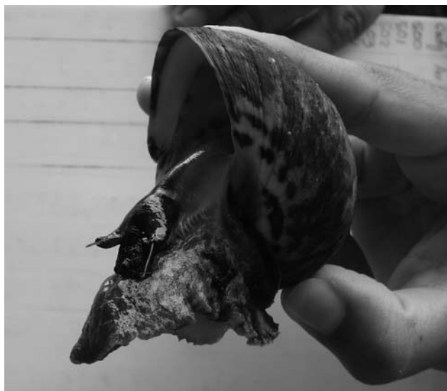
Figura 1. Ejemplar joven de Cittarium pica (cigua)

La conservación es una premisa para el uso futuro del recurso, pero la proporción, momento y oportunidad para desarrollar tanto la conservación como el uso pueden cambiar de una especie a otra, según los criterios empleados para definir el manejo sostenible por parte de las comunidades humanas. De hecho, algunos autores (Mather, Needle y Fairbairn, 1998) utilizan la expresión manejo sostenible de los recursos para indicar el balance entre el uso actual y las oportunidades de uso para las generaciones futuras. Por ello, esta investigación se centró en conocer la visión de la comunidad de Capurganá y Sapzurro sobre el grado de conservación que necesita la cigua para mantener sus posibilidades de uso para futuras generaciones y para que este caracol permanezca entre los símbolos socioculturales de identificación de la población.