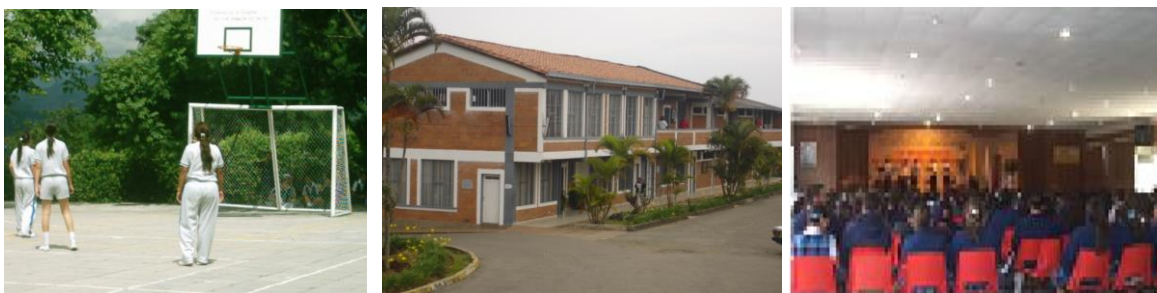
Fotografía Espinal, C. 2007.

“Formar un maestro constructor de espacios de humanización, de saber pedagógico y didáctico. El maestro de la Escuela Normal, es un maestro que propicia una formación de calidad avenida con las posibilidades de la articulación pedagógica ciencia y saberes, esencialmente, un investigador de su saber y constructor de espacios de civilidad y democracia escolar y social”.