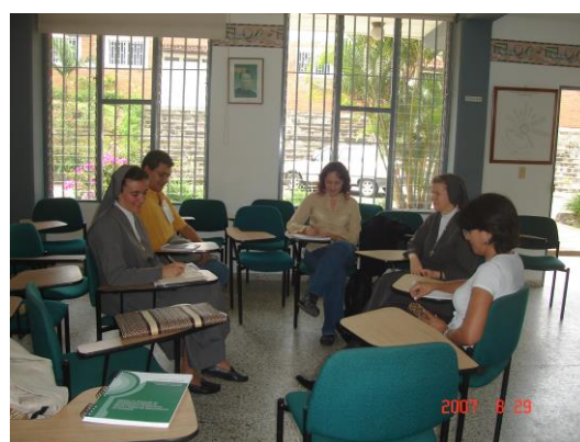
ENS de Copacabana.