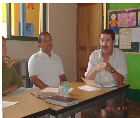
15/8/2007. E.N.S. Amagá