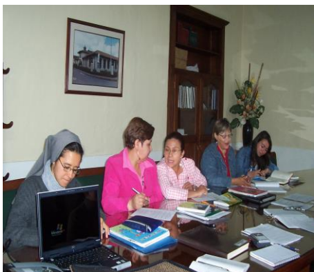
1/8/2007. E.N.S. Sta. Rosa de Osos