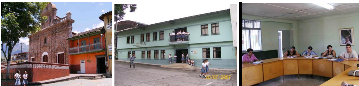
Fotografías Pulgarín, R. Espinal C. 2007

“Formar maestros idóneos para la Educación Preescolar y la Básica Primaria, desde el desarrollo de las competencias, centrado en el estudiante y su entorno y para la atención a distintos tipos de población, y en esa dinámica asuma con responsabilidad y compromiso los procesos de desarrollo socio-cultural de la comunidad, siendo respetuoso de la diversidad, la pluralidad y la diferencia de la sociedad Colombiana”.