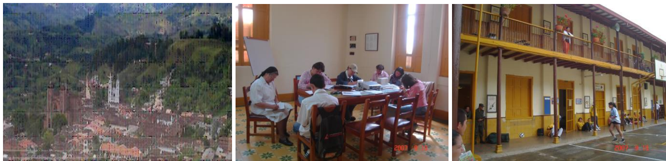
Fotografía Pulgarín, R. 2007.

“Formar en la libertad personas con valores ético, culturales, científicos y democráticos a fin de que se pueda responder a las exigencias que plantea el mundo actual, e integrarse a lo sociedad como ciudadanos competentes en civilidad y liderazgo para gestionar procesos comunitarios según contextos pertinentes, donde les corresponda actuar con calidad y responsabilidad como ciudadanos y especialmente desde la profesión docente”.