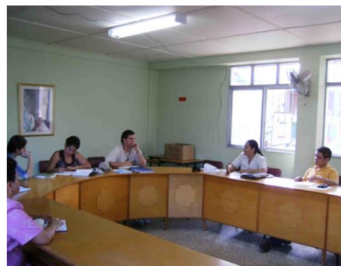
12/9/2008. E.N.S San Jerónimo.