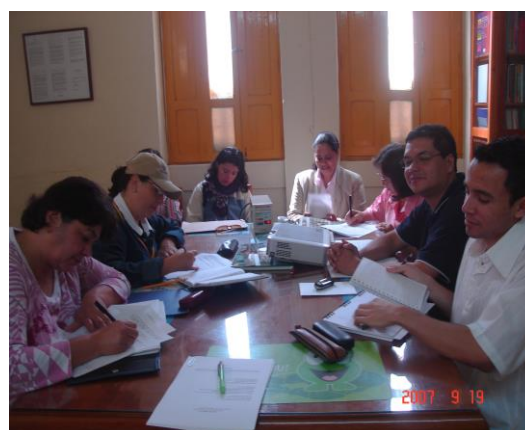
19/ 9/ 2007. E.N.S. de Jericó.