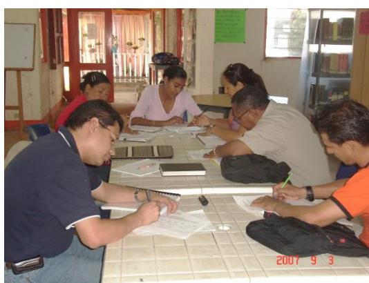
ENS del Bajo Cauca