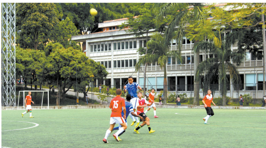
Festival de fútbol en la cancha sintética de la U. de A.