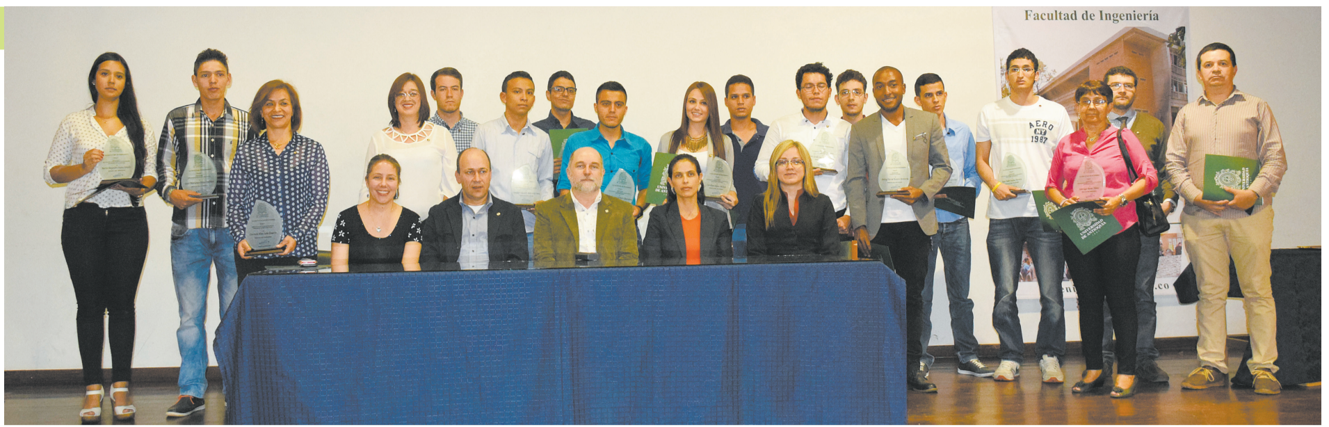
Profesores, estudiantes y empleados administrativos de la Facultad de Ingeniería distinguidos por su desempeño entre 2015 y 2016.

egresados y el trabajo mancomunado de las dependencias que sobresalen y generan día a día una mayor proyección y presencia de la Facultad de Ingeniería ante la comunidad local, nacional e internacional.