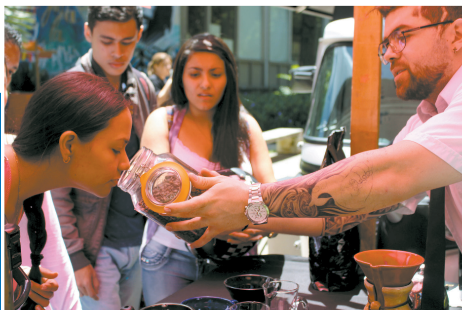
Bazar gastronómico organizado por Bienestar Internacional.