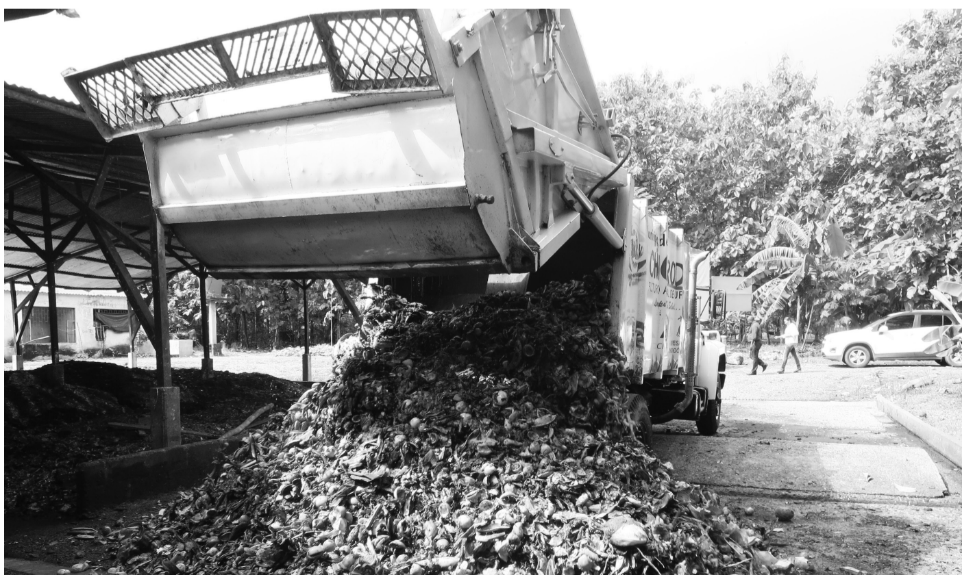
Carro de basura con carga orgánica en Chigorodó, Antioquia.