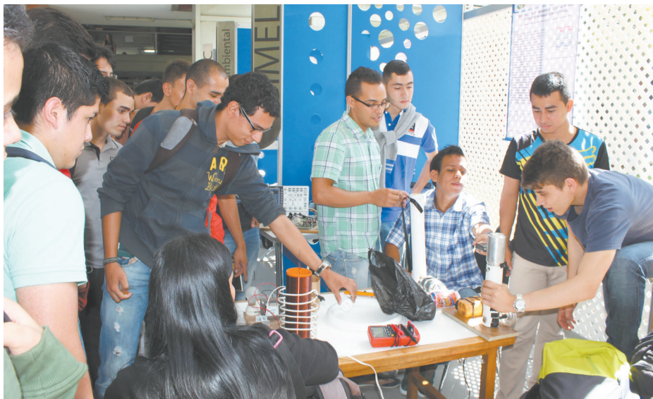
Los estudiantes visitaron e interactuaron en los proyectos de investigación.

Con una múltiple programación, los ingenieros celebraron su día clásico siempre proyectando una oferta que le apuesta a la formación integral y a la participación de todos los estamentos universitarios. ©