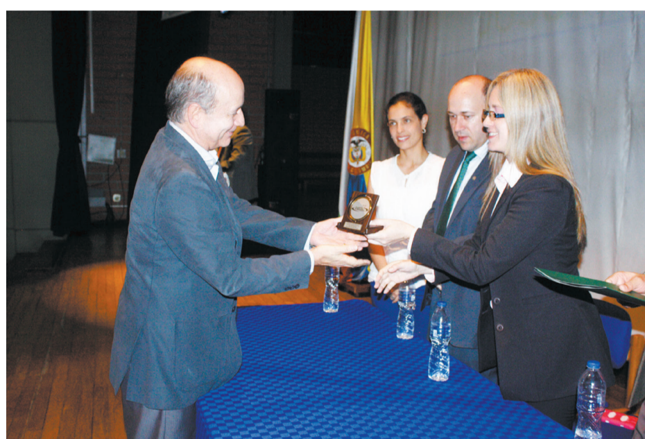
Entrega de distinciones a los mejores egresados de los programas de Ingeniería.

La Semana del Ingeniero en la Universidad de Antioquia se celebró entre el 16 y el 19 de agosto en diferentes espacios de la Ciudad Universitaria, principalmente en inmediaciones de la Facultad de Ingeniería. Este evento contó con el respaldo de la administración de la Facultad y fue organizado por la Unidad de Bienestar Universitario, el Centro de Extensión Académica (Ceset), la Unidad de Comunicaciones y el apoyo logístico del Departamento de Recursos de Apoyo e Informática (DRAI).