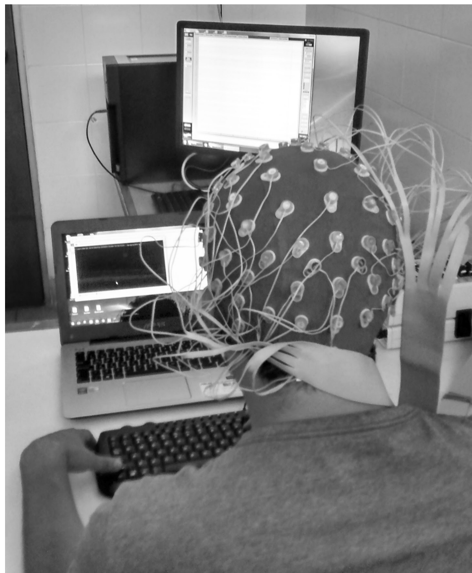
En los laboratorios se adelanta un proceso de interacción con las personas que han sido actores del conflicto.

Con este proyecto se pretende fortalecer las rutas de integración para que las comunidades o las personas que se encuentran en este proceso mejoren sus habilidades para ingresar a un programa educativo. De acuerdo con los investigadores “estos no siempre tienen la flexibilidad requerida para adaptarse a las situaciones de cada excombatiente, porque no se conocen las condiciones cognitivas de ellos. Además, en el proceso de construcción de paz en Colombia queremos contribuir a la construcción de ese tejido social para aportarle al país”.