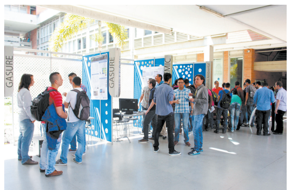
Muestra de grupos de investigación y sus proyectos.