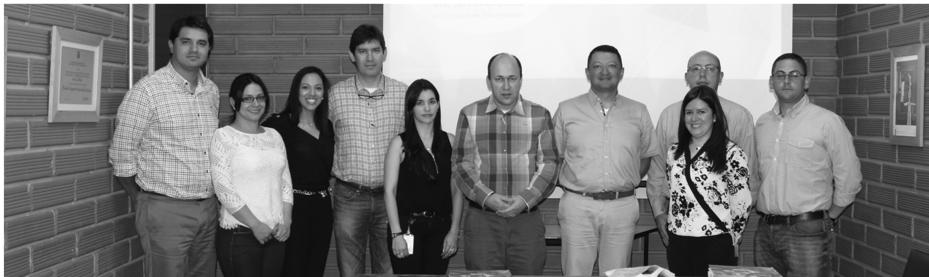
Directivas de la Facultad de Ingeniería de la U. de A. y de la Escuela de Comunicaciones del Ejército Nacional.