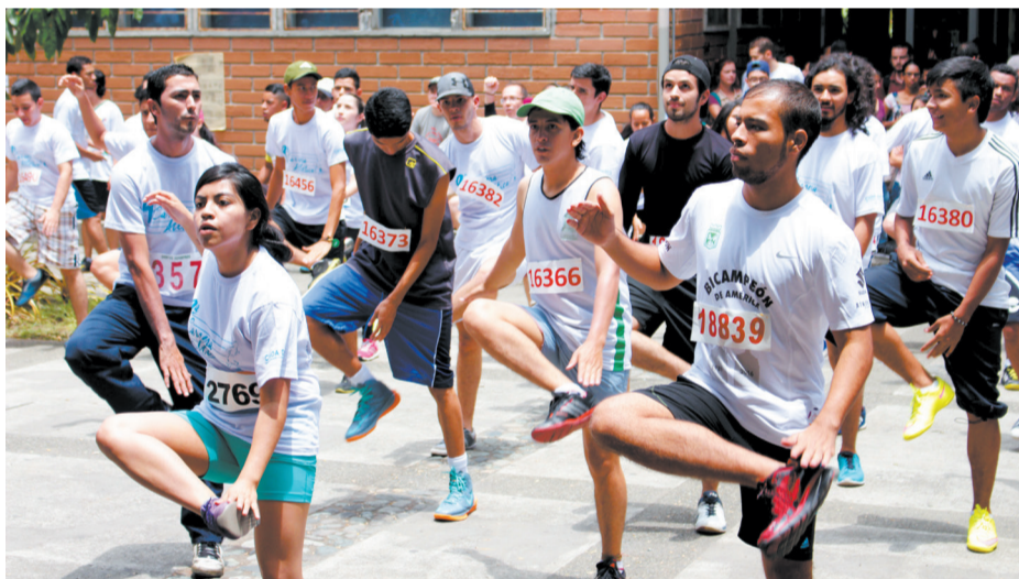
Festival de Atletismo y calentamiento para la Carrera Atlética.