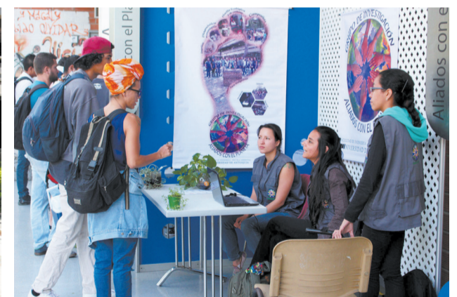
Muestra de grupos de investigación y sus proyectos.