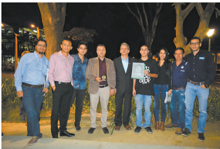
Encuentro de Egresados de Ingeniería 2016.