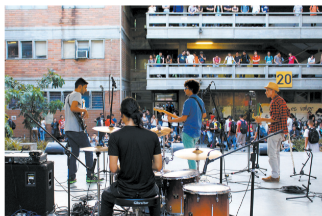
Muestra de talentos artísticos de la Facultad.

La Dirección de Investigación y Posgrado y la Unidad de Comunicaciones realizaron la Muestra de Investigación el pasado 17 de agosto en la que participaron 19 grupos de investigación de la Facultad de Ingeniería: Catálisis Ambiental, Gasure, Gimel, Giga, Gear, Gipimme, Sistemic, Gibic, Biomat,