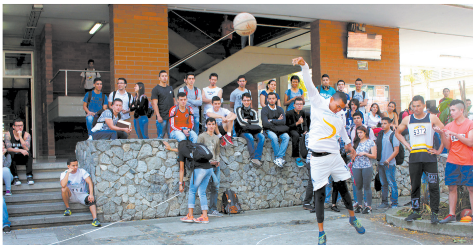
Festival de Atletismo organizado por la Unidad de Bienestar Universitario.