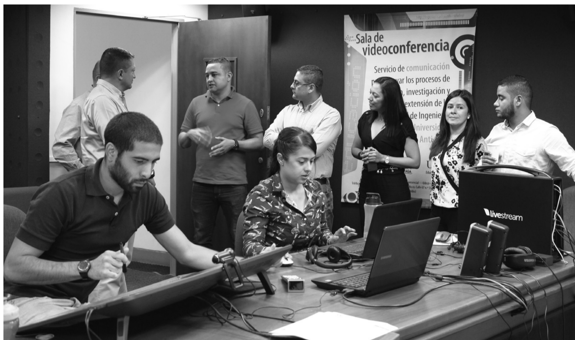
Los representantes de la ESCOM hicieron un recorrido por las Salas de Videoconferencia y demás instalaciones del Programa Ude@

Se trata de un convenio que favorece los programas de Ingeniería Electrónica e Ingeniería de Telecomunicaciones de la Facultad de Ingeniería, y posibilita el intercambio de profesores, estudiantes e investigadores con miras al logro, por parte de las dos instituciones, de una formación integral y excelencia académica.