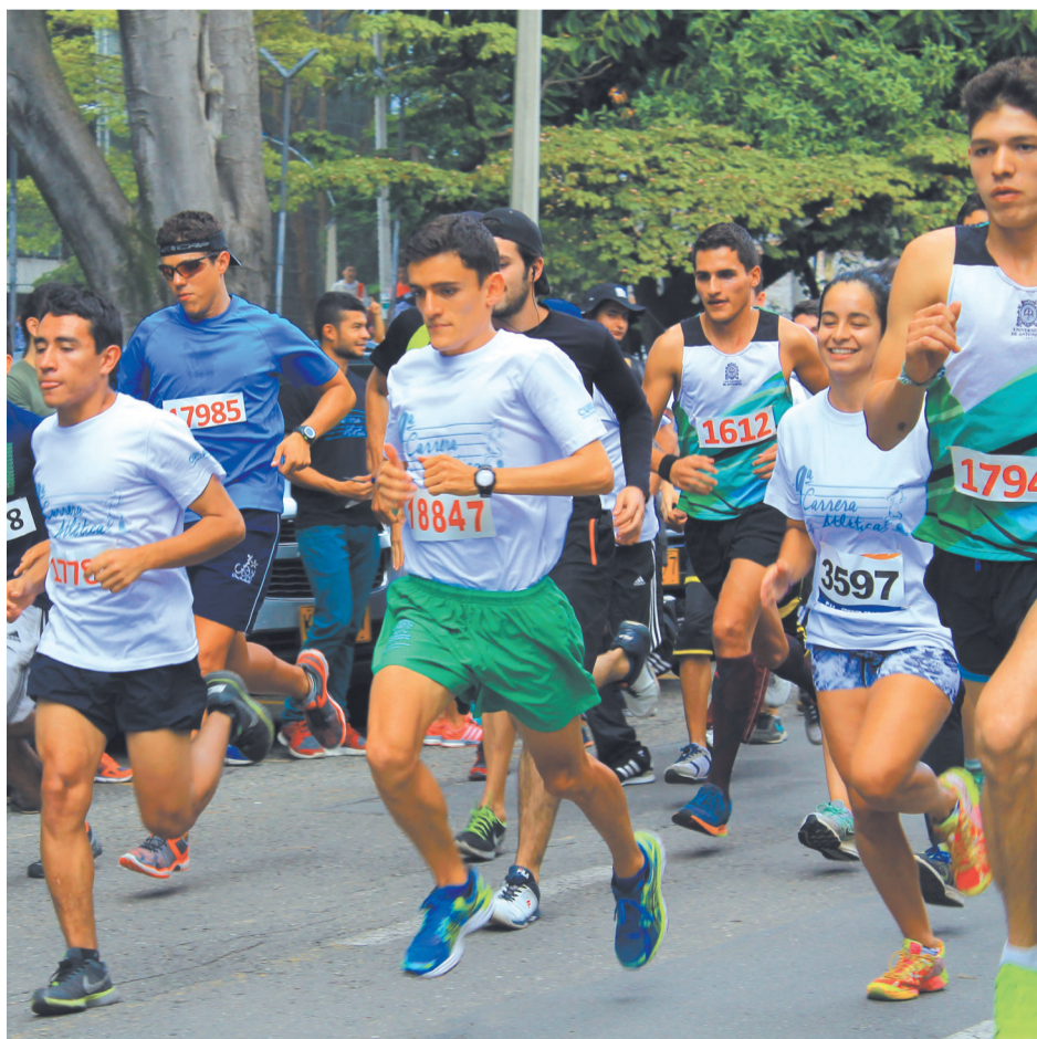
9ª Carrera Atlética Facultad de Ingeniería.