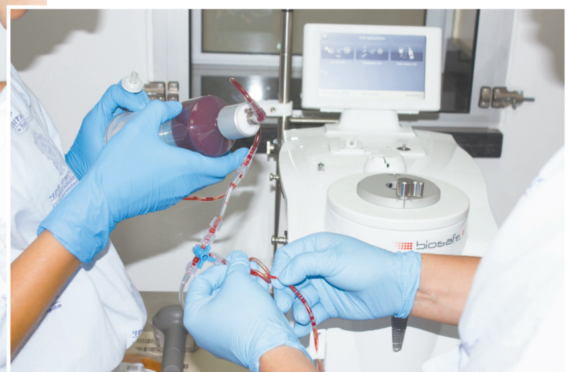
Laboratorios de terapia celular