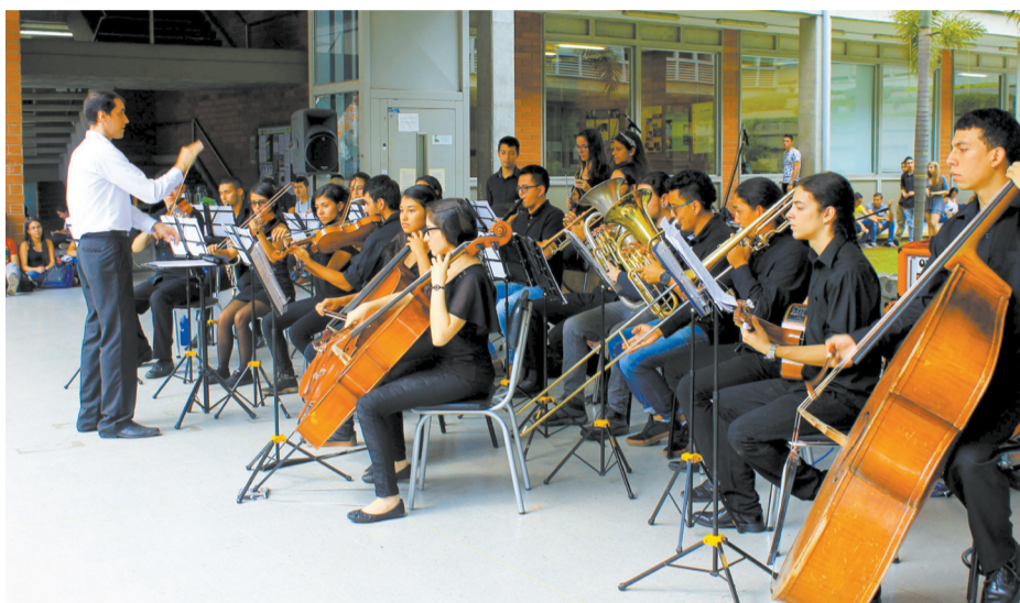
La presentación de bandas musicales y otros talentos artísticos universitarios amenizaron la Semana del Ingeniero 2016.