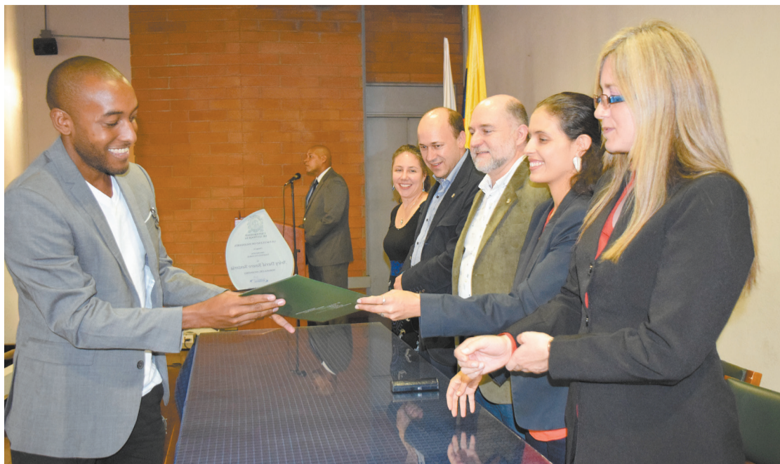
Ceremonia de distinciones y reconocimientos 2016.