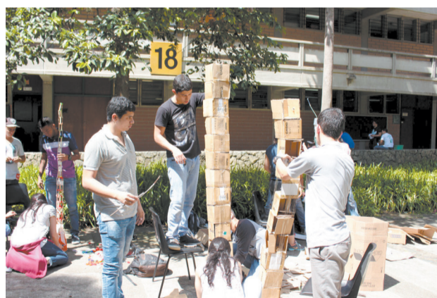
Concurso de la Torre más alta.