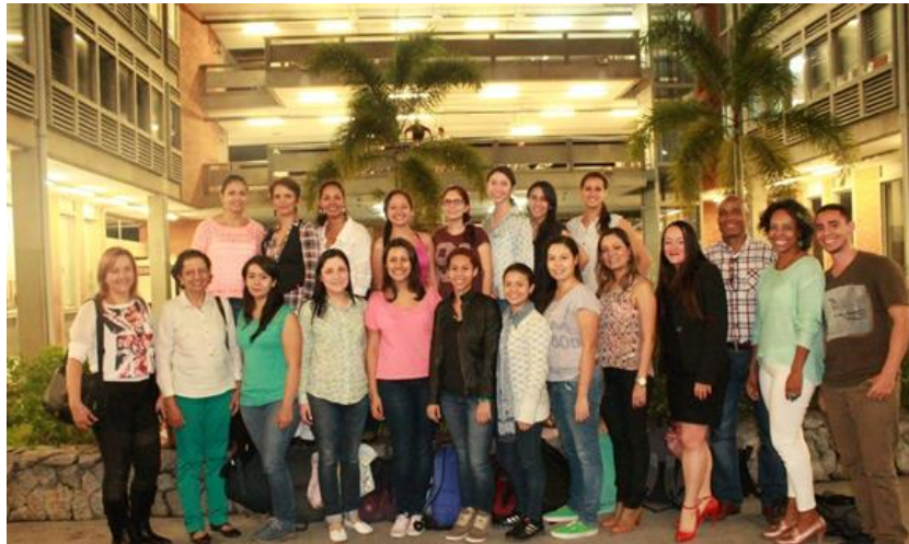
Imagen 3. Encuentro de egresadas del pregrado de ingeniería mecánica