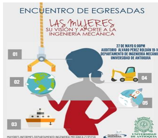
Imagen 4. Invitación al encuentro de egresadas del pregrado de ingeniería mecánica