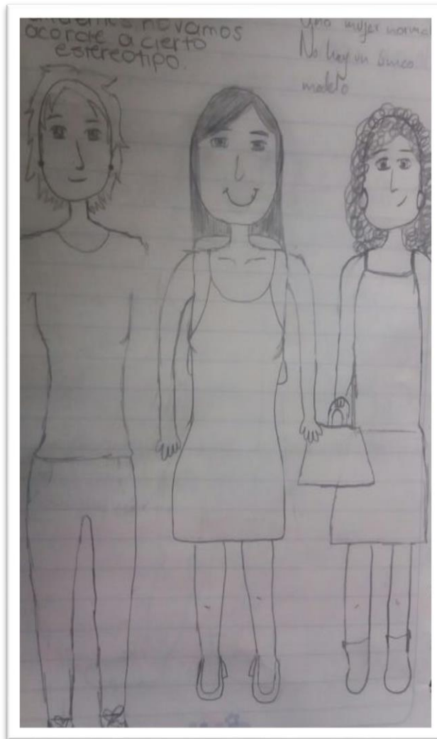
Figura 2. Cartografía social con mujeres ingenieras, realidad.