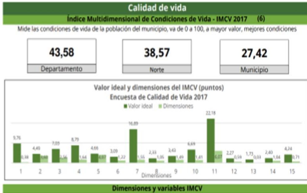
Figura 2 Calidad de vida

Nota Fuente: Plan de desarrollo Municipio de Valdivia 2020-2023