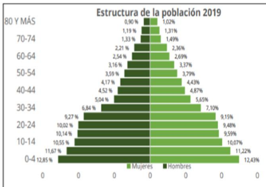
Figura 4 Pirámide poblacional

Nota Fuente: Plan de desarrollo Municipio de Valdivia 2020-2023